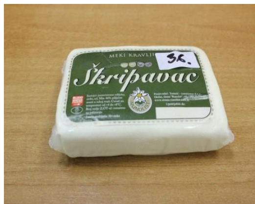
Slika 1. Sir Lički škripavac

Lički škripavac ima u pravilu cilindričan oblik, promjera cca. 15 cm, visine od 4-7cm a može imati i oblik koluta ili četvero-uglasti oblik kao što je prikazano na slici 1.