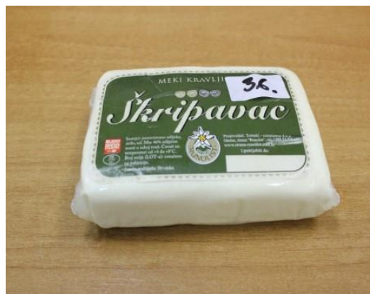
Slika 1. Sir Lički škripavac

Lički škripavac ima u pravilu cilindričan oblik, promjera cca. 15 cm, visine od 4-7cm a može imati i oblik koluta ili četvero-uglasti oblik kao što je prikazano na slici 1.