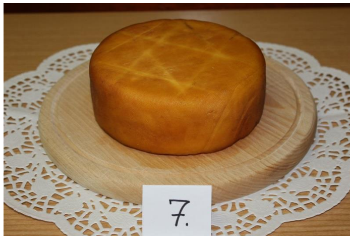
Slika 3. Kuhani sir - dimljeni

Za proizvodnju se koristi punomasno mlijeko (večernje i jutarnje mužnje), koje se procijedi kroz gazu te se zagrijava do vrenja. U tako zagrijano mlijeko, uz miješanje, dodaje se sol (2%), a nakon toga i alkoholni ocat (5%). Slijedi "mirovanje" i formiranje sirnog gruša te se započinje s drugim zagrijavanjem do temperature 88-98°C u trajanju do 20 min, do pojave bistre sirutke zelenkaste boje. Sirni gruš se premješta u pripremljene kalupe, odnosno vlažnu gazu. Slijedi prešanje sira, uz postupno povećavanje tlaka prešanja. Prešanje traje od 3-4 sata, a za to vrijeme okrene se 2-3 puta. S obzirom da postoji varijanta kuhanog sira koja je dimljena, nakon prešanja sir se može dimiti željenom vrstom drva, 3-4 sata (slika 3). Ukoliko nije predviđeno dimljenje sira, konzumacija je moguća neposredno nakon prešanja. Kuhani sir se konzumira u svježem stanju tj. bez zrenja. Ovakav sir, mladi i dimljeni, može se konzumirati unutar 3 mjeseca, ukoliko je pohranjen u hladnjaku pri temperaturi 4-8°C (Havranek, 2003).