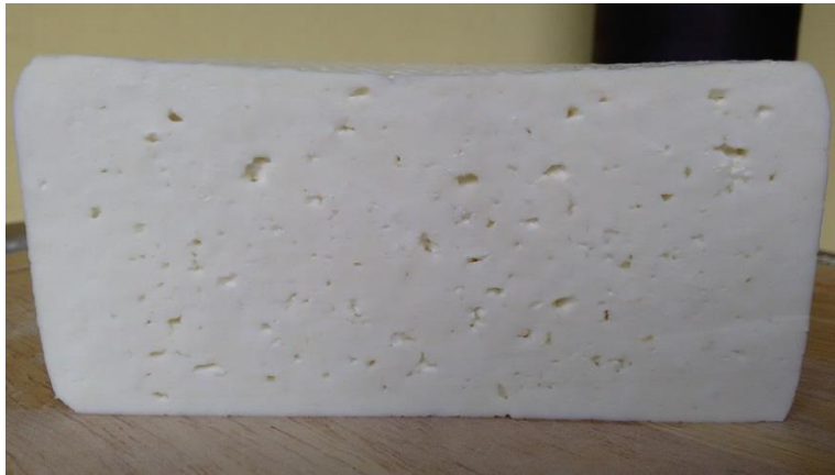
Slika 2. Prerez sira Lički škripavac

Masa sira je varijabilna, oko 1,2 kg, ali dozvoljena su odstupanja, od 0,9-1,6 kg (oblik koluta). Kora sira je bijele boje, međutim zrenjem postaje svijetlo žućkasta i jestiva. Sir je na prerezu zatvoren, a može imati manji ili veći broj mehaničkih otvora, nastalih zbog zadržavanja sirutke (slika 2). Konzistencija je gumasta, škripi pod zubima dok se konzumira, a okus je mliječni, slatkasti i umjereno slan (Magdić i sur., 2006).