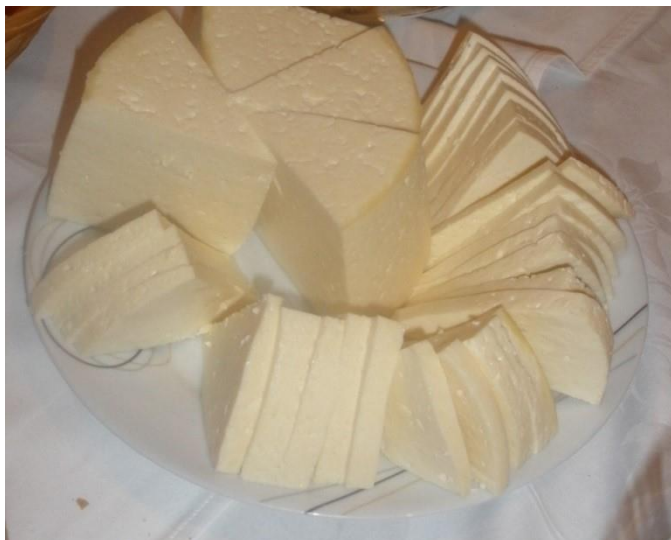
Slika 4. Kuhani sir