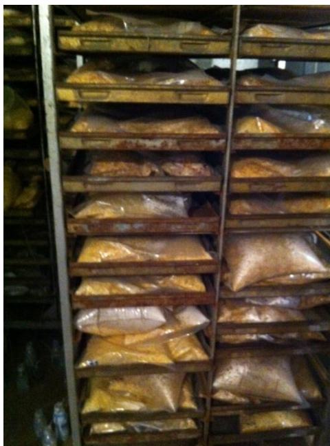
Slika 4. Čuvanje uzoraka

Vakumiranjem je inhibirana prva, aerobna, faza siliranja (Weinberg i Muck, 1996). Za svaki tretman pripremljeni su petroplikati vakumiranih uzoraka silaža. Uzorci silaže silirani su 182 dana, tijekom siliranja su čuvane na sobnoj temperaturi (20 do 25 °C; slika 4.). Nakon uzorkovanja, svi uzorci su pospremljeni i čuvani na -20 °C do provođenja kemijskih analiza. Neposredno prije provođenja analiza, uzorci su prosušeni na 40 °C 24 sata, i samljeveni kroz sito 1 mm (Cyclotec, FossTecator, Švedska)