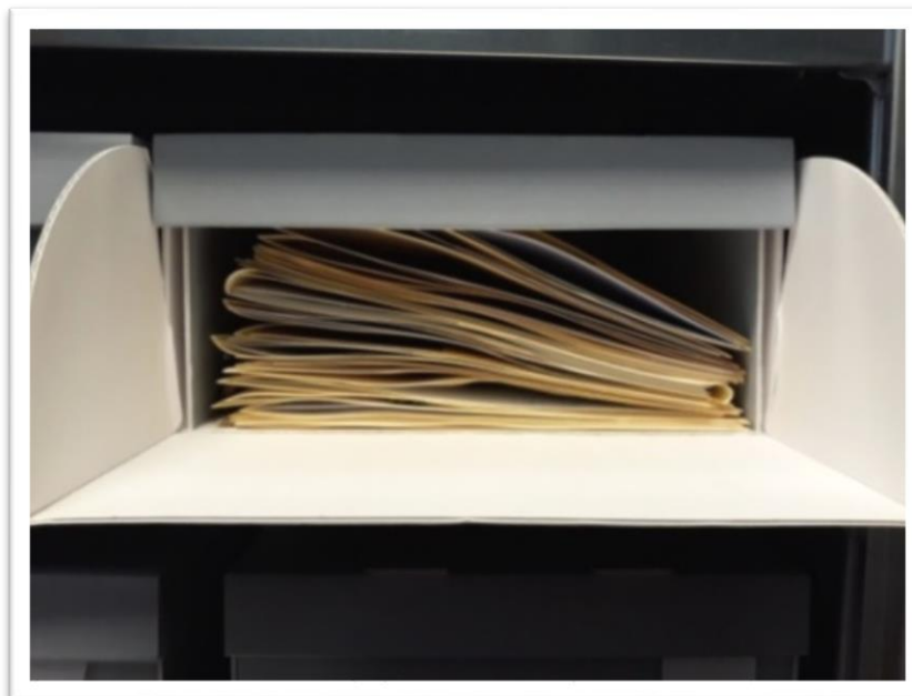
Slika 4. Kutija s mapama unutar kojih su herbarijski primjerci

Svi herbarijski primjerci pohranjeni su u herbarijskim kutijama od tvrdog papira (Slike 4 i 5). Kolekcija je organizirana abecednim redom generacije, a unutar herbarijske kutije nalaze se mape primjeraka (42,5 x 30,5 cm) koje su također sortirane abecednim redom vrste zbog lakšeg rukovanja.