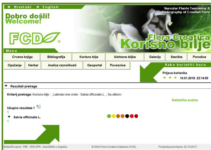
Slika 10. Izgled rezultata pretrage u sučelju Korisno bilje FCD-a