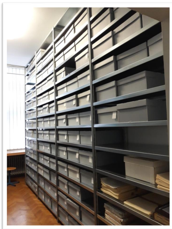
Slika 1. Herbarij Agronomskog fakulteta Sveučilišta u Zagrebu (ZAGR)

Herbarijska zbirka pohranjena je u posebnoj sobi Zavoda za poljoprivrednu botaniku Agronomskog fakulteta Sveučilišta u Zagrebu (Svetošimunska cesta 25) gdje je srednja godišnja temperatura od 15°C do 18°C, a vlažnost zraka približno 30 % (Slika 1).