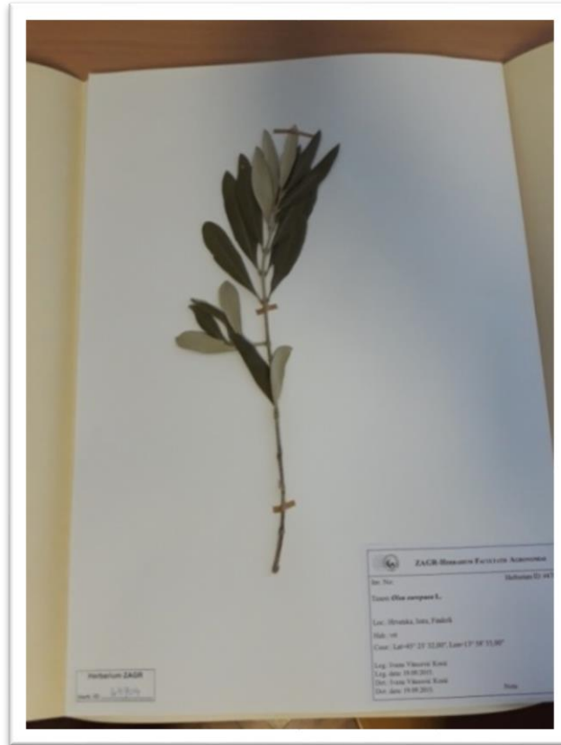
Slika 2. Herbarijski primjerak masline iz ZAGR Herbarija

Prema Bogdanoviću i sur. (2016.), nakon sušenja biljni materijal se zamrzne na -20 °C tri do četiri dana (dva puta se ponavlja ovaj postupak) kako bi ga sačuvali od oštećenja. Biljni materijal se fiksira pH neutralnom ljepljivom trakom na herbarijski papir veličine 42,5 x 29 cm dok se etiketa lijepi s Gaylord pH neutralnim bijelim ljepilom (Slika 2).