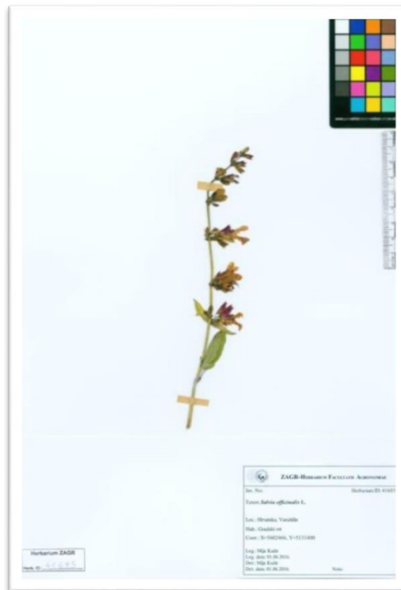
Slika 6. Digitalizirani herbarijski primjerak iz ZAGR Virtualnog Herbarija