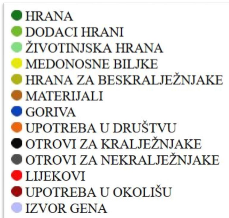
Slika 9. Glavne skupine ekonomske upotrebe biljaka

Međunarodni standard za ekonomsku botaniku sadrži 13 glavnih skupina ekonomske upotrebe biljaka koji su prikazani na slici 9.