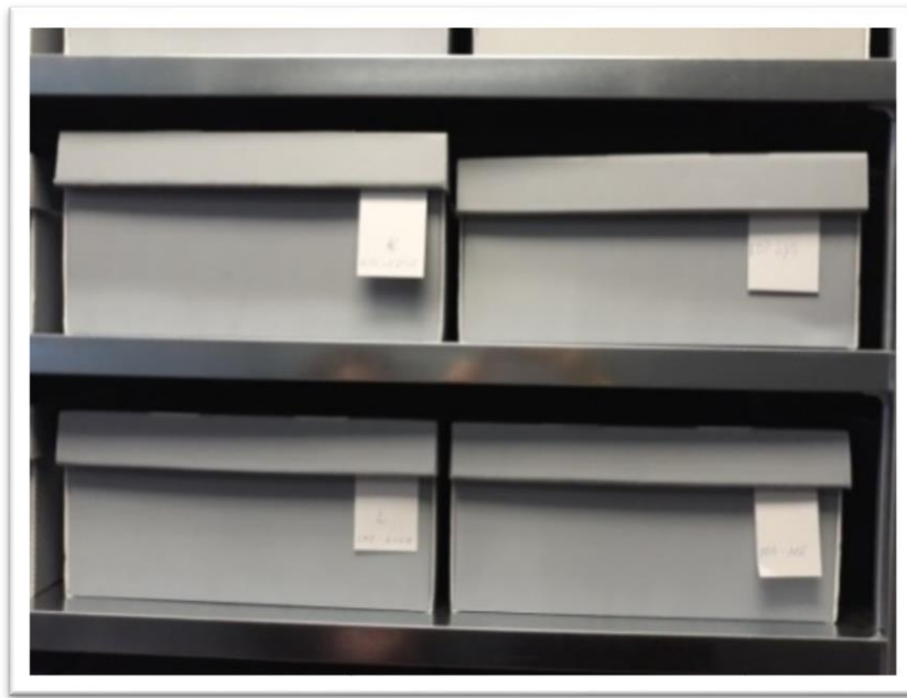
Slika 5. Kutije u kojima se čuvaju herbarijski primjerci