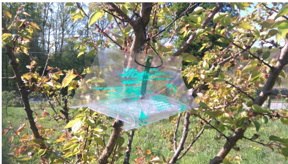
Slika 6. Csalomon feromonska lovka

Istraživanje je provedeno na pokušalištu Jazbina Agronomskog fakulteta Sveučilišta u Zagrebu tijekom 2017. godine. Praćenje leta leptira breskvinog i šljivinog savijača provedeno je u nasadu šljive i marelice. U praćenju su korištene feromonske lovke mađarske tvrtke Csalomon (Slika 6). Feromonske lovke su postavljene 3. travnja. Feromonska lovka za šljivinog savijača postavljena je u voćnjak šljive, a za breskvinog savijača na marelicu u blizini šljive. Dvije vrste feromona su korištene iz razloga što feromon za breskvinog savijača privlači i šljivinog savijača. Korištena su dva feromona iz razloga da se uspoređi atraktivnost feromona za breskvinog savijača na šljivinog savijača. Od postavljanja feromonskih lovki do kraja pregleda lovki 9. kolovoza 2017. obavljeno je 18 očitavanja. Feromonske lovke su se mijenjale svakih 30 dana, a ljepljivi podlošci svakih 7 do 10 dana (Slika 7).