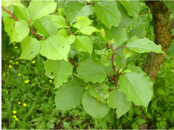
Slika 1. List marelice