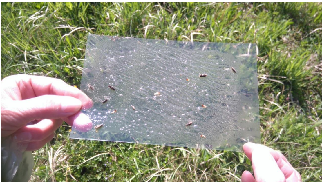
Slika 7. Ulov leptira na feromonskoj lovci