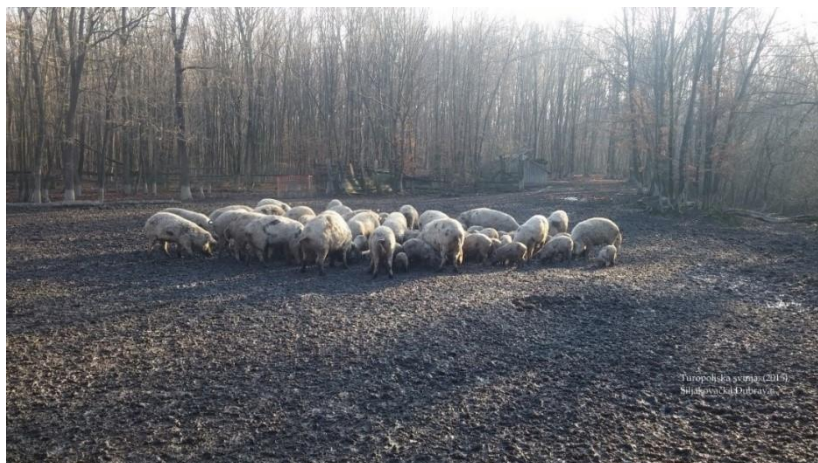
Slika 2.3. Turopoljska svinja u otvorenom sustavu

Nedostatak otvorenog sustava držanja je slabija mogućnost kontrole nad životinjama te češća pojava nekih bolesti. Tako su svinje koje se drže na otvorenom sklonije parazitarnim invazijama ili zaraznim bolestima, ukoliko dođu u kontakt sa divljim životinjama ili mikroorganizmima, dok rjeđe obolijevaju od crijevnih ili respiratornih bolesti. Životinje slobodno borave na pašnjacima ili u šumama te im je na taj način osigurano dovoljno prostora čime je smanjena mogućnost ozljeda. Poželjno je da se pašnjaci nalaze na što ravnijem terenu te da je tlo propusno. Potrebu za hranom velikim djelom zadovoljavaju koristeći se prirodnim izvorima, kao što su žir ili paša, a prihranjuju se koncentriranim krmivima (Karolyi i sur. 2010.)