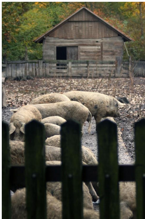
Slika 2.4. Drveni objekt za zaštitu životinja

Povremeno je potrebna rotacija životinja odnosno odmor površina kako bi se spriječila invazija parazitima. Danju se životinje slobodno kreću na pašnjacima i šumama dok se noću i tijekom zimskog vremena zatvaraju u objekte (Pejaković 2002.). Na slici 2.4. prikazana je ograđena površina te drveni objekt za zaštitu životinja. Površine na kojima se uzgajaju svinje moraju biti ograđene kako bi se spriječio kontakt sa divljim životinjama. Najčešće se za to koriste drvene ograde ili njihova kombinacija sa žicom. Unutar ograđene površine potrebni su jednostavni objekti za zaštitu životinja od sunca tijekom ljetnih mjeseci ili zaštitu od oborina i hladnoće tijekom zime (Slika 2.4.). Oni su najčešće izgrađeni od drvenog materijala, ali mogu se koristiti i limeni objekti koji su prenosivi. Objekti trebaju biti dobro nasteljeni kako bi se postigla odgovarajuća temperatura u zimskim mjesecima. Osim toga, unutar ograđene površine se nalaze hranilice i pojilice koje moraju uvijek biti dostupne životinjama. Izgrađene su od nehrđajućih materijala kako bi se lakše održavale, te uvijek moraju biti čiste.