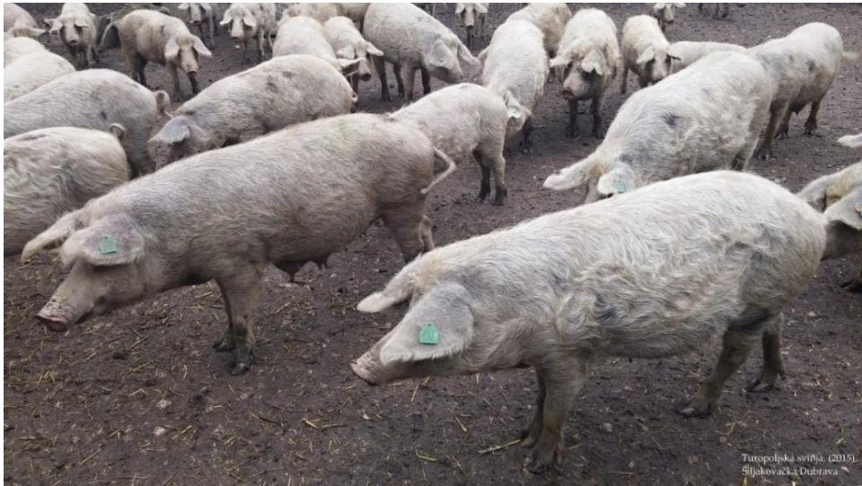
Slika 2.2. Turopoljska svinja

da imaju veću vrijednost mesa u odnosu na ostale primitivne pasmine, da je meso tamnije boje te da imaju visok stupanj prilagodljivosti na okolinu.