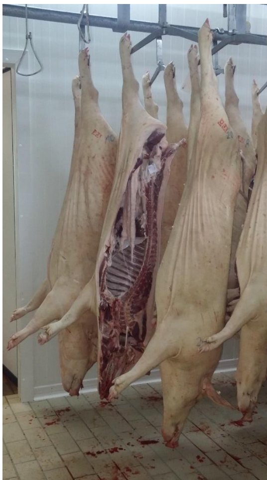
Slika 3.1. Klaonički obrađeni trupovi turopoljskih svinja

Istraživanje je provedeno na uzorku od 20 svinja turopoljske pasmine, od čega 13 kastrata i 7 nazimica. Svinje su uzgajane u gateru pokušališta Agronomskog fakulteta iz Zagreba u Šiljakovačkoj Dubravi kraj Velike Gorice u sklopu Projekta TREASURE financiranog iz programa Europske unije za istraživanje i inovacije Obzor 2020 (br. Ugovora 634476). Držane su u svom prirodnom okruženju, na otvorenom. Svinje su hranjene prirodnom hranom koja je uključivala šumsku ispašu te su prihranjivane koncentratom (gotova krmna smjesa ST 2, Fanon, d.o.o.) . Prosječna dob tovljenika prije klanja iznosila je 18,15 \pm 1,4 mjeseci, a završna masa 94,8 \pm 11,5 kg. Klanje i klaonička obrada tovljenika obavljani su prema standardnoj proceduri (Slika 3.1.) u obližnjem odobrenom klaoničkom objektu (Klaonica 32 d.o.o., Velika Mlaka). Klaonička masa hladnog trupa određena je vaganjem ohlađenih polovica 24 h post mortem . Hladni randman (%) je izračunat korištenjem formule: (masa hladnih polovica/živa masa prije klanja)x100.