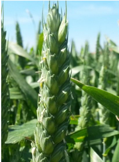
Slika 4.3.3.1. Jara pšenica cv. Goranka

(oko 306) W vrijednost je visoka (oko 347) P/L vrijednost je izbalansirana (oko 0,71). Težina 1000 zrna u prosjeku iznosi oko 46 g. Kod ove sorte sve komponente prinosa imaju otprilike isti utjecaj na prinos što ovu sortu čini vrlo fleksibilnom. Optimalni rok sjetve je od 20. listopada do 10. studenog Norma sjetve u ovom periodu je 360 do 380 klijavih zrna/m 2 (od 185 do 200 kg/ha). U slučaju bujnog usjeva preporuča se umjerena primjena regulatora rasta (RWA Hrvatska d.o.o.).