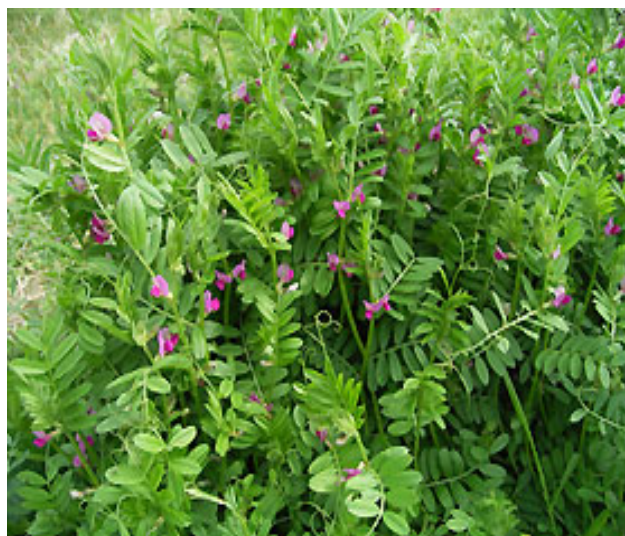
Slika 4.3.1.2. Jara grahorica cv. Ebena