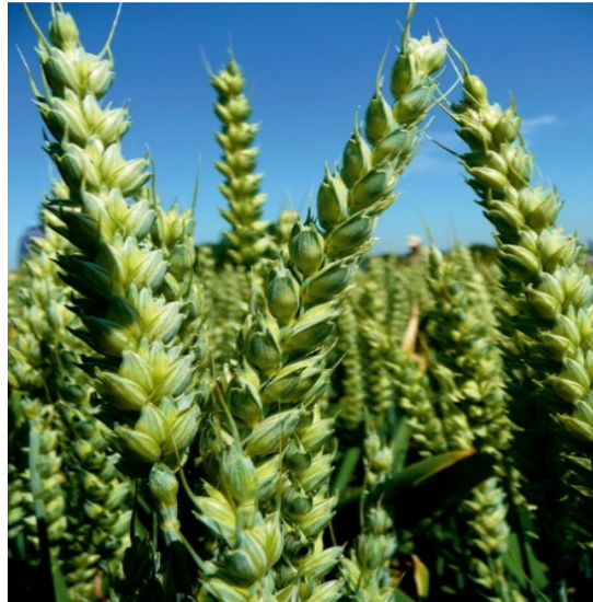
Slika 4.3.3.2. Jara pšenica cv. Lennox