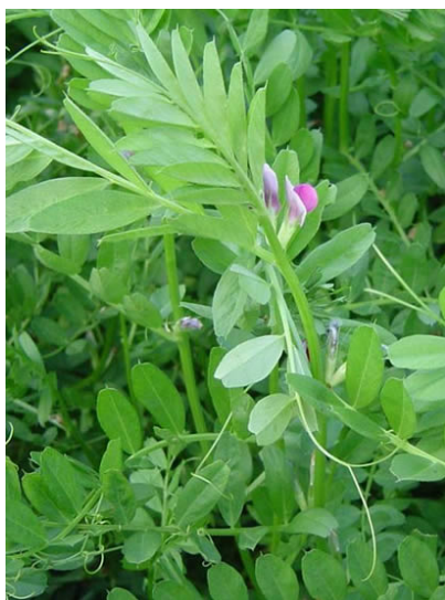
Slika 4.3.1.1. Jara grahorica cv. Jaga

grahorice je mahuna, a sjemenke su okruglaste, malo spljoštene i ljubičastosmeđe boje (Gagro, 1997).