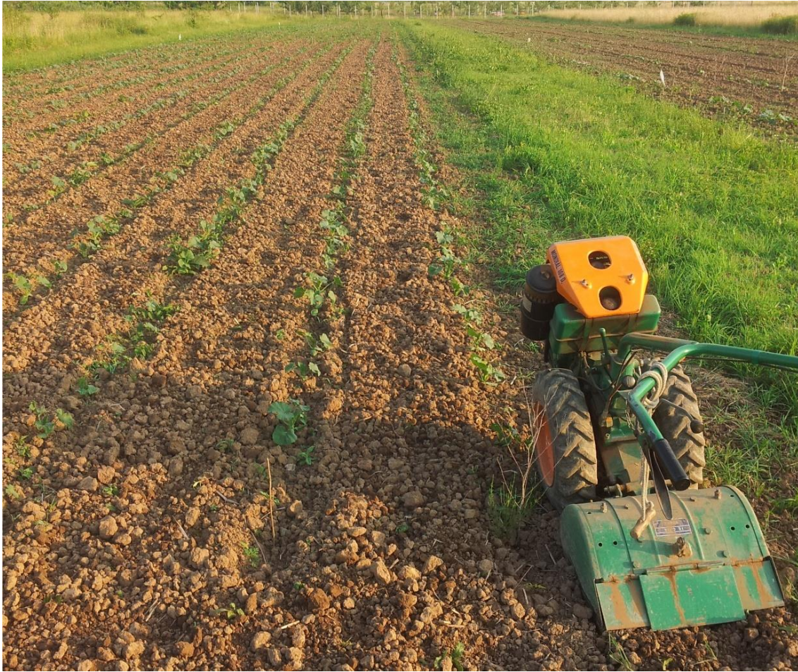
Slika 5.3.3. Međuredna kultivacija samohodnom frezom