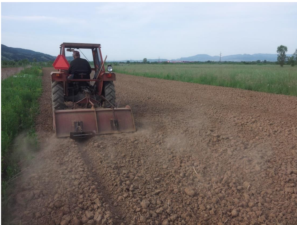
Slika 5.3.1: Predsjetvena obrada tla frezom i formiranje jaraka

U ovom pokusu predusjev uljnim bučama bio je krumpir. Nakon vađenja krumpira, u jesen je obavljeno oranje na 30 cm dubine. Prilikom oranja u tlo je uneseno 175 kg/ha NPK gnojiva formulacije 7:20:30. Predsjetvena obrada tla obavljena je traktorskom frezom neposredno prije sjetve (slika 5.3.1.). Prije predsjetvene obrade tla primijenjeno je 75 kg/ha NPK gnojiva formulacije 7:20:30 i 100 kg/ha UREE te su napravljani plitki jarci dubine 4 - 5 cm, razmaka 0,9 m i 2,0 m za polaganje sjemena.