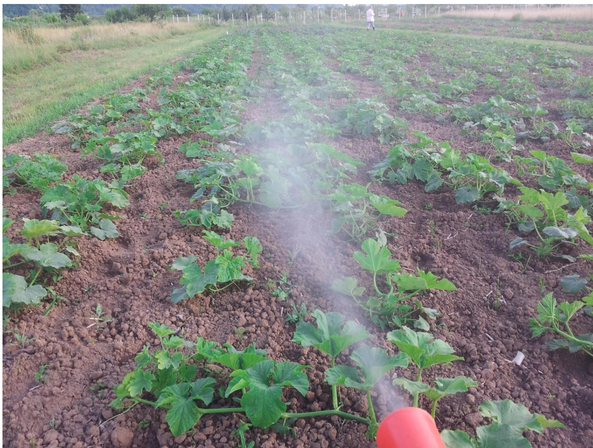
Slika 5.3.4. Tretiranje usjeva fungicidom Switch 62,5 WG