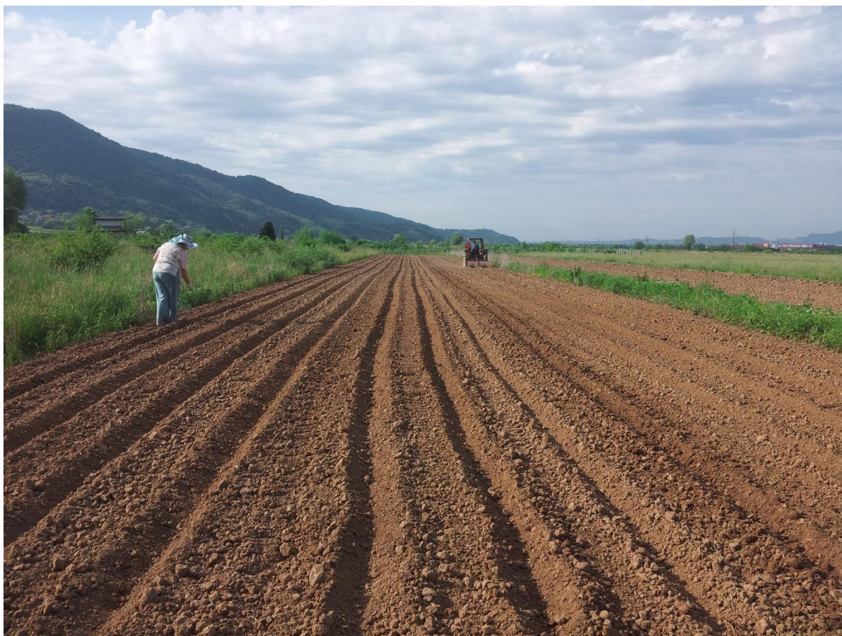
Slika 5.3.2: Sjetva uljne buče golice