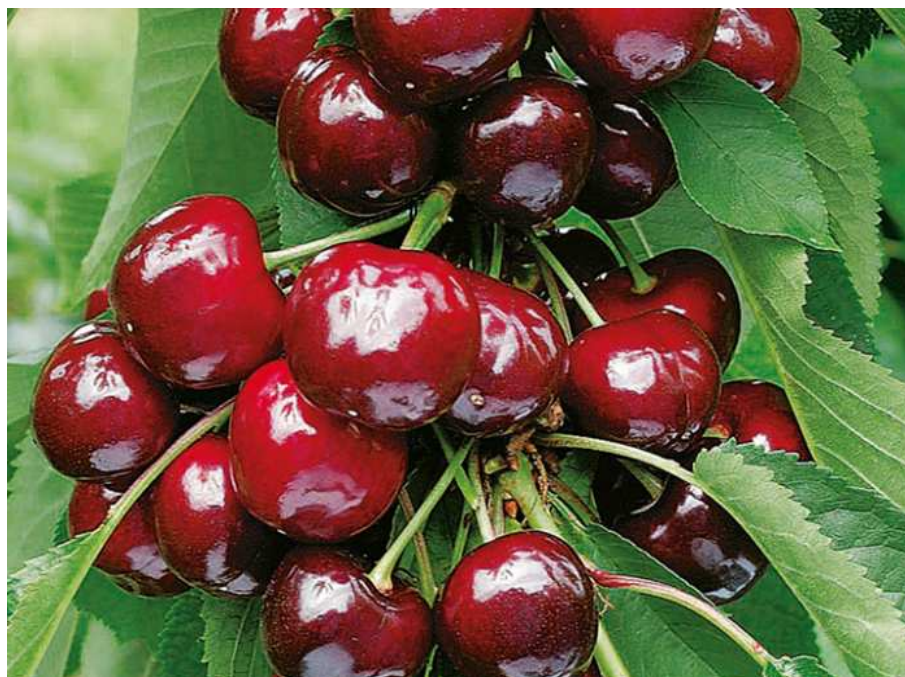
Slika 2.6.2 .1. Plod sorte 'Kordia'