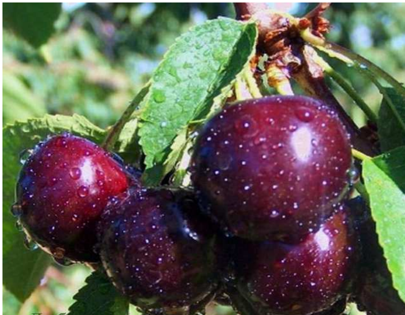
Slika 2.6.4.1 Plod sorte 'Ohridska Crnica'

Sorta Ohridska crna (Slika 2.6.4.1.) raste oko Ohridskog jezera koje se nalazi na granici Makedonije i Albanije. Ovo je sorta srednje bujnog rasta, a krošnja je dobro razgranata. Daje plodove tamno crvene do crne boje, srednje do velike krupnoće. Sorta Ohridska crna je trešnja kasnog cvata, a sazrijeva u srpnju mjesecu.