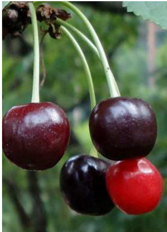
Slika 2.2.7.1. Plod trešnje