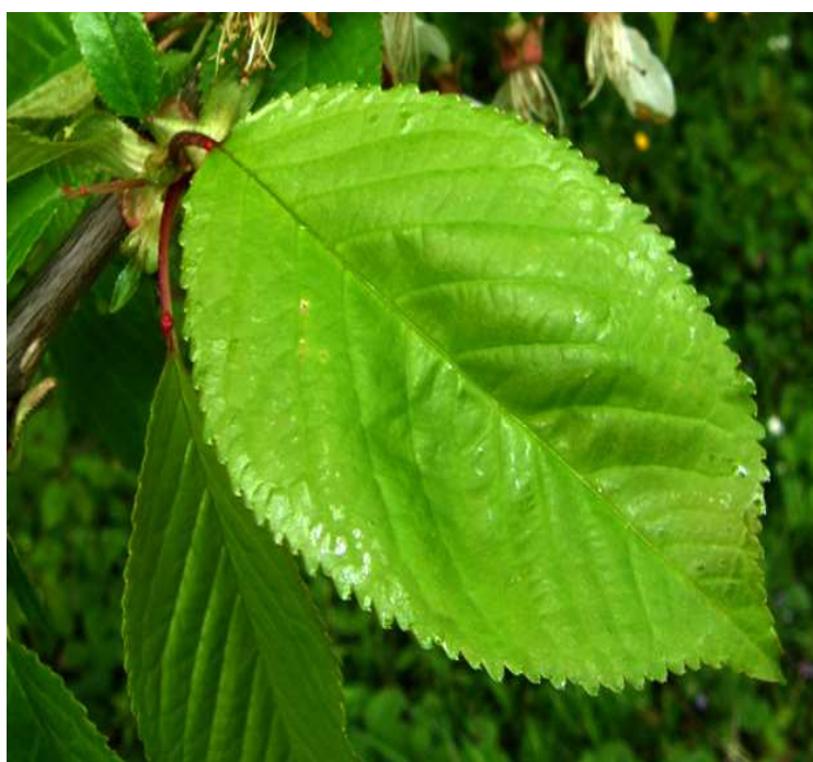
Slika 2.2.6.1. List trešnje

Dužina peteljke je sortno svojstvo i doprinosi pravilnoj determinaciji sorti trešnje (Mitrović, 1982). Prema nekim autorima, duža peteljka se navodi kao prednost, zbog olakšane berbe i manjeg truljenja plodova (Brown i sur., 1996), dok prema drugima kraća peteljka intenzivno zelene boje asocira kupce na svježinu i sočnost ploda (Schick i Toivonen, 2000). Albertini i Della Strada (2001) navode da se sorte 'Kordia', 'Karina' i 'Regina' odlikuju dugom peteljkom, dok je peteljka sorte 'Summit' srednje duga. Milatović i sur. (2011) ističu da plodovi sorte 'Summit' imaju srednje dugu, a sorte 'Kordia' i 'Regina' dugu peteljku. Masa peteljke sorti trešnje je relativno mala do 0,1 g ( Stančević i sur., 1988).