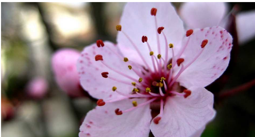
Slika 2.2.7.1. Cvijet trešnje

Glavni oprašivači trešanja su pčele. Cvatnja traje tri do četiri dana, a započne kad srednje dnevne temperature dosegnu od 8 do 15 °C.