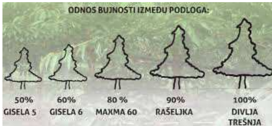
Slika 2.5.1 Prikaz odnosa bujnosti između podloga

podloge, odnosno sjemenjak divlje trešnje ( Prunus avium ) i sjemenjak rašeljke ( Prunus mahaleb ); a od vegetativnih Gisela, F 12/1 i Colt.