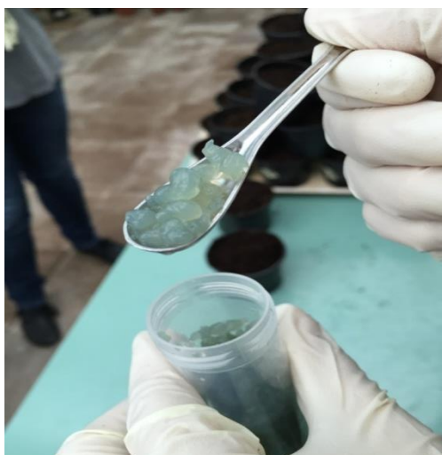
Slika 3.1. Izgled mikrokapsula STP + Ca prije aplikacije na biljku.