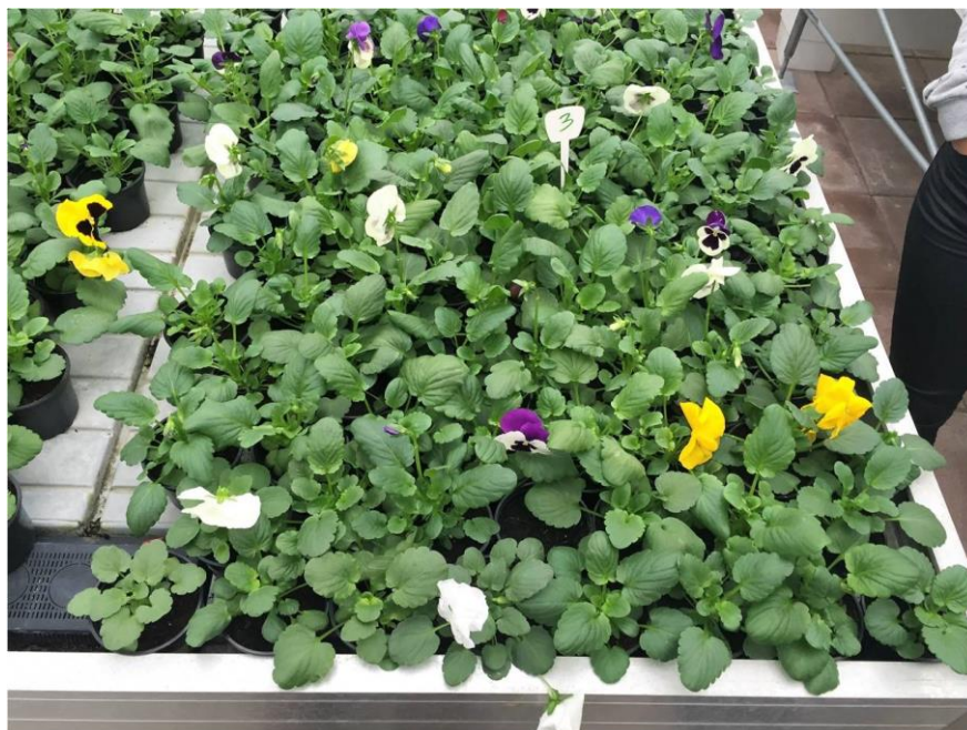
Slika 2.7. Viola x wittrockiana Gams. u cvatu.

Vrsta Viola x wittrockiana Gams je nastala križanjem divljih vrsta iz porodice Violaceae ( Viola tricolor , Viola luteae , Viola cornuta i Viola altaica ). Od kad je nastala pa do danas stvoren je velik broj sorata, među najpoznatijim su: Azure Blue, Sunny boy te Celestial Queen (Bačvanski, 2011.). Maćuhicu odlikuju cvjetovi s pet latica koje se međusobno preklapaju, promjera i do 8 cm (Slika 2.7.). Dolaze u raznim kombinacijama boja: bijela, žuta, plava te ljubičasta s karakterističnim tamnijim dijelom. Za razliku od višebojnih na tržištu su prisutne i jednobojne sorte (Kukoč 2005.). Najbolje uspjeva na svijetlom mjestu na rastresitom tlu bez previše vlage. Visina same biljke varira, a obično se kreće između 15 do 20 centimetara, dok je širina 10 do 20 centimetara.