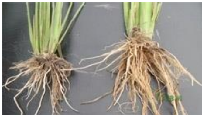
Slika 2.2. Prikaz razlike između normalnog korijena i korijena u mikorizi vrstom T. viride 3 .

Trichoderma vrste nastanjuju različite tipove tla od šumskih do poljoprivrednih. S obzirom na to da su pravi mikroorganizmi idealno mjesto na kojem se nastanjuju je korijenov sistem. Korijenov sistem vrstama roda Trichoderma predstavlja idealno mjesto za pronalaženje drugih vrsta filamentoznih gljiva, koje su najčešće uzročnici biljnih bolesti biljke domaćina. Uništavajući uzročnike biljnih bolesti Trichoderma vrste štite biljku od infekcija od strane fitopatogenih gljiva te je korijen, koji je u mikorizi, bujniji nego onaj koji nije u mikorizi (Slika 2.2.).