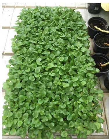
Slika 3.2. Presadnice mačuhice spremne za presađivanje u supstrat.