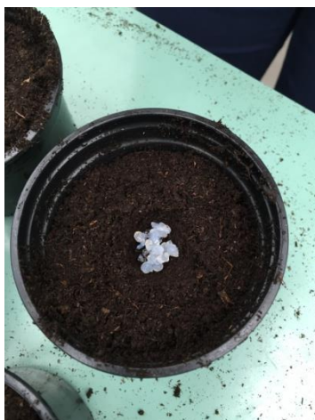
Slika 3.3. Izvršena aplikacija mikrokapsula STP+ Ca nakon odvage.