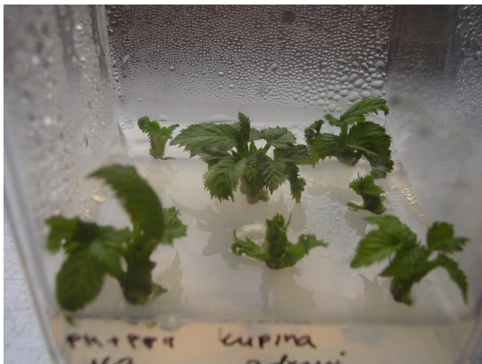
Slika 3.4.1. Izdanci na PM mediju nakon supkultivacije s medija za uspostavljanje kulture

Vegetacijski vršci izolirani su aseptično pod stereomikroskopom iz aksilarnih pupova i postavljeni na medij za uspostavljanje kulture (EM - eng. Establishment Medium ). Izdanci su jednom bili supkultivirani na PM 1 medij (eng. Proliferation Medium ) prije proizvodnje dovoljnog broja izdanaka (Slika 3.4.1.) za postavljanje pokusa. Koncentracija željeza u PM mediju udvostručena je u odnosu na EM medij, a promijenjen je i sastav regulatora rasta (Tablica 3.3.1.). Na ovom su mediju izdanci supkultivirani dva puta tj. do proizvodnje dovoljnog broja izdanaka za postavljanje pokusa.