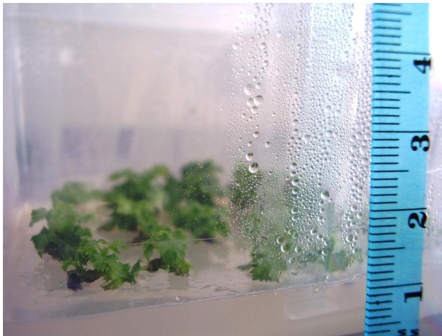
Slika 4.3.3. Izdanci dobiveni aksilarnim grananjem na MS PM BAP 0,3