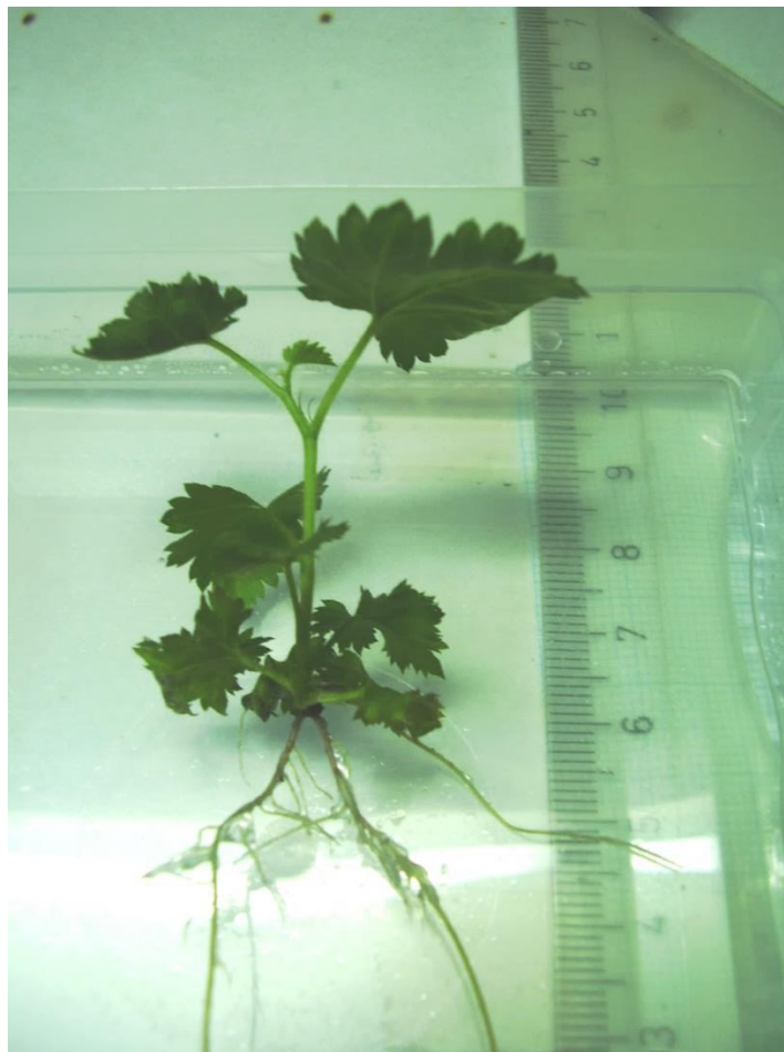
Slika 4.4.1. In vitro zakorijenjena biljka na HF RM