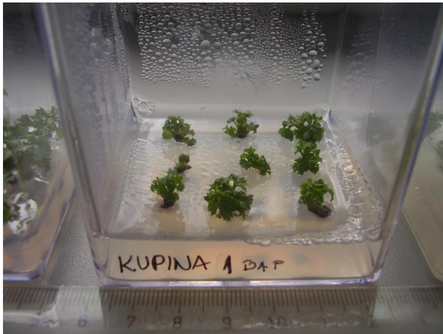
Slika 4.3.1. Izdanci dobiveni aksilarnim grananjem na MS PM BAP 1

*vrijednosti označene istim slovom unutar kolone ne razlikuju se signifikantno prema Duncan-ovom testu