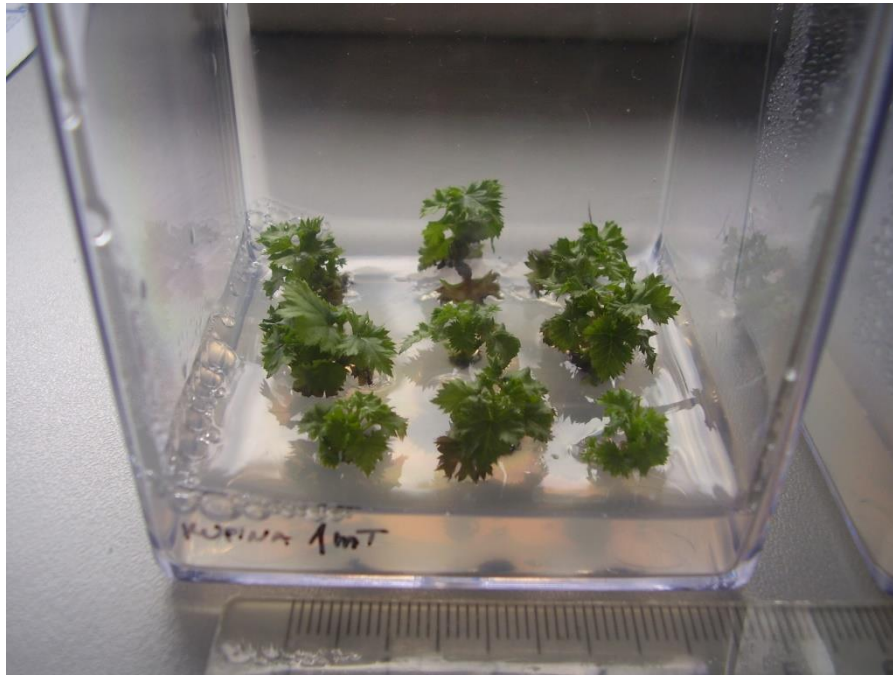
Slika 4.3.2. Izdanci dobiveni aksilarnim grananjem na MS PM mT 1