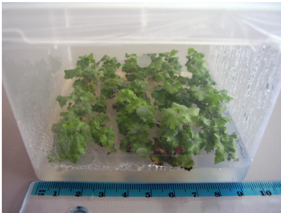
Slika 4.3.4. Izdanci dobiveni aksilarnim grananjem na MS PM mT 0,3