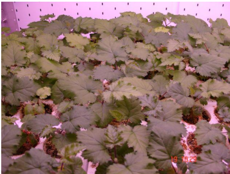
Slika 4.4.2.. Aklimatizirane biljke kupine

Zbog dobro razvijenog korijenja uspješnost aklimatizacije bila je vrlo visoka (Slika 4.4.1.). Aklimatizaciju je preživjelo 92% biljaka zakorijenjenih na HF RM (bez hormona) i 95% biljaka zakorijenjenih na IAA RM (medij s 1 mg/L IAA) (Slika 4.4.2.).