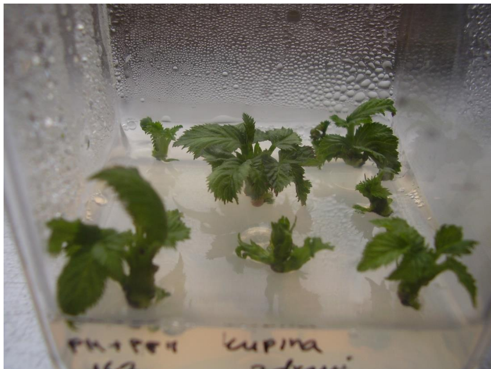
Slika 3.4.1. Izdanci na PM mediju nakon supkultivacije s medija za uspostavljanje kulture

Vegetacijski vršci izolirani su aseptično pod stereomikroskopom iz aksilarnih pupova i postavljeni na medij za uspostavljanje kulture (EM - eng. Establishment Medium ). Izdanci su jednom bili supkultivirani na PM 1 medij (eng. Proliferation Medium ) prije proizvodnje dovoljnog broja izdanaka (Slika 3.4.1.) za postavljanje pokusa. Koncentracija željeza u PM mediju udvostručena je u odnosu na EM medij, a promijenjen je i sastav regulatora rasta (Tablica 3.3.1.). Na ovom su mediju izdanci supkultivirani dva puta tj. do proizvodnje dovoljnog broja izdanaka za postavljanje pokusa.