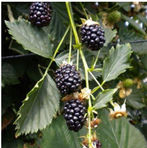
Slika 2.1.2.1. Kupina sorte "Reuben"