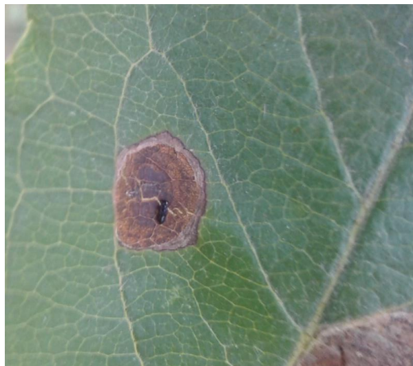
Slika 7. Parazitirana gusjenica (original)

Osim kemijskog suzbijanja, iako kod nas još nije korišteno ciljano biološko suzbijanje, u prirodi postoje mnoge vrste prirodnih neprijatelja lisnog minera okruglih mina, uglavnom parazitoida (slika 7.) i predatora, a istraživanjima u Italiji utvrđeno je da su populacije prirodnih neprijatelja dovoljne za kontrolu lisnog minera okruglih mina, uz uvjet da se izbjegne bilo kakav negativan učinak kemijskih sredstava za zaštitu bilja (CABI).