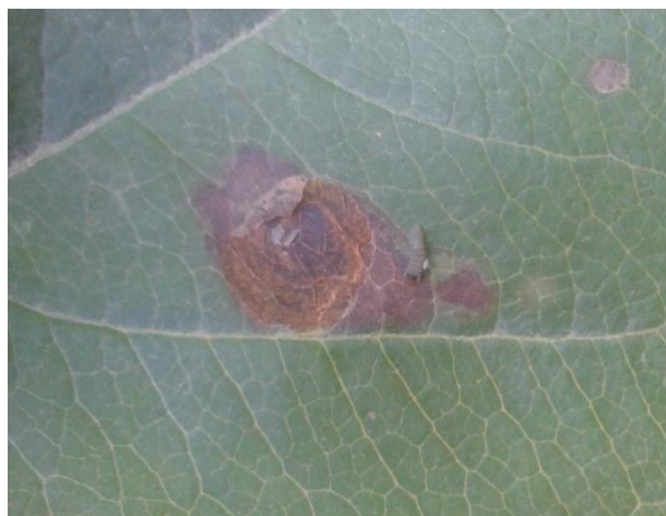
Slika 10. Živa gusjenica (original)

17.05.2015. otvaranjem i vizualnim pregledom mina, prebrojane su mrtve gusjenice unutar mina na 1. i 2 području gdje je i provedeno tretiranje, na uzorku od 50 mina, slučajno odabranih na cijeloj parceli.