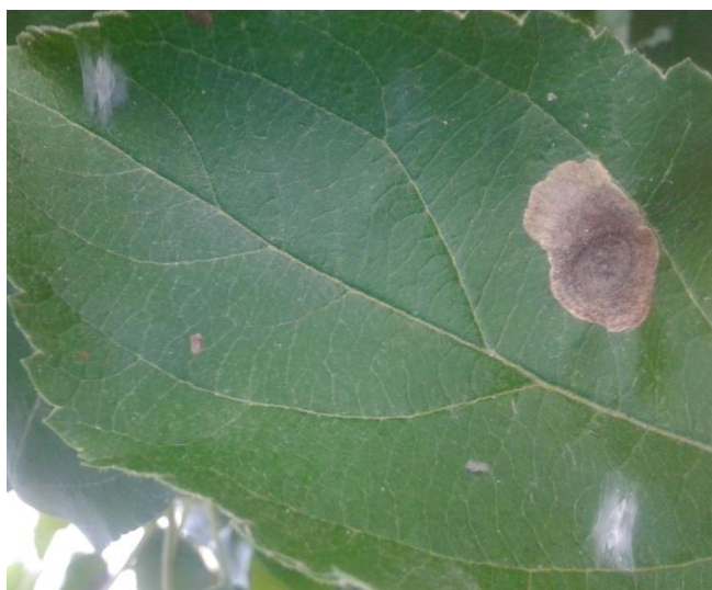
Slika 6. Kokoni ljetne generacije na lišću (original)

Pri izlasku iz mina, gusjenice se spuštaju sa grana po svilenim nitima, a kada nađu mjesto za kukuljenje, umotavaju se u zapredak- kokon. Gusjenice prve generacije, uglavnom se kukulje na listovima (Slika 6.), a gusjenice kasnijih generacija kukulje se na plodovima i mjestima na stablu, najčešće u grupama. Kukuljice su žućkaste do svijetlo smeđe, dužine oko 3 mm, umotane u bijele kokone. (CABI, 2016)