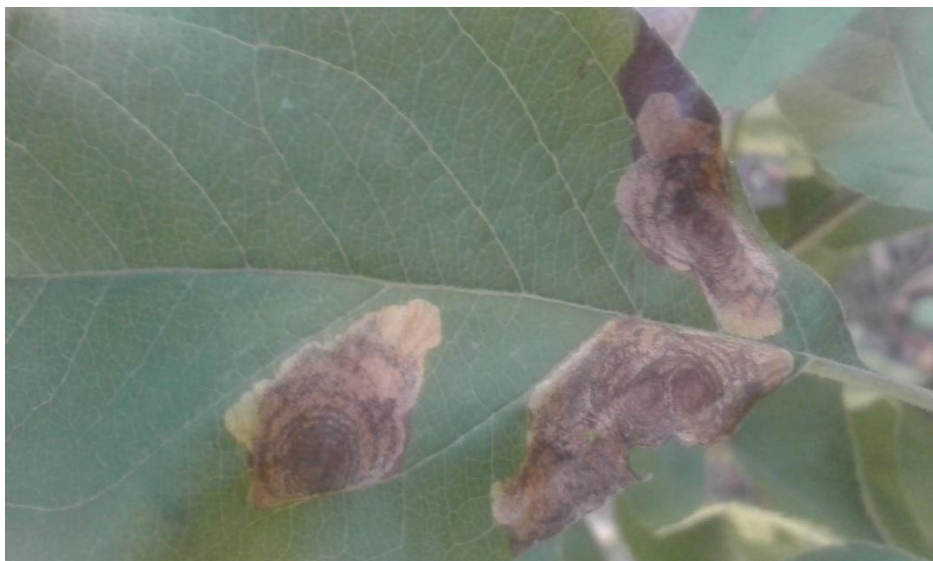
Slika 6. Prilagođeni oblik mine (original)

Pri izlasku iz mina, gusjenice se spuštaju sa grana po svilenim nitima, a kada nađu mjesto za kukuljenje, umotavaju se u zapredak- kokon. Gusjenice prve generacije, uglavnom se kukulje na listovima (Slika 6.), a gusjenice kasnijih generacija kukulje se na plodovima i mjestima na stablu, najčešće u grupama. Kukuljice su žućkaste do svijetlo smeđe, dužine oko 3 mm, umotane u bijele kokone. (CABI, 2016)