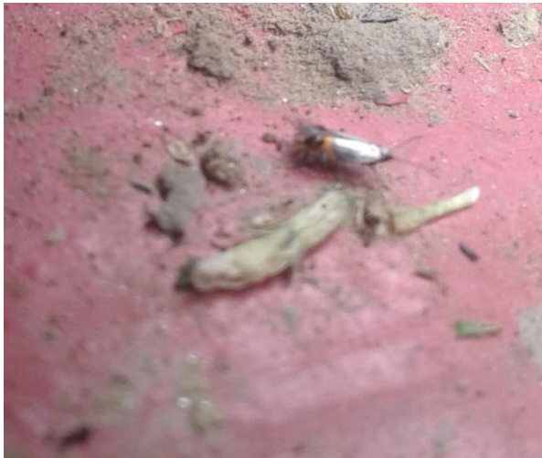
Slika 1. Odrasli oblik vrste L. malifoliella (original)