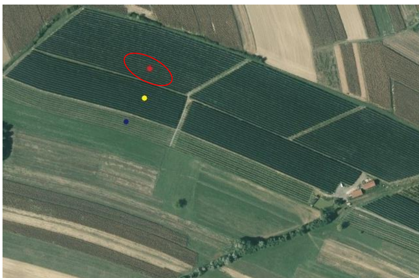
Slika 8. Satelitski snimak voćnjaka (ARKOD preglednik) Crvena elipsa- žarište zaraze tokom vegetacije 2014. godine Crvena točka- područje 1 Žuta točka- područje 2 Plava točka- područje 3

Na sva tri područja prije kretanja vegetacije (01.03.2015.), vizualnim pregledom provedeno je prebrojavanje kukuljica na stablu i to na 50 stabala odabranih slučajnim odabirom na području gdje je primijećena jača pojava prethodne godine, na cijeloj visini stabla. Nakon prebrojavanja, podaci su upisani u tablice, te su izračunati prosjeci prisutnosti kukuljica po stablu.