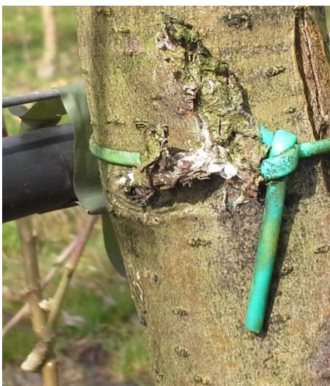
Slika 3. Grupa kokona na mehaničkom oštećenju (original)

Miner okruglih mina prezimljava kao kukuljica u bijelom kokonu, smještena na stablu i na skrovitim mjestima u voćnjaku (Slika 3. i 4.), a rjeđe na otpalom lišću ili u tlu. Također, mogu se naći i kokoni na plodovima, najčešće u čaški ploda ili pri dnu peteljke. Obično se kod nas pojava leptira prve generacije poklapa sa fenofazom cvatnje jabuke i zametanja ploda, kada se prosječna temperatura zraka podigne na oko 12°C. Kod nas je to obično sredinom ili krajem 4. mjeseca.