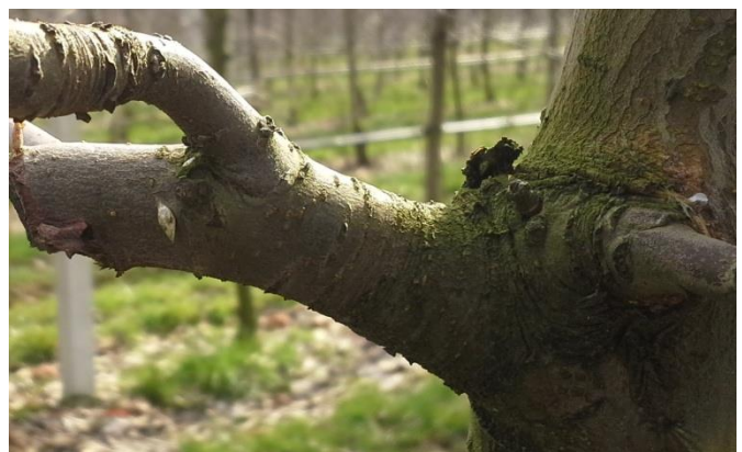
Slika 4. Pojedinačan kokon na stablu (original)

Nakon izlaska leptira prve generacije, potrebno je 50-60 sati za početak kopulacije i odlaganje jaja (Ivanov, 1976.), za razliku od ostalih generacija kada kopulacija počinje odmah po