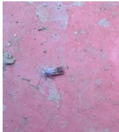
Slika 2. Odrasli oblik vrste L. malifoliella (original)

Miner okruglih mina prezimljava kao kukuljica u bijelom kokonu, smještena na stablu i na skrovitim mjestima u voćnjaku (Slika 3. i 4.), a rjeđe na otpalom lišću ili u tlu. Također, mogu se naći i kokoni na plodovima, najčešće u čaški ploda ili pri dnu peteljke. Obično se kod nas pojava leptira prve generacije poklapa sa fenofazom cvatnje jabuke i zametanja ploda, kada se prosječna temperatura zraka podigne na oko 12°C. Kod nas je to obično sredinom ili krajem 4. mjeseca.