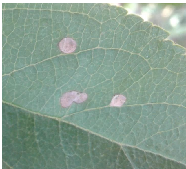
Slika 5. Izgled mine u ranom stadiju gusjenice (original)

izlasku iz kukuljica. Kopulacija se odvija na lišću i pupovima i traje 15-45 min (Davis i sur., 2009.) Također, kod lisnog минера okruglih mina je prisutna je poliandrija. Ženke na naličju lišća odlažu pojedinačna jaja. Ženke prezimjele generacije odlažu u prosjeku 25-30 jaja (Ivanov, 1976), dok ženke ostalih generacija mogu odložiti i do 70 jaja (Šoškić, 2011). Jaja su promjera do 0,3 mm, razvoj jaja ovisi o temperaturi, što je za razvoj gusjenica u našim uvjetima potrebno 8-12 dana (Maceljki, 2002). Iz odloženog jaja razvijena se gusjenica odmah ubuši u list, progrizajući epidermu lista i hraneći se parenhimom lista i stvara okruglastu minu isprva jedva vidljivu s lica lista (Slika 5.).