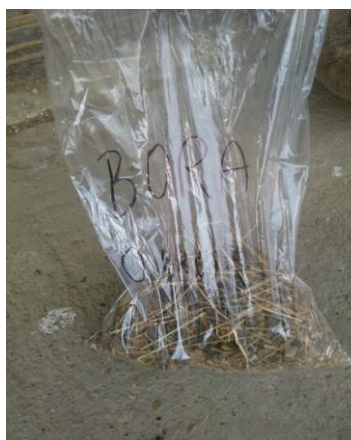
Slika 3. Uzorak dnevnog odbitka junice u razdoblju uzorkovanja

Pokus je proveden prema cross-over dizajnu u dva perioda. Pokusno razdoblje počelo je nakon dvotjednog razdoblja prilagodbe na novi ambijent i hranidbu. Svaki eksperimentalni period imao je 18 dana pri čemu je 15 dana bila prilagodba na obrok i tri dana uzorkovanja. Za vrijeme razdoblja uzorkovanja, uzimao se uzorak obroka, odbitaka (slika 3) i fecesa. Do dostave u laboratorij i provedbe analize, svi uzorci su čuvani na +4 °C (slika 4).