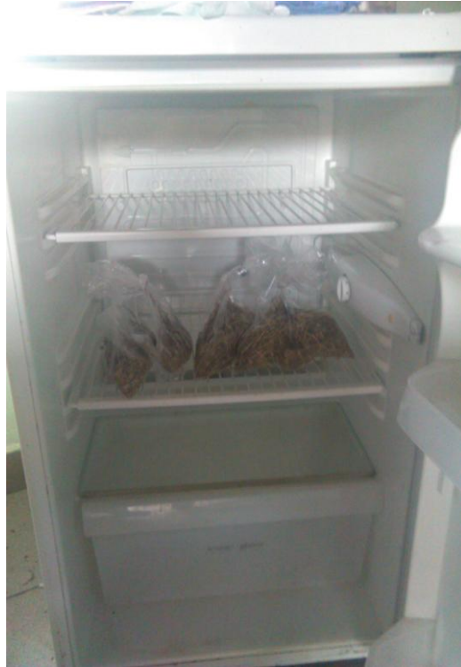
Slika 4. Uzorci u hladnjaku tijekom provođenja pokusa