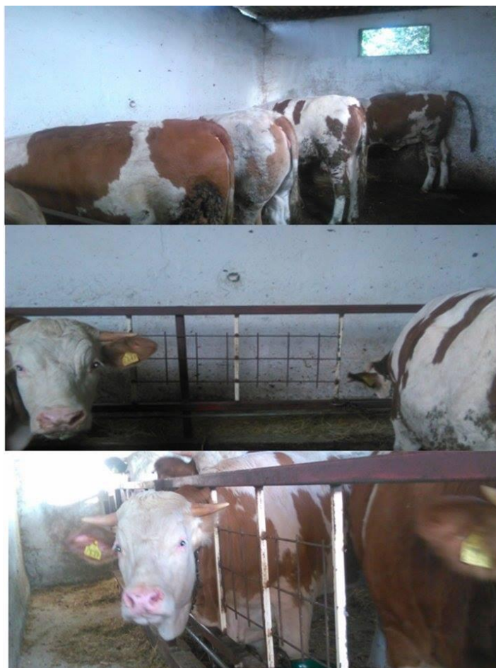
Slika 1. Junice u vezanom načinu držanja tijekom pokusa

Pokus je proveden na četiri tovne junice, pasmine Simmental. Životinje su othranjene na istom OPG-u na kojem se provodilo istraživanje. Prije početka pokusa životinje su bile smještene u drugom objektu, na rešetkastom podu u slobodnom načinu držanja. Životinje nisu imale mogućnost ispusta. Dva tjedna prije samog početka pokusa, junice su bile premještene u zasebni objekt, gdje su bile smještene tijekom cijelog pokusa, a kako bi se naviknule na novi prostor i uvjete držanja, iz slobodnog načina držanja na vezani način držanja, gdje su životinje fiksirane za rub valova u jednom redu (slika 1). Dugo ležište od armiranog betona je bilo čišćeno svaki dan, ujutro i navečer. Životinje su držane na vezu radi lakše kontrole i hranidbe. Između svake junice na valovu bila je željezna pregrada, širine 120 cm, kako bi svaka junica imala pristup samo obroku namijenjenom njoj. Napajanje je bilo iz pojilica, u kojima je voda dostupna 24 sata na dan. Junce su bile prosječne starosti 12,5 mjeseci i 380 kg težine na početku pokusa.