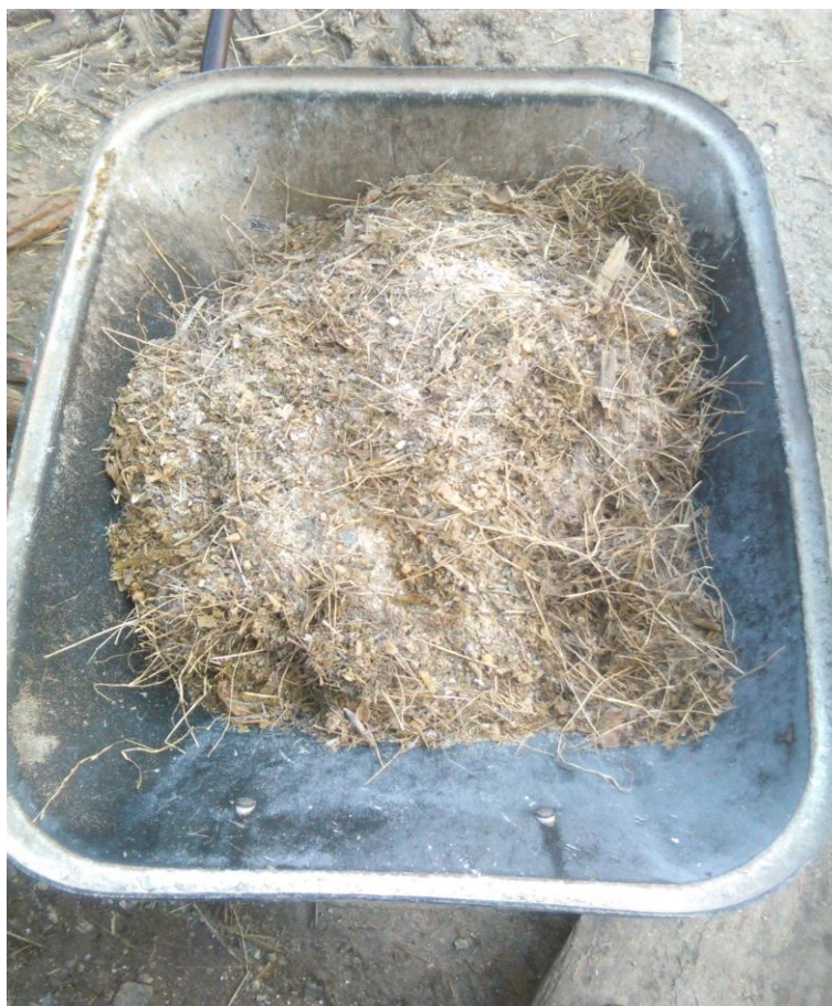
Slika 2. Potpuno izmiješan obrok kojim su hranjene junice tijekom istraživanja utjecaja izvora sporootpuštajuće ureje na probavljivost

Junice su hranjene jednom dnevno u 17 sati, u ad libitum režimu hranidbe i slobodnom pristupu vodi. Sa svakim obrokom dodano je 10 % više TMR-a zbog odbitaka.