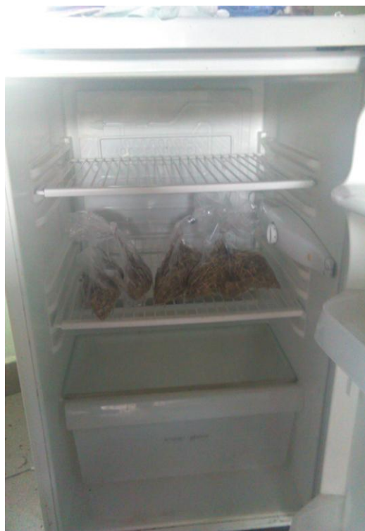
Slika 4. Uzorci u hladnjaku tijekom provođenja pokusa