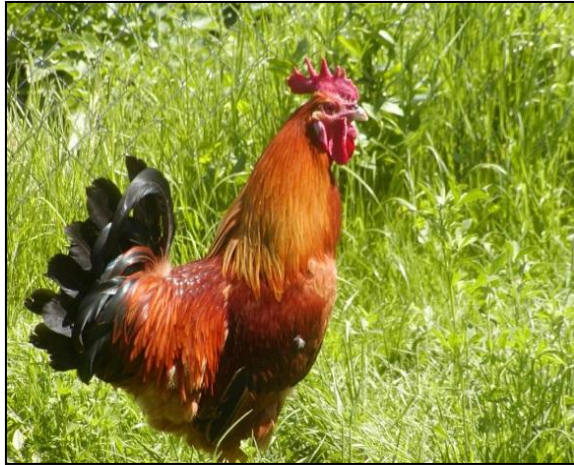
Slika 4. Jarebičasto-zlatni soj