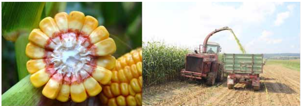
Slika 3. Siliranje kukuruza u sušnim godinama treba započeti najkasnije do stadija 50 % mliječne crte.

Svima je poznato da u proizvodnji silažne mase tehnološka zrelost kukuruza nastupa nešto ranije nego što se potpuno izgradi prinos zrna i postigne najveća masa suhe tvari biljaka. Vlažnost silirane mase u normalnim vegetacijskim sezonama je usko povezana s vlažnosti zrna tako da vlažnosti silažne mase od oko 65-70% odgovara vlažnost nezrelog zrna od oko 35-40% . Prema tome, skidanje cijelih biljaka za proizvodnju silaže obavlja se kad zrno ima navedenu vlažnost, a to se najčešće određuje prema položaju mliječne crte na zrnu (slika 3).