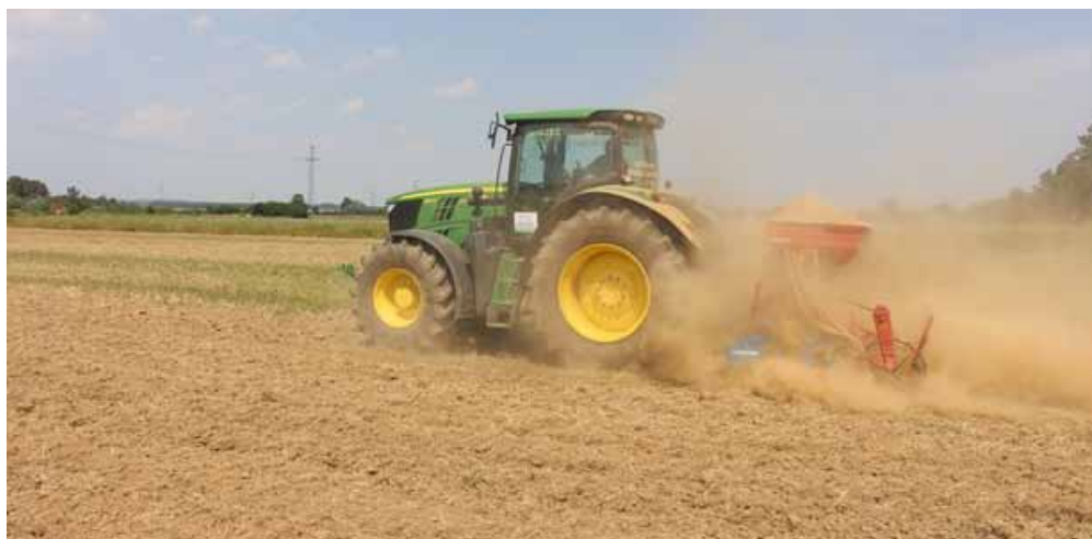
Slika 2. Sjetva postrnih kultura u jako sušno tlo. Figure 2 Sowing of second-crop in a very dry soil.

Nedostatak oborina u poljskim uvjetima najčešće nije tijekom cijele vegetacije već za vrijeme pojedinih razdoblja poljoprivrednih sezona. Stoga je korisno poznavati tzv. kritični period za vodu pojedine kulture koji podrazumijeva razdoblje u kojem je ona najosjetljivija na sušu. Taj se period uglavnom poklapa s vremenom najbržeg rasta kulture odnosno razdobljem u kojem se odvija najveće nakupljanje suhe tvari po jedinici površine. U usjevu kukuruza kritični period za vodu nastupa desetak dana prije metličanja i traje tri do četiri tjedna odnosno od polovice lipnja do polovice srpnja. Suša koja nastupi za vrijeme kritičnog perioda za vodu može jako smanjiti prirod odnosno prinos uzgajane kulture, a u ekstremnim slučajevima mogu nastati i potpune štete.