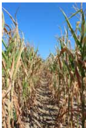
Slika 1. Simptomi jakog nedostatka vode u usjevu kukuruza. Figure 1 Symptoms of severe water stress in corn crop