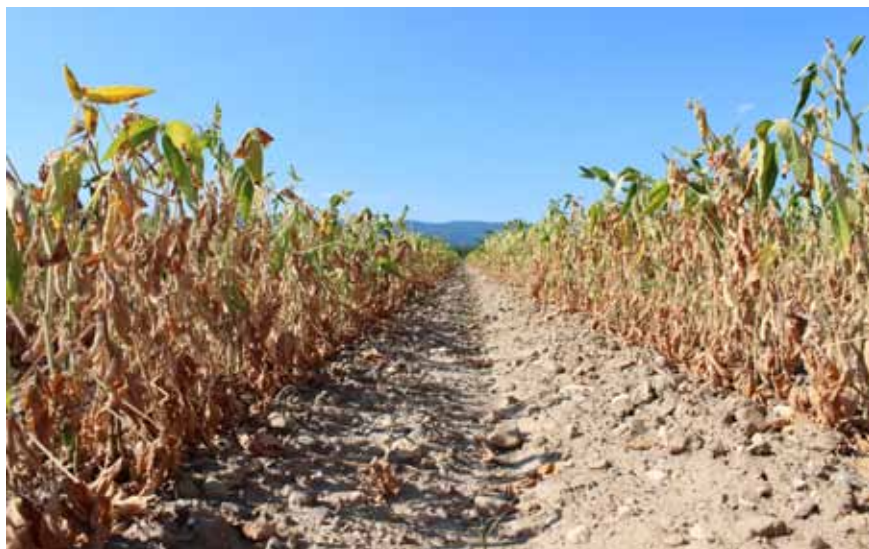
Slika 4. Simptomi jakog nedostatka vode u usjevu soje.

Mjere borbe protiv suše ovise o učestalosti njezine pojave i štetama koje nastupaju. Najbolji način borbe protiv ljetne suše je svakako navodnjavanje koje bi naročito trebalo koristiti pri uzgoju najisplativijih ratarskih kultura poput duhana, šećerne repe i krumpira, te u proizvodnji postrnih kultura. Međutim, ova agrotehnička mjera nije dostupna na većini poljoprivrednih gospodarstava pa se borba protiv suše uglavnom svodi na „preventivne“ agrotehničke mjere u obradi tla. Dubokim jesenskim oranjem zadržava se i čuva veliki dio jesensko-zimskih i rano proljetnih oborina, pa prije sjetve jarih kultura zalihe vode u tlu do jednog metra dubine mogu u tlima dobre teksture iznositi i 150-200 litara vode po četvornom metru. Pri uzgoju kasnih jarina poput kukuruza i soje treba u rano proljeće obavezno obaviti zatvaranje jesenske brazde jer ta plitka obrada smanjuje isparavanje vode iz obrađenog tla. Nadalje, međurednom kultivacijom tijekom vegetacije širokorednih usjeva također možemo utjecati na smanjenje gubitaka vode iz tla čime se štedi voda za rast i razvoj usjeva.