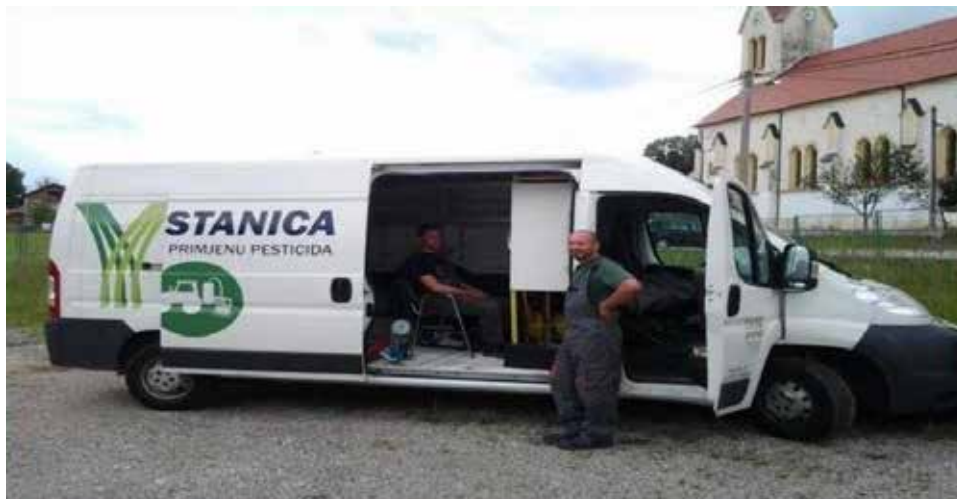
Slika 1. Ovlaštena ispitna stanica za pregled uređaja za primjenu pesticida Figure 1. Authorized test station for inspection of pesticide application devices

Prilikom mjerenja korišteno je mobilno vozilo opremljeno svom potrebnom opremom za pregled strojeva uz prisutnost radnika odgovarajuće izobrazbe (Slika 1.).