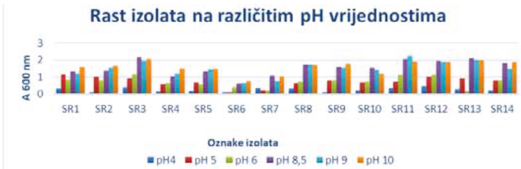
Graf 1. Rezultati spektrofotometrijskog određivanja rasta izolata na različitim pH vrijednostima Graph 1. Results of spectrophotometric determination of isolate growth at different pH values

Optimalna pH vrijednost na kojoj rastu rizobije je 6,8. U cilju procjene rasta i na drugim pH vrijednostima u ovom istraživanju provedeno je ispitivanje sposobnost rasta izolata na šest različitih pH vrijednosti (4, 5, 6, 8,5, 9 i 10). U provedenom istraživanju utvrđena je znatna varijacija u rastu između pojedinih izolata. Najslabiji rast utvrđen je kod pH vrijednosti 4 na kojoj su izolati najslabije rasli. Kao najbolji izolati pokazali su se izolati SR15 i SR16 s područja Koprivničko-križevačke županije (Gola). Pri pH vrijednosti 5 i 6 svi izolati su pokazali dobar rast. Pri pH vrijednosti 8,5, 9 i 10 svi izolati pokazali su jako dobar rast što ukazuje da sojevi toleriraju izrazito alkalnu pH vrijednost sredine. Detaljan pregled rasta svih izolata na različitim pH vrijednostima prikazan je na grafu 1.