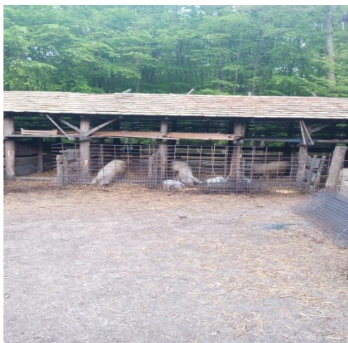
Slika 9. Svinje smještene u odvojene boksove

Krmače vole više vremena provoditi na otvorenom, pa im je zato i veći apetit vani, nego u zatvorenom prostoru. Krmačama u vrijeme laktacije osim voluminoznog krmiva poput silaže kukuruza, krumpira, stočne repe potreban je i koncentrat. Prasad treba dodatnu prihranu već nakon prvog tjedna života. Voda za piće treba im biti stalno dostupna i svježa. Osim što jedu biljke, rovanjem po tlu u organizam unose i crve, parazite i gliste. Na otvorenom se drže samo rasplodne životinje, dok one za tov se drže zatvorene u tovilištima (Senčić i Antunović, 2003).