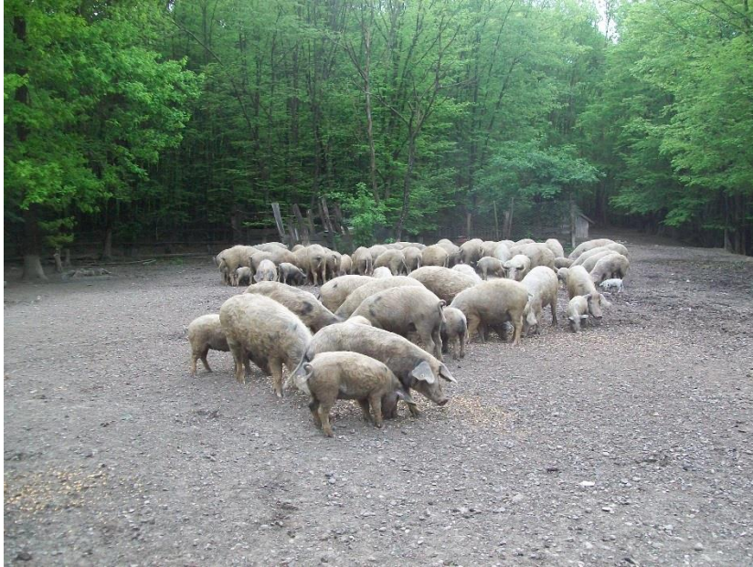
Slika 1. Turopoljska svinja na otvorenom u šumi Lukavečki Čret