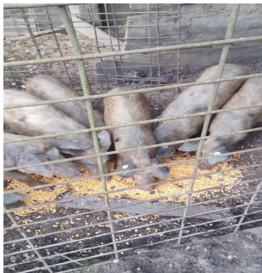
Slika 10. Hranidba turopoljske svinje kukuruzom (Foto: Ivšac, 2016.)

Krmače vole više vremena provoditi na otvorenom, pa im je zato i veći apetit vani, nego u zatvorenom prostoru. Krmačama u vrijeme laktacije osim voluminoznog krmiva poput silaže kukuruza, krumpira, stočne repe potreban je i koncentrat. Prasad treba dodatnu prihranu već nakon prvog tjedna života. Voda za piće treba im biti stalno dostupna i svježa. Osim što jedu biljke, rovanjem po tlu u organizam unose i crve, parazite i gliste. Na otvorenom se drže samo rasplodne životinje, dok one za tov se drže zatvorene u tovilištima (Senčić i Antunović, 2003).