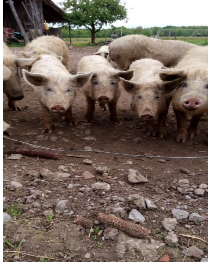
Slika 8. Turopoljska svinja