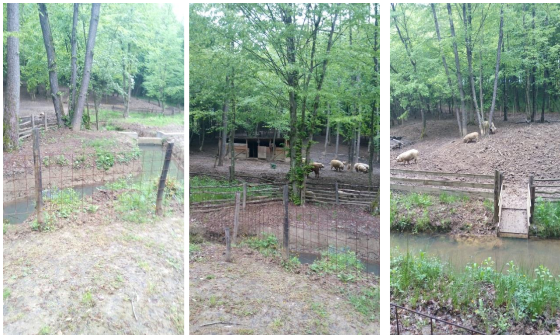
Slika 4. Turopoljska svinja na otvorenom na OPG Pavičić u Klobučaku

Dobrobit se može procijeniti pomoću proizvodnih pokazatelja kao što su to količina i kvaliteta proizvoda, zatim zdravstvenim pokazateljima (ozljede, obolijevanje dišnog sustava zbog loših mikroklimatskih uvjeta te oboljenje probavnog trakta uslijed loše hranidbe). Nadalje, kao pokazatelji dobrobiti mogu se koristiti pokazatelji imunološkog, metaboličkog, endokrinog i reproduktivnog sustava. Važnost tih čimbenika dobrobiti uvelike se odnosi i na pokazatelje u promjenama ponašanja koje se događaju ako životinje dožive stres, bol, strah ili neke vrste nelagode (Deen, 2010).