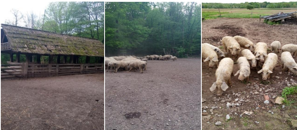
Slika 5. Nadstrešnice za svinje u gateru Lukavec i svinje na otvorenom

Prema Direktivi Europske komisije (Council Directive 98/58/EC) svaka obveza glede dobrobiti životinja mora uključivati poboljšanje standarda u sljedećim područjima: osoblje, inspekcije, vođenje evidencije, sloboda kretanja, objekti i smještaj, životinje koje se drže izvan objekta, automatska ili mehanička oprema, hrana, voda i ostale tvari, sakaćenja, postupci uzgoja.