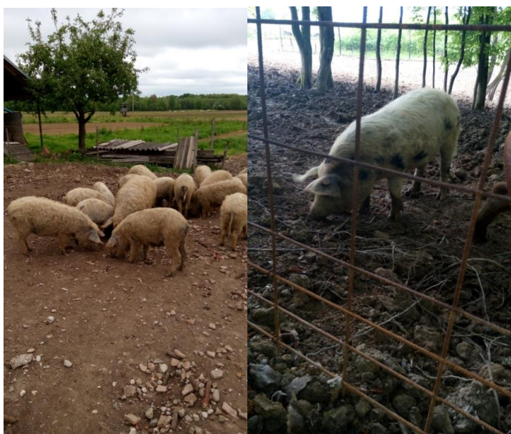
Slika 7. Rovanje svinja (Foto: Ivšac, 2016.)

Od parazitskih bolesti koje stalno ugrožavaju zdravlje svinja najpoznatiji su paraziti želuca ( Trichostrongylus axei ), crijeva ( Ascaus suum , Trichinella spiralis ), pluća ( Echinoccus granulosus ), jetra ( Fasciola hepatica ) te muskulature ( Trichinella spiralis ). Jedna od bolesti koja je se često javlja kod uzgajivača je trihineloza izazvana parazitom Trichinella spiralis . Glavni gubitci koje uzrokuju paraziti su gubitak u prirastu, osjetljivost na razvoj drugih bolesti te napad bakterija (Salajpal i sur., 2013). Kako bi se parazitske bolesti stavile pod kontrolu moraju se često provoditi pretrage balege te tretiranja protiv parazita. Iz istraživanja koja su provedena na svinjama koje obitavaju na otvorenom pokazalo se da one imaju puno manje problema sa bolestima, odnosno njihovo zdravstveno stanje je bolje u odnosu na svinje držane u zatvorenim objektima (Fregonesi i Leaver, 2001).