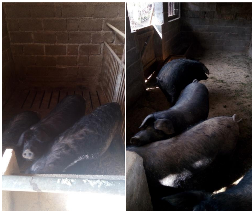
Slika 2. Crna slavonska svinja u boksu na OPG Džakula

Većinom se hrani pšenicom, kukuruzom, tritikalom te zobi. Kaljužanje i kupanje im služi da se rashlade i očiste od nametnika. Crna slavonska svinja pripada srednje velikim pasminama. Krmače crne slavonske svinje prase u prosjeku šest do osam prasadi koja su po odbiću mase od približno deset kilograma. Odbiće prasadi je uglavnom nakon navršena dva mjeseca života. Meso ima visok postotak intramuskularne masti (6-8 %). Za kulene i kobasice kolje se s 18 do 24 mjeseca starosti u težini od 130 do 230 kg (Đikić i sur., 2010).