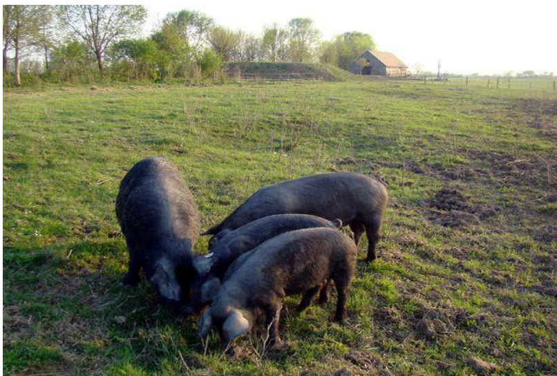
Slika 3. Crna slavonska svinja na otvorenom