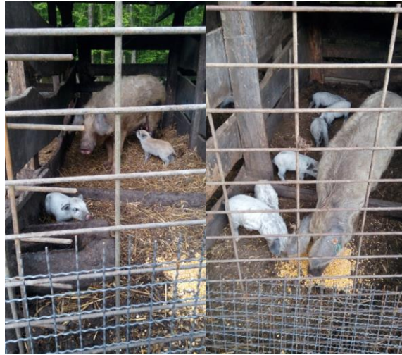
Slika 11. Krmača sa prasadi

otvorenom moguće je organizirati u ograđenim prostorima gdje se nalaze nastambe polukružnih oblika. U unutrašnjosti nastambe je postavljena stelja te hranilice koje se nalaze u stražnjem dijelu. Pri ovakvom načinu uzgoja treba uzeti u obzir odgovarajuće veličine prostora po prasetu (Senčić i Antunović, 2003).