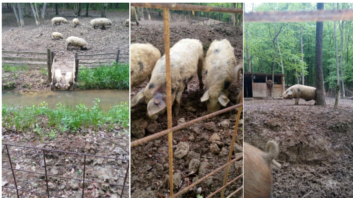
Slika 6. Prirodno ponašanje svinja na otvorenom