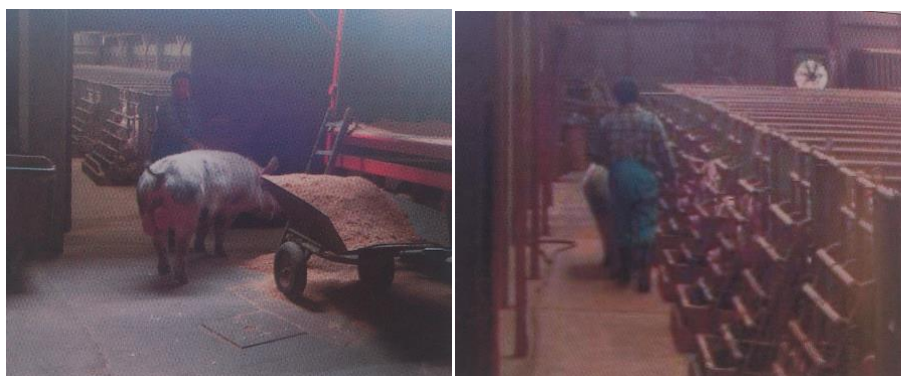
Slika 1. Prolazak nerasta „probača“ u pripustilište

Značajan broj nazimica (posebno u zatvorenom držanju) pokazuju tzv. „tihu“ tjeranje, bez vidljivih simptoma, te im je potrebno stimuliranje da bi pokazale znakove tjeranja i normalno se uključile u rasplod (Senčić i sur., 1990). Jedan od najčešćih načina koji se koriste za otkrivanje krmača s „tihim“ tjeranjem je upotreba tzv. nerasta „probača“. Ovaj način se provodi tako što se nerasti jednom, dva ili tri puta dnevno protjeruju kraj boksa te tako plotkinje, koje su u estrusu, reagiraju specifičnim ponašanjem. Plotkinje postaju nemirne, strižu ušima, podižu rep, približavaju se nerastu, glasaju se i dozvoljavaju zaskakivanje drugih plotkinja.