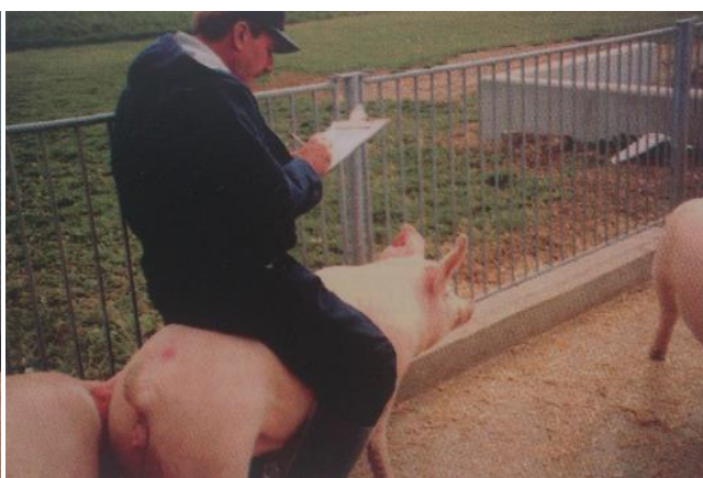
Slika 3. Test jahanja