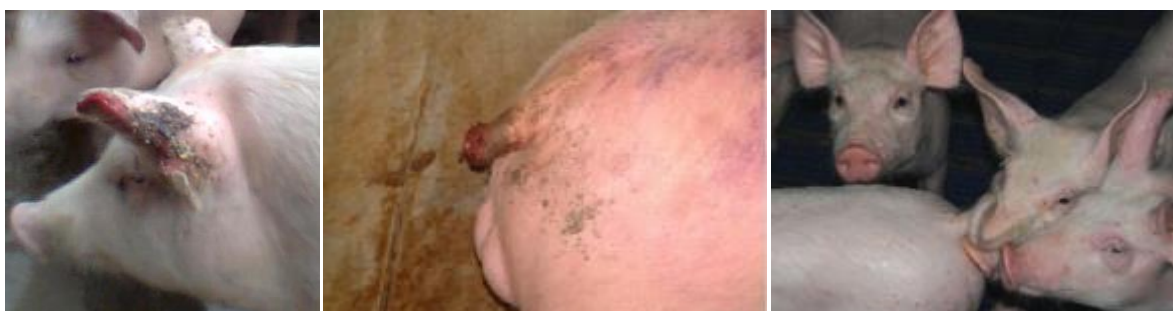
Slika 5. Griža uški i repova kod svinja