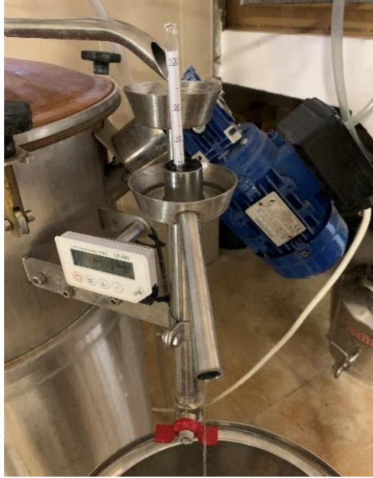
Slika 6 Mjerenje alkoholne jakosti destilata na izlazu iz destilacijskog uređaja