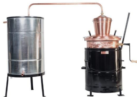
Slika 1 Jednostavni destilacijski uređaj

zatvaraju. Zagrijavanje kotla provodi se lagano kako ne bi došlo do zagorijevanja sirovine ili prevelikog pjenjenja. Nakon što se sirovina u kotlu zagrije do točke vrelišta otvara se ventil za dotok hladne vode u kondenzator. Cijeli proces destilacije provodi se oprezno jer je izuzetno važno kontrolirati ravnomjerno i polagano istjecanje destilata iz uređaja. Dinamika istjecanja destilata kontrolira se podešavanjem jačine zagrijavanja kotla i protoka vode kroz kondenzator. Po završenoj destilaciji prekida se grijanje kotla, skidaju se cijev za odvod para i kapa, a bezalkoholni ostatak se prazni iz kotla (Spaho, 2017.).