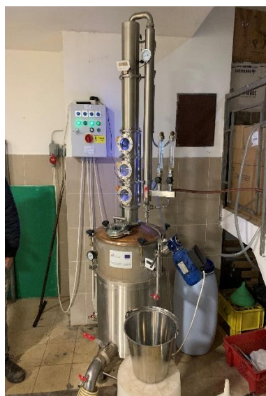
Slika 2 Složeni destilacijski uređaj

Deflegmatori su smješteni na vrhu ili iznad kolone, izrađeni su od bakra i mogu biti različitih konstrukcija. Cjevasti deflegmatori sastavljeni su od uzdužnih cijevi kroz koje prolaze pare, dok se između cijevi provodi rashladno sredstvo. Rashladno sredstvo u deflegmatoru je obično topla voda koja se dovodi iz kondenzatora. Podešavanjem temperature vode regulira se stupanj deflegmacije. Što je temperatura rashladne vode u deflegmatoru niža, veći je stupanj deflegmacije. S povećanjem stupnja deflegmacije dobiva se destilat s većom koncentracijom alkohola (Spaho, 2017.).