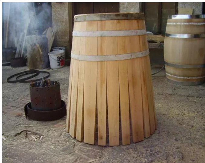
Slika 3 Sastavljanje hrastove bačve