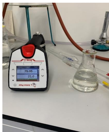
Slika 7 Denzitrometar Anton Paar Snap 41

Korištenje uređaja vrlo je jednostavno. Prvo se u uređaj pomoću posebno dizajnirane tipke usiše destilirana voda kako bi se uređaj isprao. Potom se usiše tekućina kojoj se želi izmjeriti alkoholna jakost. Tekućina se zatim ispusti iz uređaja. Cilj navedenih predradnji je smanjenje mogućnosti zaostatka bilo kakvih onečišćenja u uređaju koja bi mogla utjecati na pouzdanost dobivenih rezultata. Nakon pripremnih radnji u uređaj se ponovo usisava tekućina kojoj se želi odrediti alkoholna jakost. Jednostavnim pritiskom na tipku „start“ započinje se mjerenje vrijednosti te se za nekoliko trenutaka na digitalnom ekranu uređaja pojavljuju izmjerene vrijednosti.