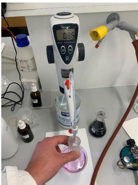
Slika 8 Titracija uzorka

Određivanje ukupne kiselosti provodi se na način da se u tikvicu od 200 mL prebaci 50 mL uzorka uz dodatak 10-20 mL destilirane vode. U tako razrijeđeni uzorak dodaje se 2 kapi reagensa fenolftaleina. Uzorak se potom titrira s 0,1 M NaOH do pojave ružičaste boje.