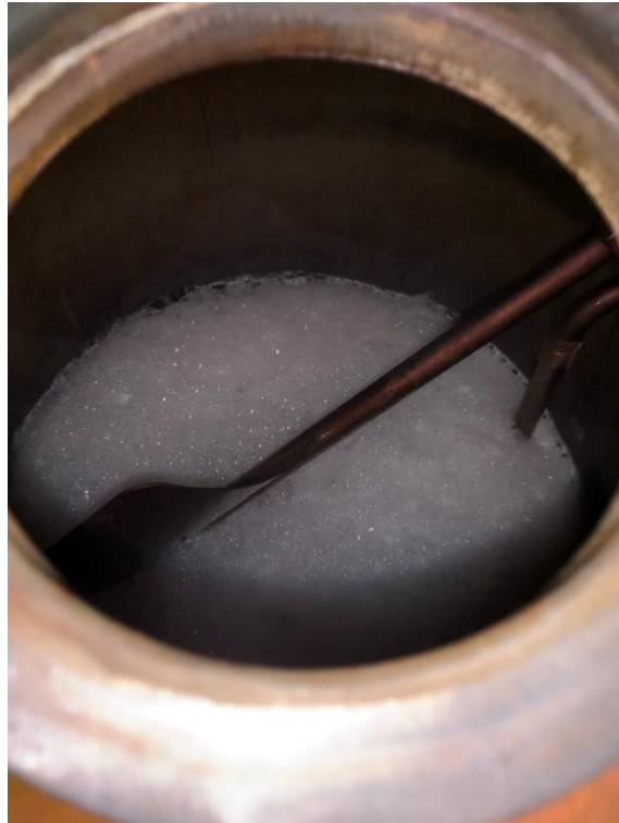
Slika 5 Pojava pjene u kotlu destilacijskog uređaja

Unatoč poduzetim radnjama u svrhu prevencije pojave intenzivnog pjenjenja, do izdizanja pjene je ipak došlo, zbog čega je bilo potrebno u dva navrata otvoriti kotao i ugasiti električne grijače kako bi se ublažilo stvaranje pjene i kako pjena ne bi ušla u destilacijsku kolonu. Izgledno je da je iz tog razloga došlo do određenih gubitaka alkoholnih para, a samim time i gubitka ukupne količine destilata.