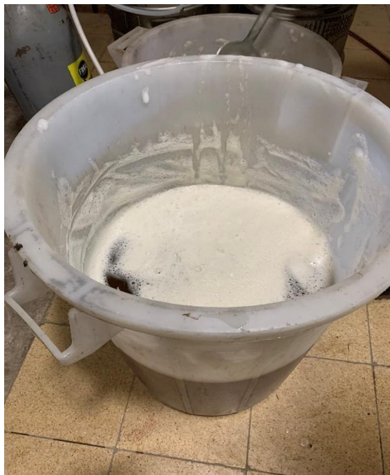
Slika 4 Bazno pivo, izvor fotografije: autor

Pivo je destilirano na Vinogradarsko-vinarskom pokušalištu Jazbina, Agronomskog fakulteta u Zagrebu. Za destilaciju baznog piva korišten je složeni destilacijski uređaj s kolonom i deflegmatorom maksimalne zapremnine kotla 80L. S obzirom na visok udio proteina u pivu i prisutnost ugljikovog dioksida, očekivalo se određeno pjenjenje u kotlu prilikom zagrijavanja. Iz navedenog razloga se destiliralo 40L baznog piva kako bi se ostavilo dovoljno prostora za izdizanje pjene i izbjeglo dizanje pjene u kolonu destilacijskog uređaja.