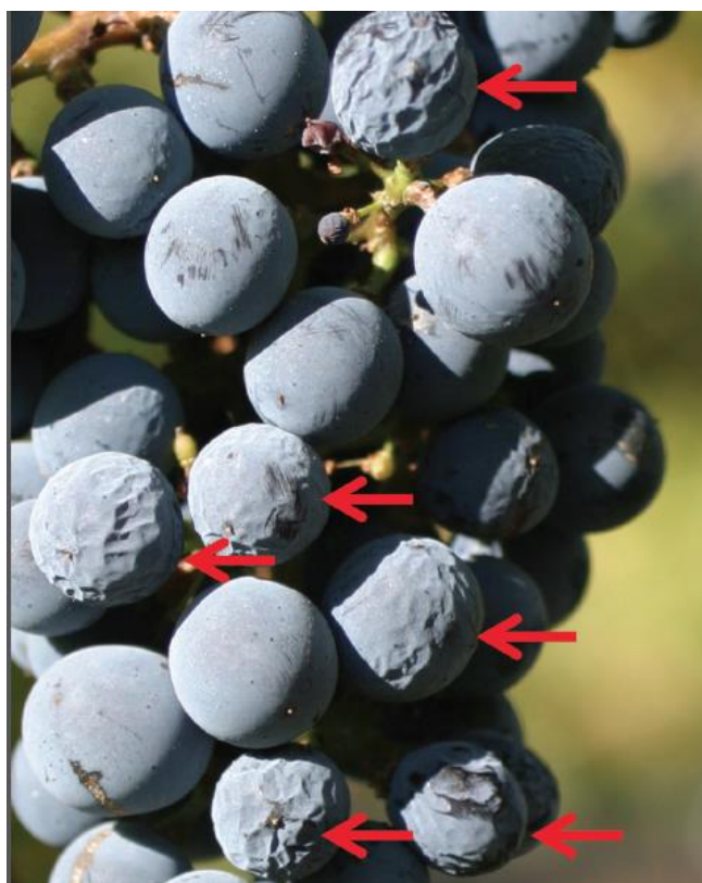
Slika 6. Početna faza sušenja bobice vinove loze

- Veličina bobica: Nedostatak vode često dovodi do smanjenja veličine bobica. Manje bobice obično imaju koncentriraniji okus i veći omjer kože prema mesu, što može utjecati na povećanje koncentracije spojeva iz kože poput boje i tanina (Ojeda i sur., 2002).