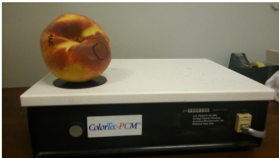
Slika 6. Mjerenje boje kožice ploda