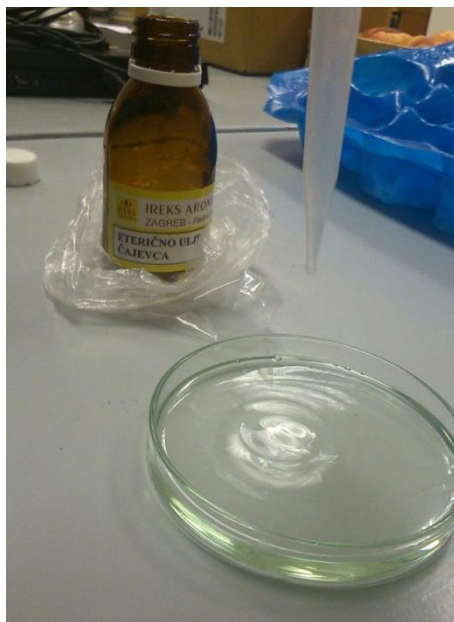
Slika 1. Eterično ulje čajevca proizvođača Ireks aroma