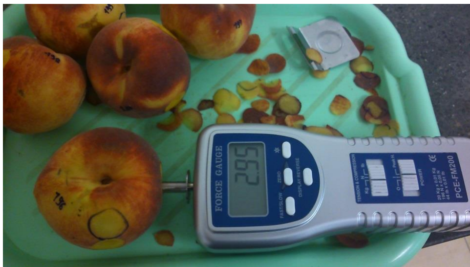
Slika 5. Mjerenje tvrdoće ploda