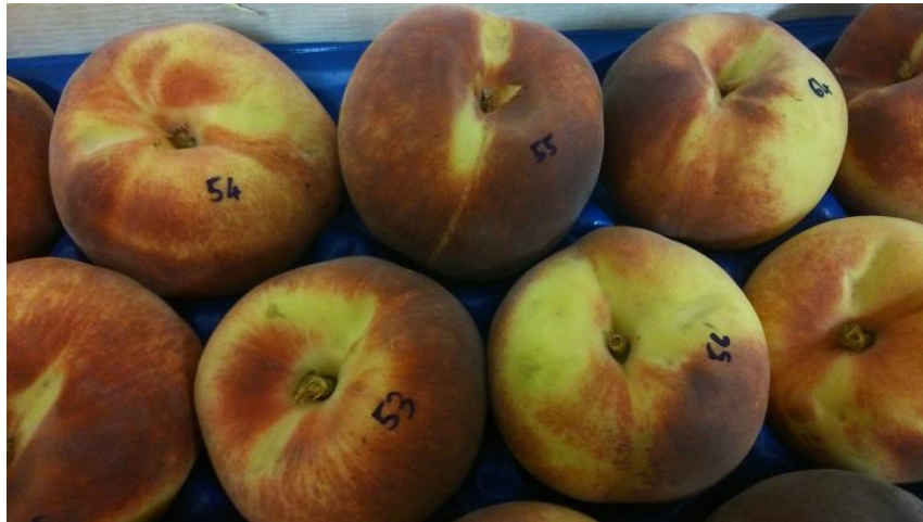
Slika 2. i 3. Breskve prije tretmana esencijalnim uljem čajevca