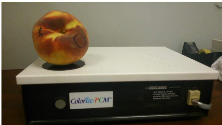
Slika 6. Mjerenje boje kožice ploda