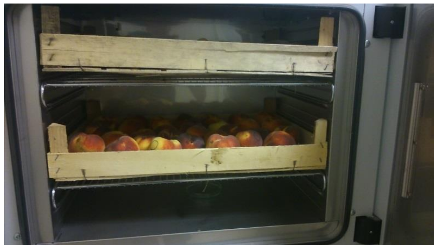
Slika 4. Breskve u komori za tretman