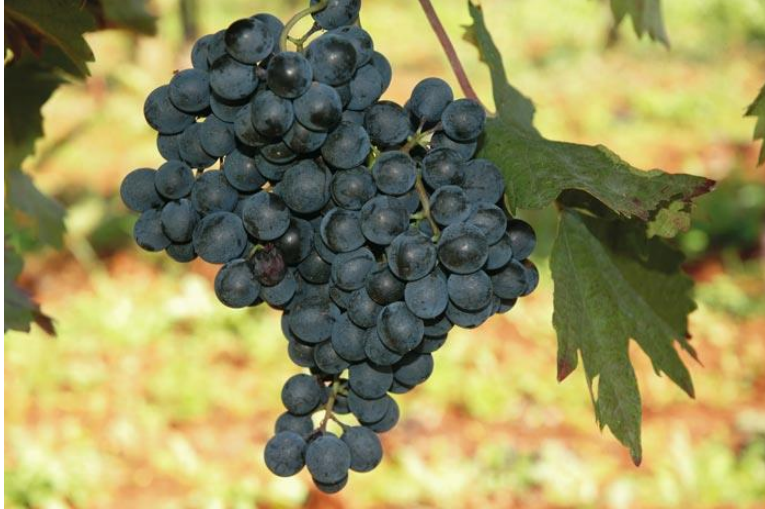
Slika 7. Teran