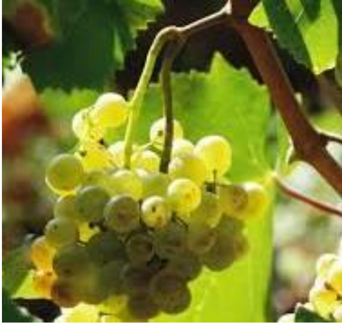
Slika 4. Malvazija Istarska