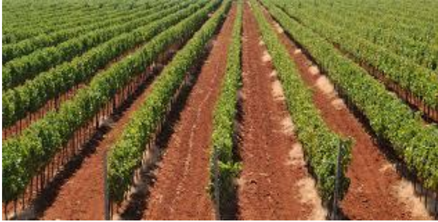
Slika 2. Istarski vinograd na crvenici