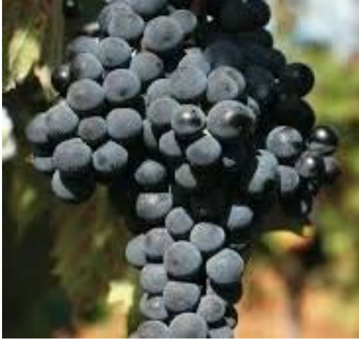
Slika 5. Merlot