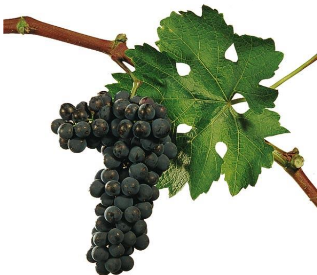
Slika 6. Cabernet Sauvignon