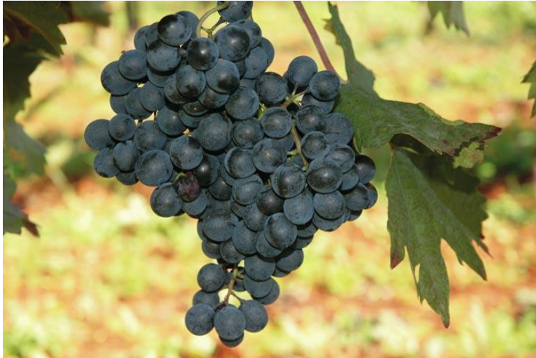
Slika 7. Teran