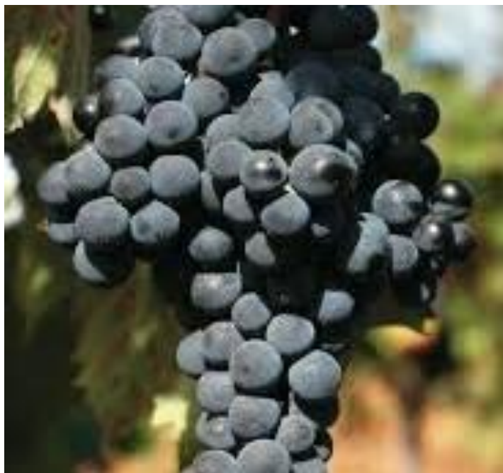
Slika 5. Merlot