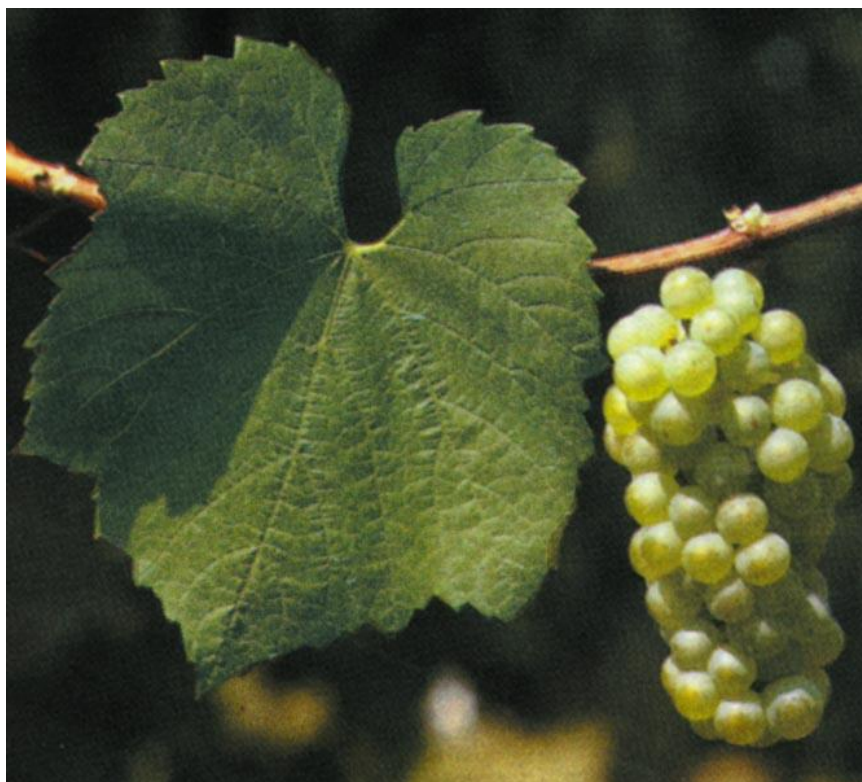
Slika 8. Chardonnay