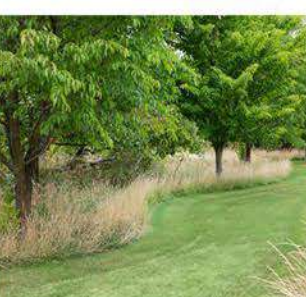
ZP 7 Sl. 7g i sl. 7h