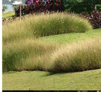
ZP 4 Sl. 7d