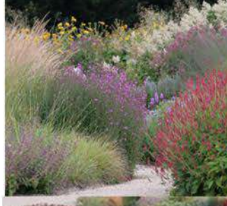
ZP 5 Sl. 7e