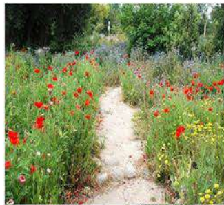
ZP 1 Sl. 7a