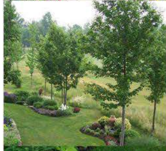
ZP 2 Sl. 7b