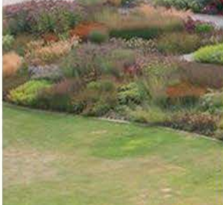
ZP 6 Sl. 7f