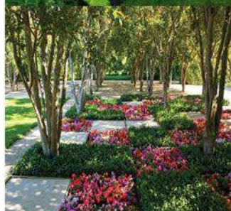
ZP 3 Sl. 7c