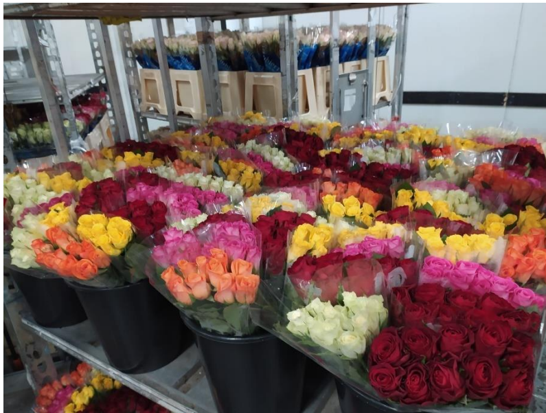
Slika 2.3. Različiti kultivari ruža pristiglih iz Kenije

Članak objavljen 15. veljače 2024. na službenim web stranicama Royal Flora Holland-a, govori da je dva tjedna prije Valentinova prodano 166 milijuna ruža, 15 milijuna više nego prethodne godine (na njihovoj tržnici). Time je ruža postala najprodavanija vrsta. Posebno su bile tražene crvene ruže. Broj premium ruža iz Nizozemske veći je za 2.8 milijuna nego 2023. godine.