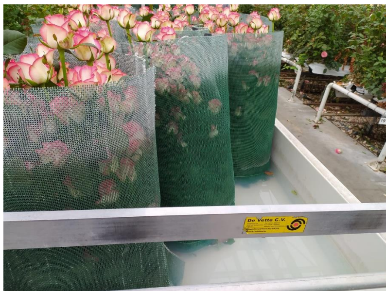
Slika 2.7. Čuvanje rezanog cvijeća u rashladnoj otopini nakon berbe produžuje životni vijek u vazi

Vrhunska kvaliteta proizvoda (dulji vijek trajanja u vazi) također je rezultat napretka u cjelokupnom procesu koji uključuje smanjenje posrednika u distribucijskom lancu i ubrzavanje kupnje na učinkovit način (Xia i sur., 2006).