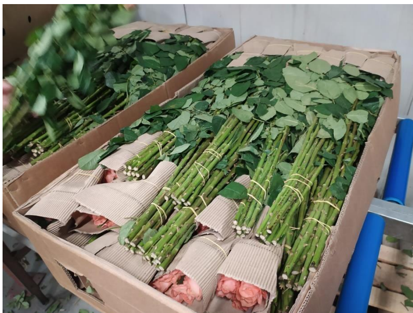
Slika 2.5. Pravilno zapakirane ruže