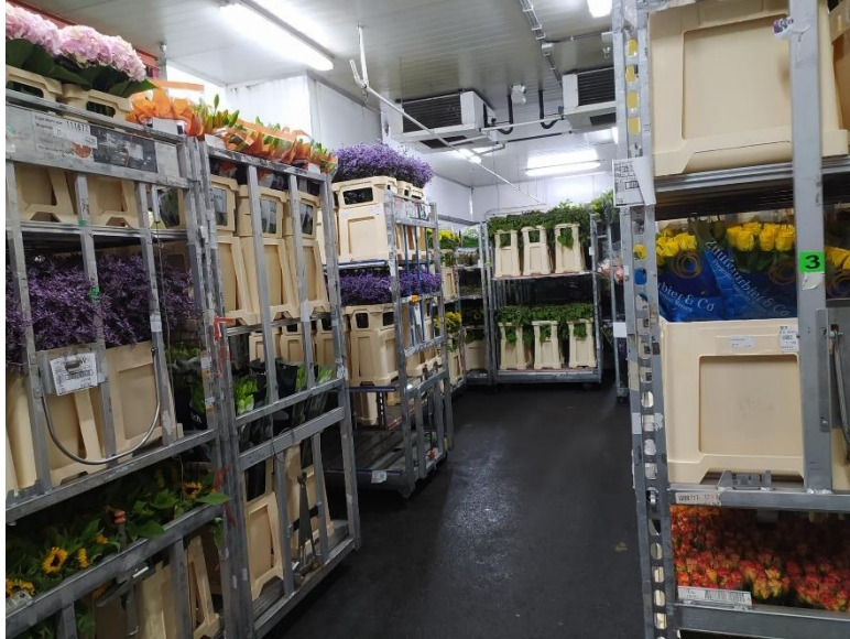
Slika 2.6. Uskladišteno rezano cvijeće u klimatiziranom prostoru

vrijeme. Karanfile, gerbere i ljiljane najbolje je tretirati ovom metodom (Thakur, 2020). Neke vrste rezanog cvijeća poput narcisa mogu se čuvati izvan vode 24 sata (suho skladištenje), kao što se prakticira u zračnom prijevozu. Većinu cvijeća, međutim, najbolje je držati u vodi ili hranjivim otopinama (da Silva, 2006).