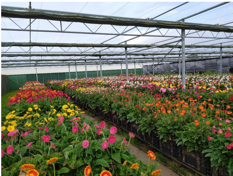
Slika 2.4. Proizvodnja gerbera u Nizozemskoj

Gerbera ( Gerbera jamesonii ) mediteranska je trajnica koja pripada porodici Asteraceae . Cvjetovi dolaze u širokom rasponu boja, uključujući žutu, bijelu, crvenu, narančastu, ružičastu i kestenjastu (Mohsin i sur., 2023). Gerbera koja se prodaje kao rezani cvijet zove se Gerbera × hybrida , koja je razvijena od interspecifičnih križanaca između G. jamesonii i G. viridifolia . Prepoznatljiv cvat veličine je 8-14 cm u promjeru, jezičasti cvjetovi su raznobojni, a cjevasti mogu biti žuti ili crni (Wernett i sur., 1996). Postoji preko 300 kultivara u prodaji, koji se jako razlikuju po životnom vijeku u vazi, a industrijska praksa je da se odrezane stabljike stave u otopinu od 40 ppm natrijevog hipoklorita (Reid, 2004). Širok asortiman boja, duljina cvjetne stapke, ali skroman život u vazi čine gerberu 4. najprodavanijom cvjetnom vrstom za rez (Mohsin i sur., 2023).