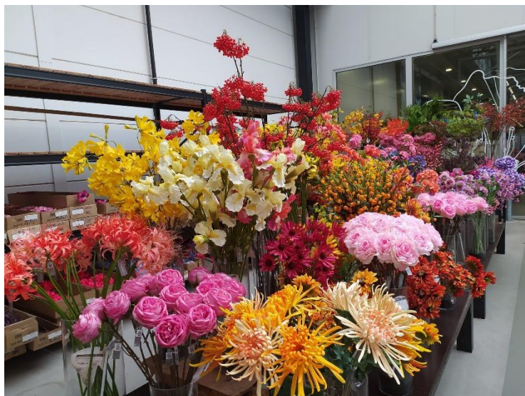
Slika 2.1. Širok asortiman boja i oblika rezanog cvijeća

Snaga tržišta i sektora cvjećarstva leži u raznolikosti asortimana koji se nudi u prodaji. Zbog toga je vrlo važno stalno uvoditi nove vrste i kultivare, posebice one s ekološki najprihvatljivijom proizvodnjom (Salachna, 2022). Prema istraživanjima, potrošači cijene intenzivniju boju, dužu stabljiku i veći cvijet, odnosno glavicu cvata. Stvaranje novih kultivara dugotrajan je, težak i skup proces, ali DNA tehnologija revolucionirala je tehnike uzgoja dopuštajući uzgajivačima umetanje, brisanje ili modificiranje pojedinačnih gena, stvarajući nove kultivare s korisnim osobinama, bez potrebe za žrtvovanjem poželjnih karakteristika (Porter i sur., 2012).