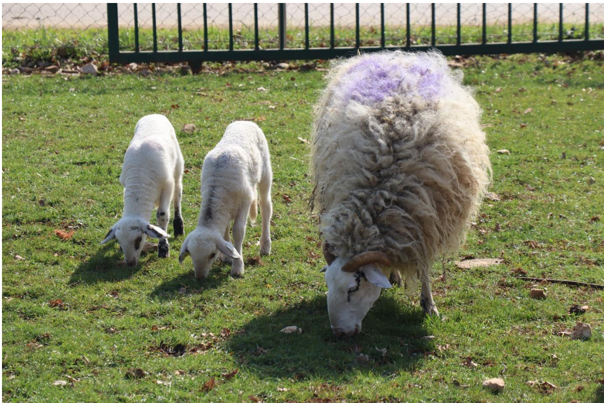
Slika 4.6.1.2. Prijenos znanja sa majke na potomstvo

prevladava strah od hranilica (valova, jasli) i nove hrane (Barnes i sur., 2008). Prilikom uzimanja, žvakanja i gutanja nove hrane, janjad slijedi obrasce ponašanja svojih majki ponašajnom imitacijom. Kod unakrsnog udomljavanja (engl. cross-fostering ) janjadi dviju različitih pasmina ( Clun Forest i Welsh Mountain ) na dva tipa pašnjaka različite botaničke strukture (kultivirani i samonikli), Key i Maclver (1980) utvrdili su kako janjad slijedi obrasce ponašanja i izbor krmiva svojih majki „udomiteljica“ i tako došli do zaključka da im hranidbene preferencije nisu urođena osobina, već znanje koju stječu učeći iz okoline, prvenstveno imitirajući obrasce hranidbenog ponašanja svojih majki (pravih bioloških ili majki „udomiteljica“). Jedan od pokazatelja da su majke „socijalni model“ za učenje hranidbenog ponašanja je činjenica da janjad nakon 6 tjedana starosti pa do odvajanja od svojih majki prirodnim putem, boravi unutar 2 metra udaljenosti (Slika 4.6.1.2) od svojih majki. Nadalje, janjad koja gleda svoje majke dok zajedno jedu imaju doživotno sjećanje na hranu s kojom su se susrele i pokazalo se da ju pamte čak i 3 godine kasnije (Lynch i sur., 1992). Razumijevanje ove transmisije znanja s majke na potomke, omogućavanje takvog učenja konzumacije hrane u praksi, trebali bi biti korisni u svim sustavima uzgoja, a osobito u onima koji zahtijevaju brzo prihvaćanje novih krmiva i visoku dnevnu konzumaciju hrane (Catanese i sur., 2012).