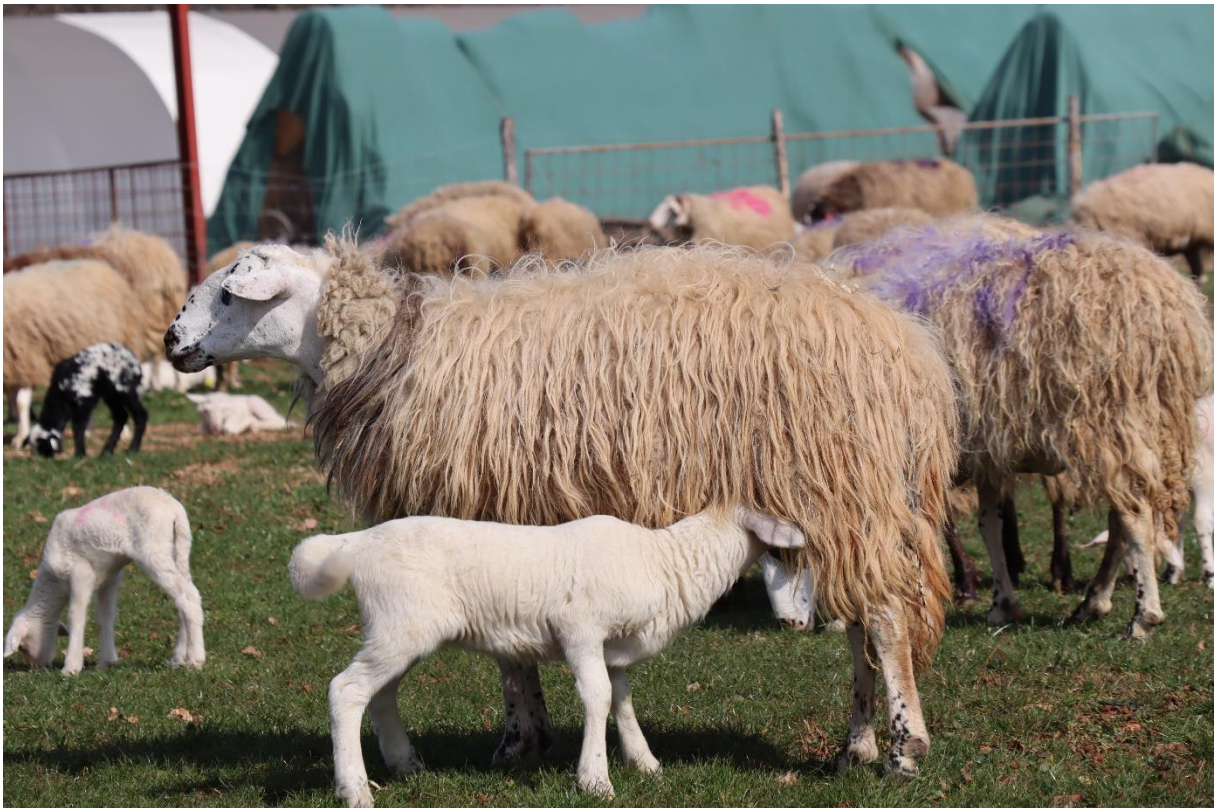
Slika 4.6.1.1. Sisanje janjadi na ispustu

Iz napisanog u prethodnim poglavljima o djelovanju pojedinog osjeta na oblike ponašanja koji su presudni kod uspostave majčinskog odnosa, moguće je rezimirati da ovce i janjad koriste specifične metode komunikacije (vokalne, vizualne i mirisne signale te dodir) kako bi koordinirali proces hranjenja (sisanja). U prvih nekoliko tjedana života, mladunče se oslanja na signale koje pruža majka kako bi lociralo izvor hrane (sisu), a manifestacije majčinske brige ovisi o broju janjenja, težini janjenja (komplikacije uzrokovane nepravilnim položajem ploda i sl.), genotipu ovaca, stresu tijekom gravidnosti, temperamentu ovce, kondiciji (pothranjenosti) i općem zdravstvenom stanju ovce (Dwyer, 2014). Većina navedenih čimbenika utječe na sposobnost janjadi da uspješno sisaju i održe se na nogama. Osjetilni signali janjadi omogućavaju ovci da prepozna svoju janjad između druge janjadi i ograniči svoju brigu na vlastito potomstvo (Slika 4.6.1.1). Znak da janje uspješno sisa su njegovi energični pokreti repa (lijevo – desno), a konstantno blejanje i niska temperatura janjadi su najčešći znakovi neuspješnog sisanja (Simmons i Ekarius, 2009).