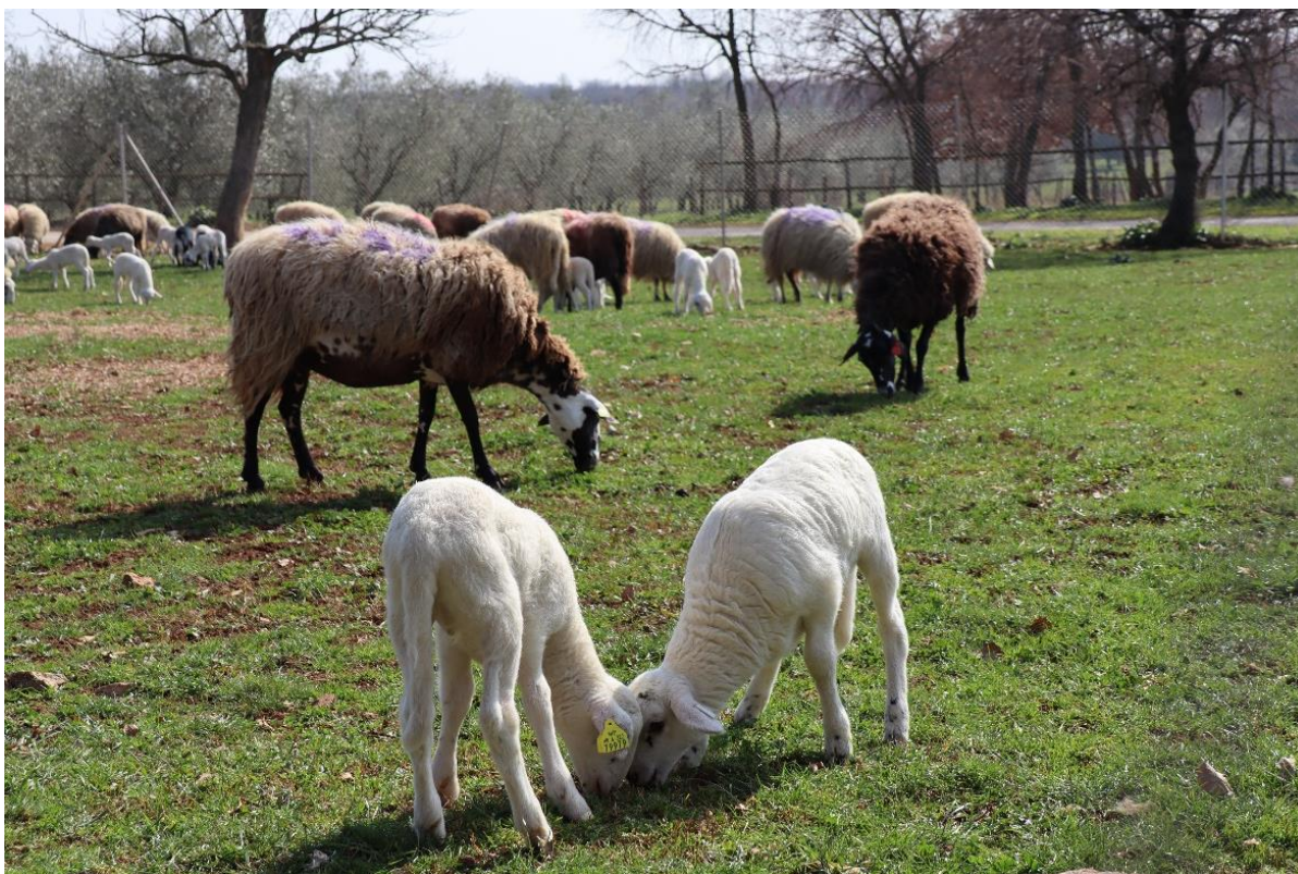
Slika 4.2.2. Zaigrana janjad i ovce na ispustu