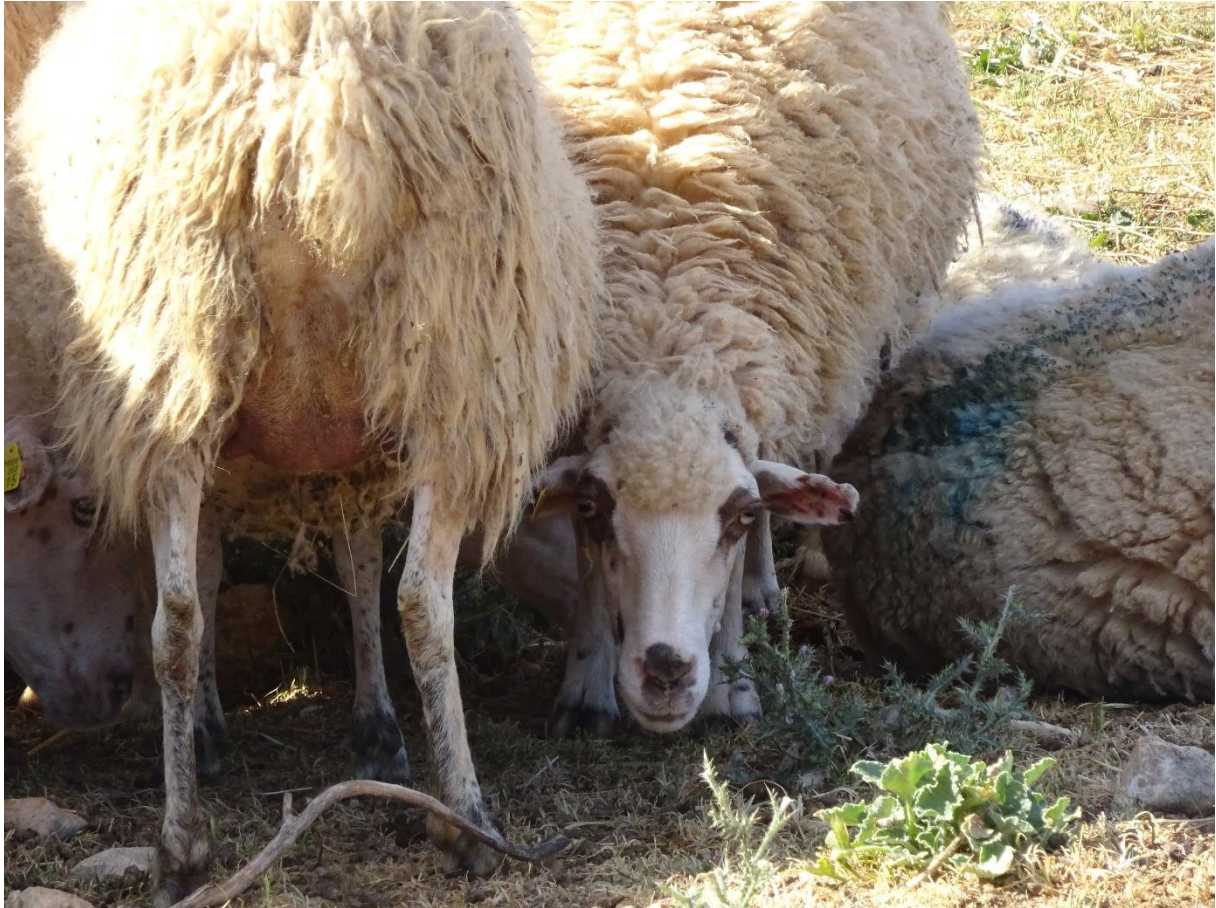
Slika 4.3.5.2. Potraga za hladom guranjem glave pod drugu ovcu