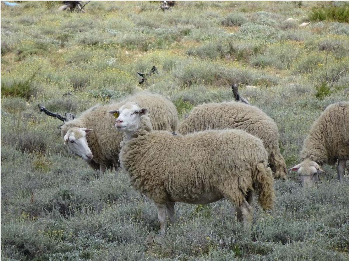
Slika 4.5.2.6. „Budno oko“ - ovce na ispaši

i hranidbenog ponašanja uloga vida se manifestira ponajviše preko informacije koje životinja prima od drugih životinja u okolišu u kojem se hrani. Drugim riječima, uloga vida se manifestira u promatranju drugih životinja u procesu hranidbe ili potrage za hranom i na taj način dobivanja informacije o: 1) mjestima na kojima mogu pronaći hranu, 2) ukusnosti hrane i, 3) sigurnosti hrane za konzumaciju (Lynch i sur., 1992).