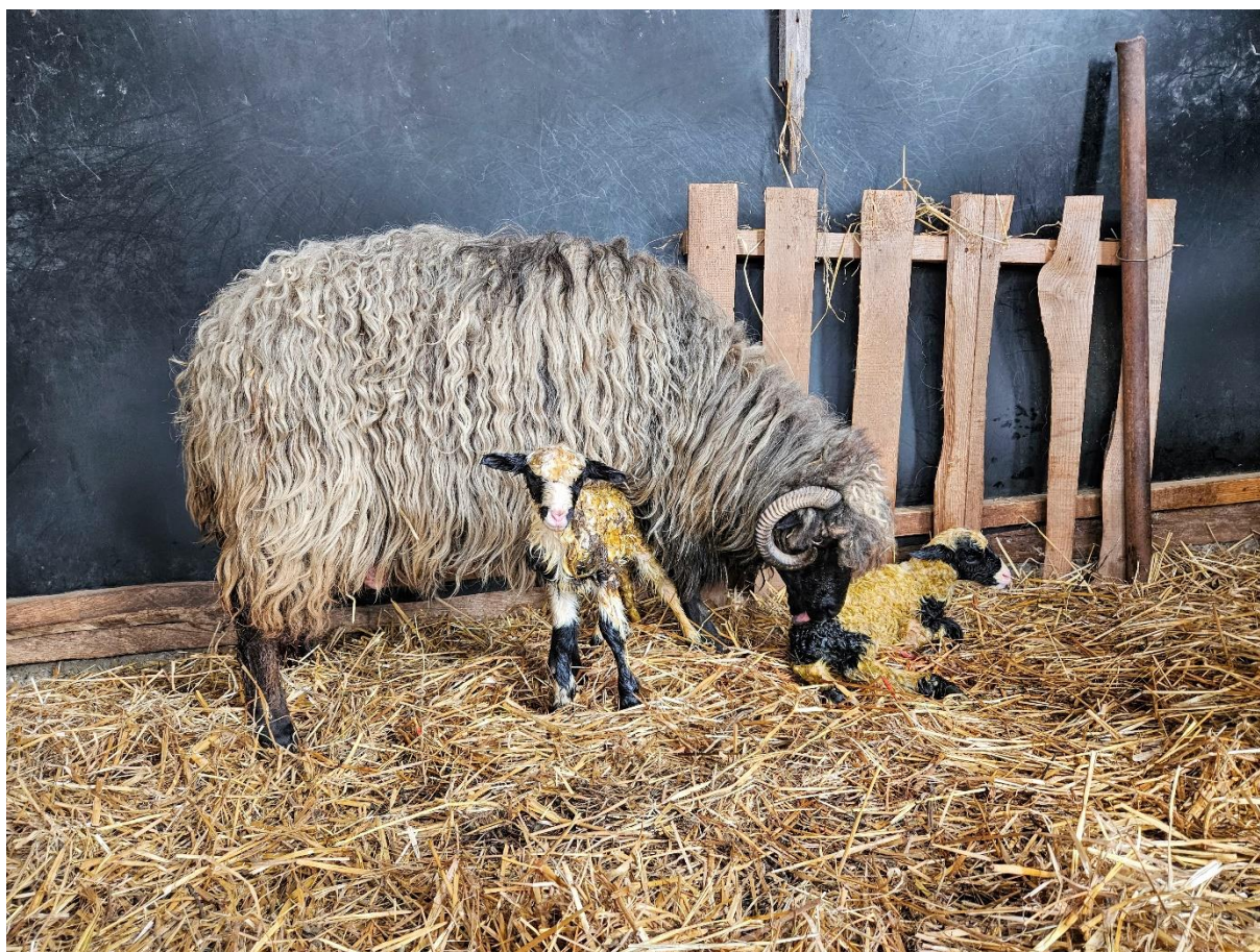
Slika 4.5.4.1. Uspostava majčinskog odnosa prema janjetu neposredno nakon janjenja

Dodir se u hranidbenom ponašanju ovaca također manifestira kroz uspostavljanje veze ovca-janje, gdje obostrana nježnost i dodir pored korištenja ostalih osjeta osigurava uspostavljanje boljeg majčinskog odnosa, a samim time i uspješnu imunizaciju, termoregulaciju i namirenje hranidbenih potreba janjadi. Unutar nekoliko minuta nakon partusa, ovca koja se ojanjila ležeći ustaje (što se može produžiti kod ovaca koje su imale teško janjenje i koje su umorne i iscrpljene) i počinje lizati (Slika 4.5.4.1.) janje i plodne vode prolivene po tlu, koje su inače odbojne, ali postaju privremeno privlačne ovci tijekom i neposredno nakon poroda (Nowak i sur., 2000).