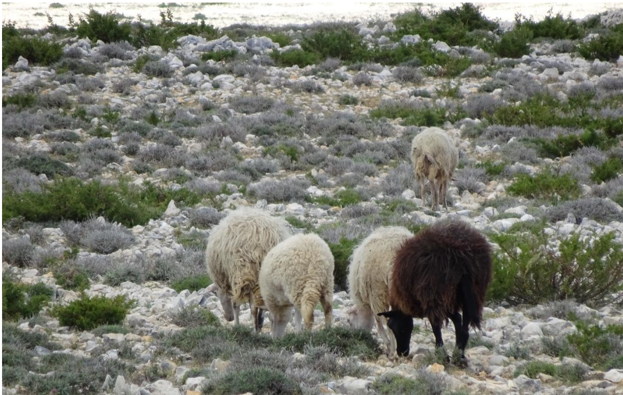
Slika 4.2.1. Ovce na oskudnom mediteranskom krškom pašnjaku u potrazi za hranom

Kod razmatranja komparativnih razlika u hranidbenom ponašanju ovaca hranjenih na jedan od opisanih načina, uvijek treba imati na umu da ovce hranjene ispašom imaju veće uzdržne potrebe od onih uzgajanih u zatvorenim sustavima (Blaxter, 1967) jer troše više energije na pronalazak hrane (pješačenje) i njen unos u probavni sustav (odgrizanje). Nadalje, ovce u zatvorenim sustavima uzgoja imaju manju mogućnost da iskažu neke njima svojstvene oblike ponašanja, a često su zbog gustoće naseljenosti i samih obilježja prostora u kojem borave podložnije utjecaju ostalih životinja u stadu kao što je hijerarhija, kompeticija za hranu i dr. Obzirom na dominaciju pašnjačkog načina ishrane ovaca u svijetu, kao i činjenicu da je većina studija koje su proučavale hranidbeni bihevizizam provedeno u uvjetima pašnjačke ishrane, ponašanje ovaca na pašnjaku je izdvojeno i opisano u okviru posebnog odlomka