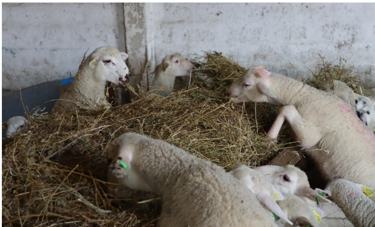
Slika 4.2.3. Hranidba janjadi u štali