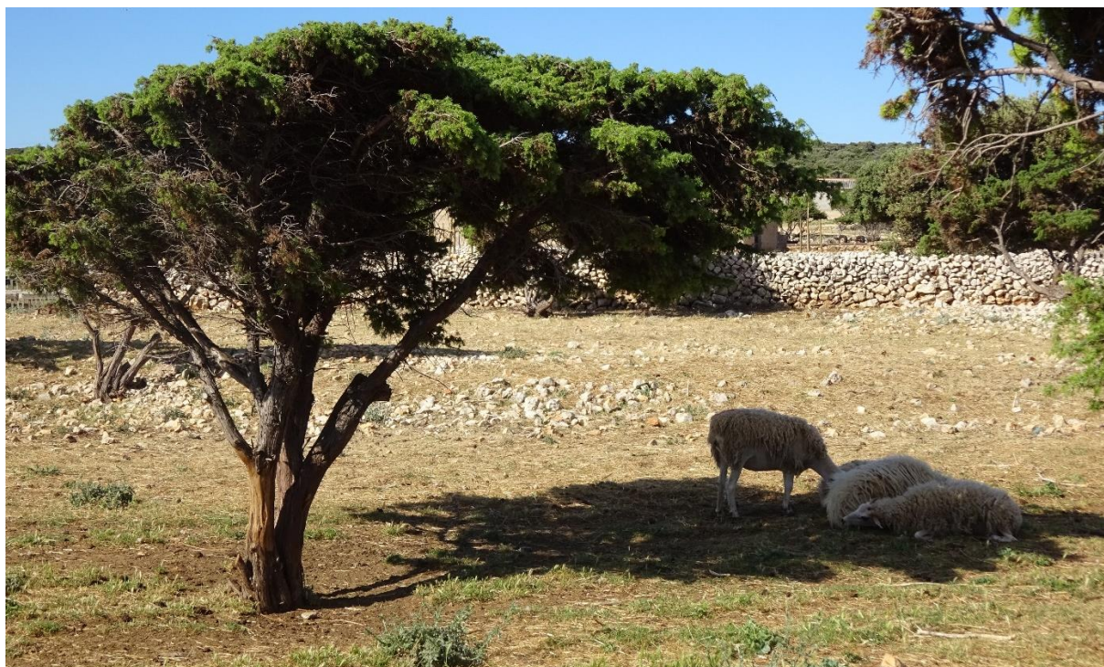
Slika 4.3.5.1. Ovce u potrazi hladom u vrućim ljetnim mjesecima

1) Vizualnom percepcijom: sposobne su prepoznati sjene i njih asociirati sa hladnijim mjestima na pašnjaku. Prilikom ispaše često traže područja s visokim raslinjem (drveće ili grmljem), stijene, suhozide, vozila i druge objekte koji stvaraju hlad (Slika 4.3.5.1.).