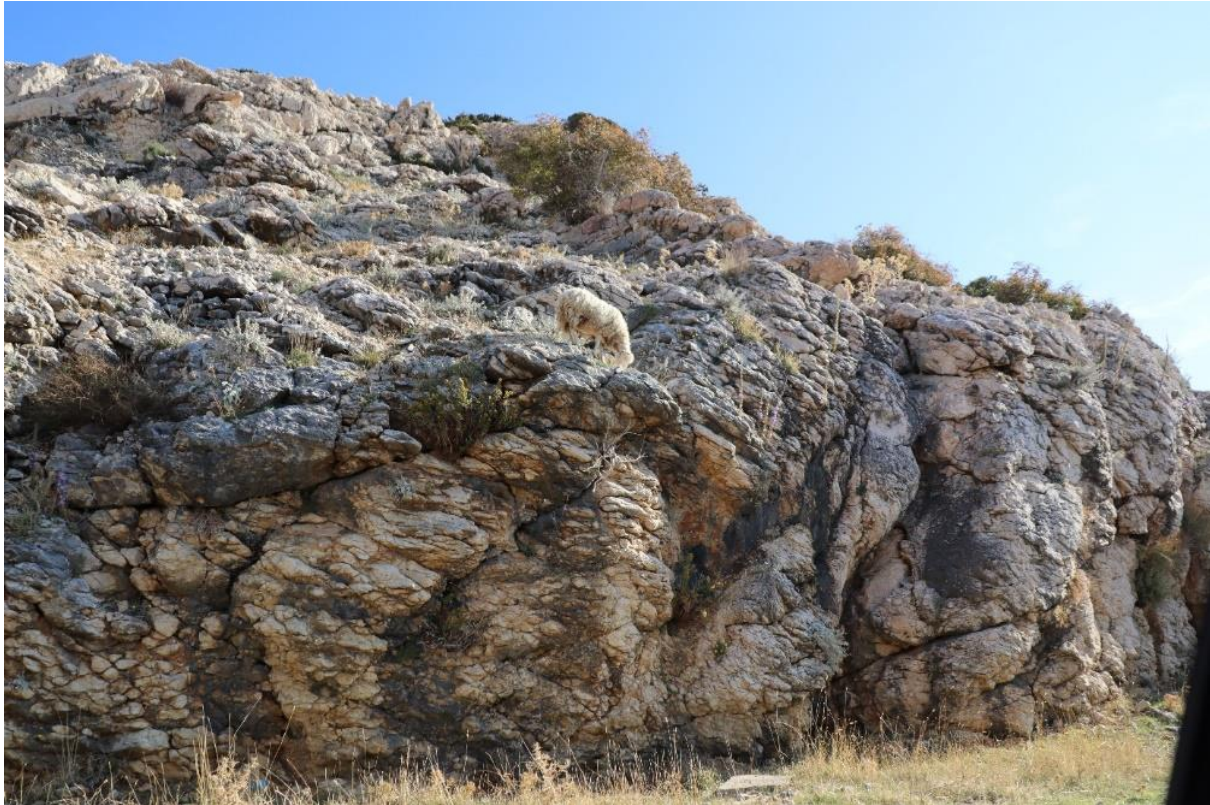
Slika 4.3.1.1. Ovca u potrazi za hranom na oskudnim uvjetima ispaše na otoku Pagu