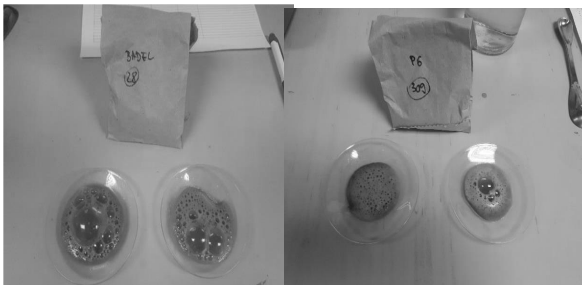
a) Uzorak 2 (vrlo jako karbonatno tlo)

Neki istraživači (npr. Rowell, 1994.) navode da bi se svi uzorci s intenzivnom reakcijom na 10% HCl trebali smatrati vrlo jako karbonatnima (odnosno da nebi trebalo pokušavati razlikovati „jako karbonatne“ od „vrlo jako karbonatnih“ uzoraka) jer se fine razlike u reakciji takvih tala na kiselinu teško zamjećuju golim okom. U našem slučaju, takvi problemi ipak nisu zabilježeni, obzirom da su nepodudaranja između procjene i analize karbonatnosti zabilježena kod uzoraka sa sadržajem karbonata od 3,5% i 8,4% (dakle isključivo u srednje karbonatnim uzorcima). Štoviše, svi vrlo jako karbonatni uzorci kvalitativnom analizom su ispravno procijenjeni kao takvi (Tablica 2).