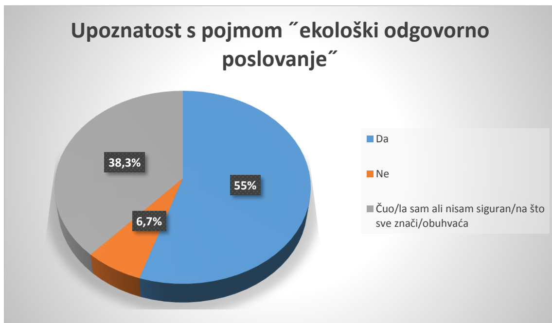
Grafikon 2. Upoznatost s pojmom "ekološki odgovorno poslovanje"

Jedno od glavnih problema, a i ciljeva ovog rada bilo je ispitati jesu li i u kojoj mjeri vlasnici agroturističkih gospodarstava upoznati s pojmom "ekološki odgovorno poslovanje". Rezultati ankete pokazuju da je 55% vlasnika čulo za taj pojam, 38,3% je čulo, ali nije sigurno što taj pojam sve obuhvaća, dok 6,7% nije nikada čulo za pojam "ekološki odgovorno poslovanje" (Grafikon 2.).