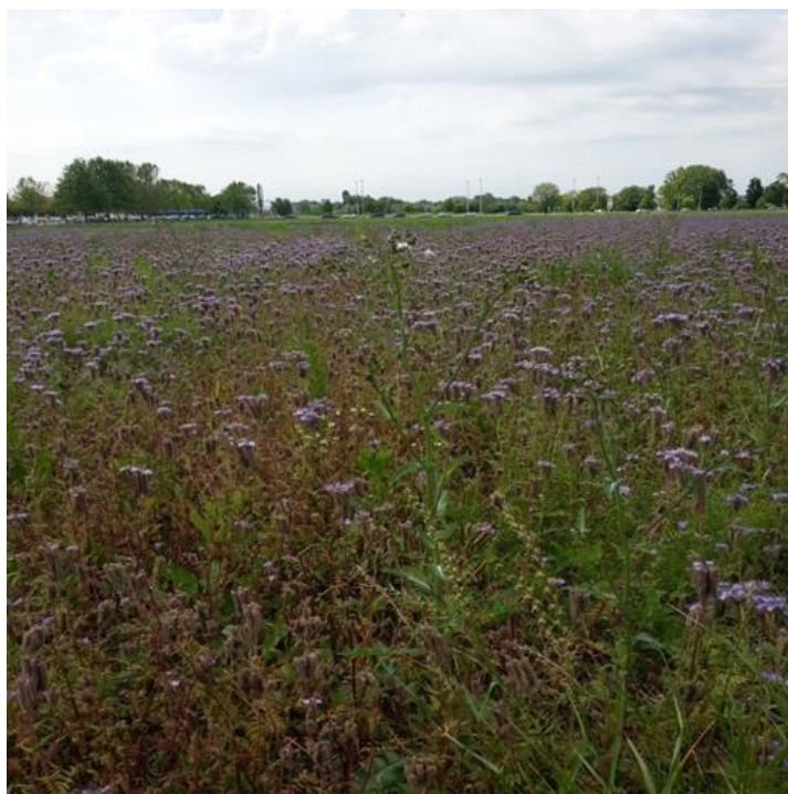
Slika 7. Polje facelije na pokušalištu Maksimir (Palčić, 2015)

Faceliju možemo sijati u rano proljeće, ljeti ili početkom jeseni. Najčešće se sije od kraja ožujka do svibnja, a ako je vrijeme vlažno i u lipnju. Kada se sije u rano proljeće, i ako ima dosta padalina, facelija brzo niče jer ima dosta vlage u tlu. Optimalan pH tla je 6-7,5, a zahtjevi za vodom su 200-400 mm godišnje. Sjeme facelije je sitno, veličine 2,5-3 mm, i sije se na dubinu od 2 cm. Zbog sitnog sjemena zahtjeva vrlo kvalitetnu predsjetvenu pripremu tla. Za uspješan uzgoj facelije važno je na vrijeme uzorati zemlju, izvršiti predsjetvenu pripremu tla te ga dobro usitniti da bi se sjeme moglo položiti na željenu dubinu. Osnovnu pripremu tla nakon predusjeva treba obaviti na dubini od 25-30 cm. Ako se sije kao postrni usjev oranje treba obaviti na dubini od 15 cm. Predsjetvenu pripremu treba izvršiti još u jeseni tako da je moguće sjetvu obaviti kada su pogodni uvjeti za sjetvu. Nakon sjetve tlo se poravna, a ako se sije u ljeto potrebno je i valjati. Proljetnom sjetvom moguće je suzbiti sve korove koji se pojavljuju zato što facelija brže niče na nižim temperaturama od korova. Kada u proljeće krenu korovi, sredinom travnja, facelija je već tada dosta prekrila površinu tla gustim sklopom i na taj način sprječava nicanje i rast korova (Jaramaz, 2012). U to vrijeme još ne kreće intenzivan rast korova, pa ih facelija poslije zaguši, te nije potrebno dodatno okopavanje ili upotreba herbicida koja nije poželjna u pčelarskoj proizvodnji ( www.cedar-agro.hr .)