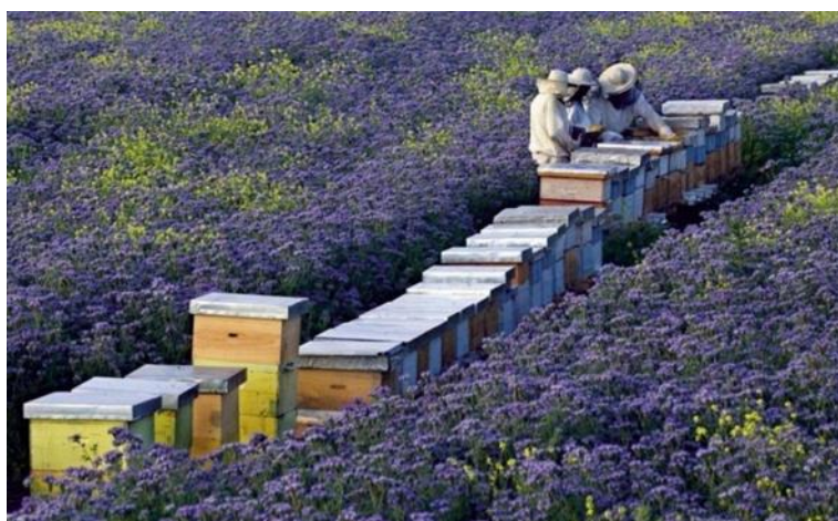
Slika 3. Košnice za proizvodnju facelijinog meda

sur., 2004). Puškadija i sur. (2004) navode kako je uzgajanje facelije unosan posao te je mogućnost zarade 15 % više od uloženog. Naime, po hektaru se može dobiti više od 1000 kg meda, pa ako se taj iznos pomnoži sa 3,5 eura (koliko prosječno stoji kilogram meda), dobiti će se ukupan prihod od 3.500 eura. Prema tome, ako se ovome doda i zarada na oko 50 kg cvjetnog praha i 600 kg sjemena, može se reći da je dobit velika. Jaramaz (2012) navodi da facelija po hektaru daje 250-1000 kg nektara i 30-90 kg polena. Do razlike u rezultatima može doći zbog neujednačenih uvjeta uzgoja i zastupljenosti pojedinih vrsta. Uzgoj facelija kao usjeva pune vegetacije može osigurati od 100 do 450 kg meda vrlo visoke kvalitete po ha (Svečnjak, 2007).