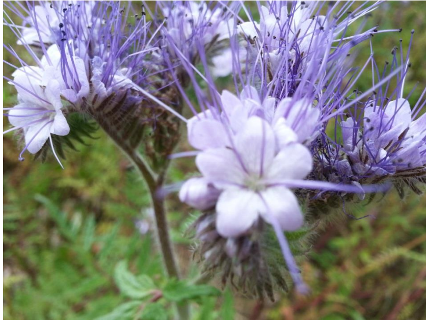
Slika 1. Cvijet facelije (Palčić, 2015)

Facelija je jednogodišnja zeljasta biljka koja se razvija iz sjemena te klije od proljeća do jeseni. Klijanje sjemena facelije inhibirano je sunčevim svjetlom zbog čega ono ne smije ostati na površini, te se prilikom sjetve treba pokriti sa zemljom (Hulina, 1993, Ciler, 2015). Nakon što nikne, usjev ima vrlo brzi vegetativni porast tako da u pravilu zaguši sve korove. Također zbog brzog vegetativnog porasta potrebna joj je prihrana dušika, fosfora i kalija (Ciler, 2015). Poželjno je provesti analizu tla za opskrbu s hranjivim elementima kako bi se što preciznije izračunala njihova potreba (Jaramaz, 2012). Facelija odlično reagira na folijarnu prihranu mikro elemenata, osobito bora koji se uglavnom unosi u fenofazi pupoljka i cvatnje ( www.aliscamag.hu ).