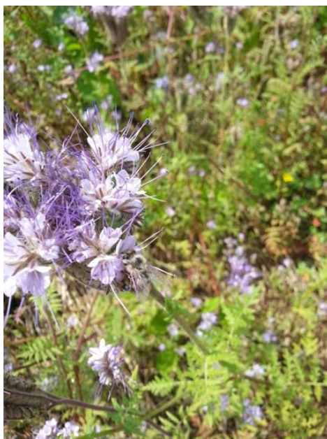
Slika 4. Cvijet facelije kao izvor nektara (Palčić, 2015)

Osobina facelije da obilno i dugotrajno cvjeta i može imati koristan učinak na povećanje broja i raznolikost vrsta insekata, jer proizvodi visokokvalitetni nektar i pelud. Uzgajanje biljnih vrsta velike nektarne vrijednosti pruža šansu za povećanje rentabilnosti pčelarstva (Puškadija i sur., 2004). Prema literaturi, produkcija nektara i koncentracija šećera u cvijetu facelije raste tijekom jutarnjih sati i dostiže svoj maksimum oko podneva, a zatim opada u poslijepodnevnom satima. Pčele najčešće posjećuju cvjetove facelije između 11.00 i 16.00 h. Međutim, prema istraživanju Williams i Christian (1991) koje je provedeno u Engleskoj najveći broj solitarnih pčela na faceliji utvrđen je u razdoblju od 9:00 do 11:00. Učestali posjeti solitarnih pčela faceliji mogu biti uzrokovani prelaskom medonosne pčele na lipovu pašu.