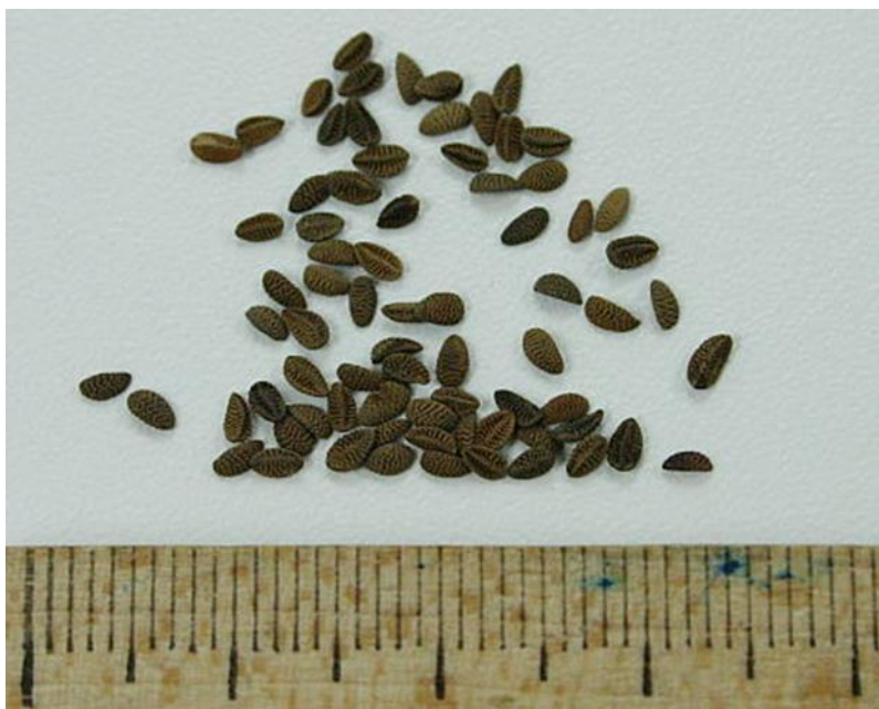
Slika 8. Sjeme facelije