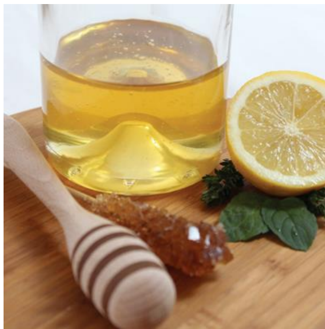
Slika 2. Facelijin med ( http://www.pcelarstvo.hr )

Medonosno bilje pčelama daje pčelinju pašu i ona je osnova za dobivanje pčelinjih proizvoda. Med je pčelinji proizvod koji nastaje preradom nektara ili medljike (medne rose) (Dujmović Purgar i Hulina, 2007). Smatra se da je facelija izuzetno korisna biljka, te spada među najbolje medonosne vrste, a cvjeta dugo i obilno (Jaramaz, 2012). Cvjetovi sadrže puno nektara s prosječnim sadržajem po cvijetu od 0,42 do 0,75 mg, te udjelom šećera od otprilike 20 % (Špoljar, 2015). Med facelije je u tekućem stanju bezbojan dok nakon kristalizacije poprima bjelkastu, a ponekad i blago zlatnu boju (slika 2.). Odlične je kvalitete, aromatičnog mirisa i nježnog okusa, te je među najboljim vrstama. Med sadrži oko 90% fruktoze i glukoze, bjelančevine, organske kiseline, i više od 25 mikro i makro elemenata važnih za organizam. Sadrži i vitamine iz grupe B, zatim C, K, E, provitaminom A (Puškadija i sur., 2004). Nadalje, med se primjenjuje i u industriji slatkiša, medenjaka, kolača, torti, bombona, likera i slatkih vina, sokova i sirupa, te džemova i marmelada (Vranješević, 2009).