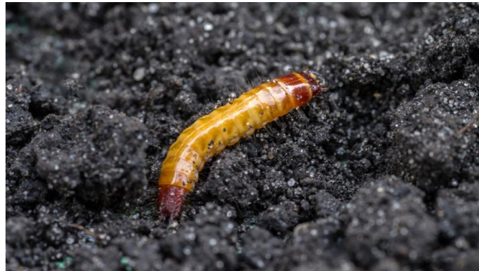
Slika 2.2.7.1. Ličinka klisnjaka (žičnjak)

agrotehničkih mjera potrebno je provoditi dobru obradu tla, sjetva kulturnih biljaka gustog sklopa na zaraženim područjima, sjetva u pravo vrijeme jer prerana sjetva produljuje osjetljive stadije klijanja i nicanja, dodavanje mineralnih gnojiva koja ispuštaju amonijak štete žičnjacima. Kemijske mjere provode se širom, u trake ili se tretira sjeme (Maceljski, 1999). U FIS bazi za suzbijanje žičnjaka dozvoljeni su teflutrin, lambda-cihalotrin, cipermetrin i spinosad (FIS, 2023).