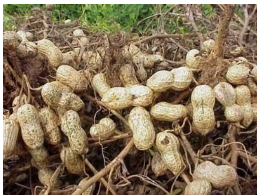
Slika 2.1.6.1. Uzgoj kikirikija