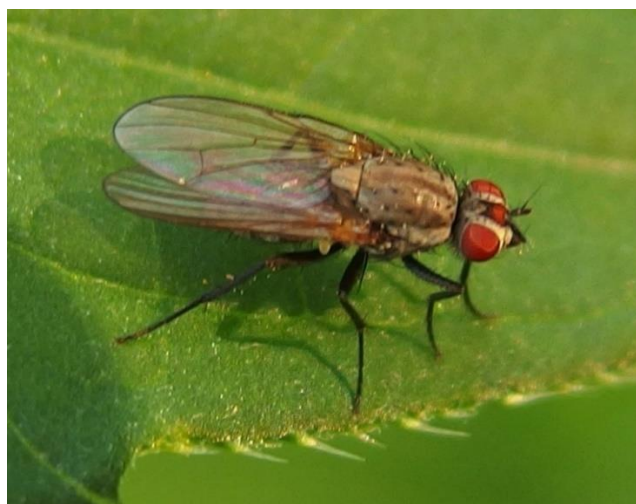
Slika 2.2.12.1. Korijenova muha Delia florilega

Potrebno je provoditi mjere koje smanjuju štete poput agrotehničkih mjera koje ubrzavaju nicanje, izbjegavanje sjetve u vrijeme jačeg leta muha. Prag odluke iznosi 1 ličinka po biljci ili sjemenu. U FIS bazi trenutno nema dozvoljenih insekticida za suzbijanje grahovitih muha na području Republike Hrvatske (FIS, 2023).