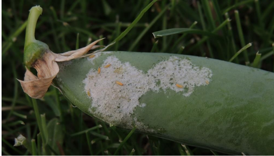
Slika 2.2.1.1. Štete izazvane graškovim tripsom na mahuni

Suzbija se tako da se unište zaraženi ostaci bilja ili pri jakom napadu insekticidima odmah nakon cvatnje. U FIS bazi nema registriranih insekticida koji su dozvoljeni za suzbijanje graškovog tripa u Republici Hrvatskoj u 2023. godini (FIS, 2023).