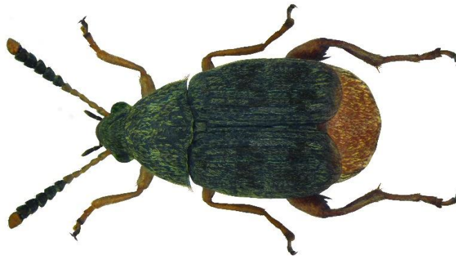
Slika 2.2.8.1. Grahov žižak

Za manje zaraze preporuča se izlaganje zrna niskim temperaturama u zamrzivaču na -18 °C pri čemu svi razvojni oblici uginu za 3 sata. Također, zaraza se može potpuno uništiti i visokim temperaturama na 65 °C tijekom 4 sata (Maceljski, 1999).