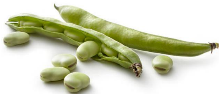
Slika 2.1.1.3. Plod graha (mahuna)

Plod graha je mahuna dužine 4 do 20 cm te promjera 10 do 30 mm (Slika 2.1.1.3.). Mahuna može biti ravna, sabljasta ili savijena poput kifle, tupog ili šiljatog vrha, a boje mahune kreću se od svijetlozelene, žutozelene, žute do ljubičaste (Knezović i sur., 2008).