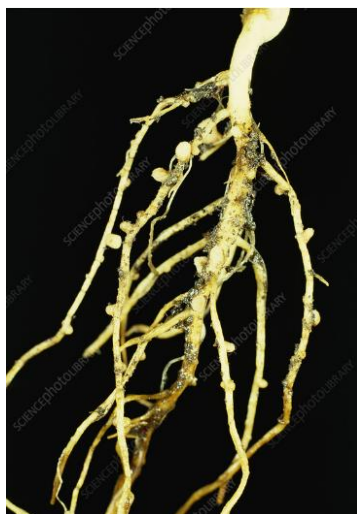
Slika 2.1.1.1. Kvržice korijena graha

Grah mahunar ( Phaseolus vulgaris L.) je jednogodišnja, zeljasta biljka koja pripada botaničkoj porodici Fabaceae i rodu Phaseolus (Knezović i sur. 2008). Lešić i sur. (2004) opisuju morfološka svojstva graha: korijen je malen, s razmjerno kratkim glavnim korijenom koji samo u vrlo dobrim tlima doseže dubinu do 1 m. Sekundarno korijenje rašireno je u površinskih 20 cm tla te se na njemu razvijaju kvržice sa Rhizobium bakterijama (Slika 2.1.1.1.).