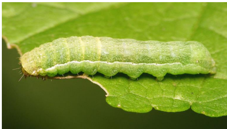
Slika 2.2.10.1. Gusjenica lisne sovice Mamestra brassicae

Za suzbijanje se koriste jajni paraziti iz roda Trichogramma , a brojnost smanjuju trčci i ptice. Potrebna je dugoročna prognoza i ako se nađe 1-3 kukuljice/ m^2 može se očekivati jači napad. Pragom odluke smatra se 8 do 10 gusjenica/ m^2 u 2. i 3. razvojnem stadiju gusjenice. Mjere koje je potrebno provoditi su plodored, uporaba Bacillus thuringiensis kurstaki , a gusjenice napadaju i brojne mikoze i viroze (Maceljski, 1999). U FIS bazi za RH u 2023. godini registrirani su insekticidi lambda-cihalotrin i deltamerin (FIS, 2023).