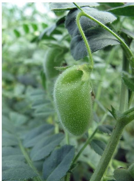
Slika 2.1.5.1. Slanutak