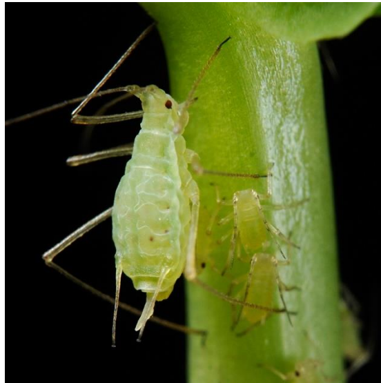
Slika 2.2.4.1. Zelena graškova uš

Prati se žutim ljepljivim pločama, a suzbija se za vrijeme jačeg napada insekticidima registriranim za kupusnu lisnu uš: deltametrimom, pirimikarbom, tau-fluvalinatom (FIS, 2023). Također, provode se preventivne i mehaničke mjere navedene za suzbijanje bobove uši.