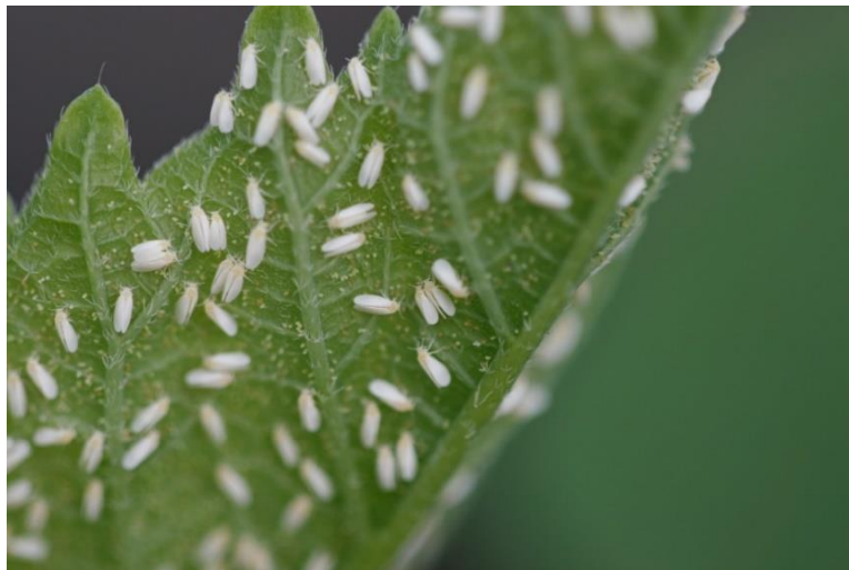
Slika 2.2.5.1. Duhanov štitasti moljac na naličju lista

Potreba za suzbijanjem utvrđuje se vizualnim pregledom ujutro dok kukci miruju okretanjem naličja najmlađih listova (1 odrasli/100 biljaka) i žutim ljepljivim pločama (1 ploča na 100 m 2 koje ujedno mogu biti i mehanička mjera suzbijanja (Šimala i sur., 2016). Za biološko suzbijanje primjenjuje se parazitska osica Encarsia formosa . Što se tiče kemijskog suzbijanja u ovom slučaju nije dovoljna mjera nego se mora kombinirati sa ostalim mjerama. Od agrotehničkih mjera zaštite potrebno je ukloniti sve potencijalne domaćine korove i uništavanje ostataka biljaka, navodnjavanje sustavom za kapanje, a od mehaničkih mjera postavljanje zaštitnih mreža i korištenje 10 žutih ljepljivih ploča na 100 m 2 (Šimala i sur., 2016).