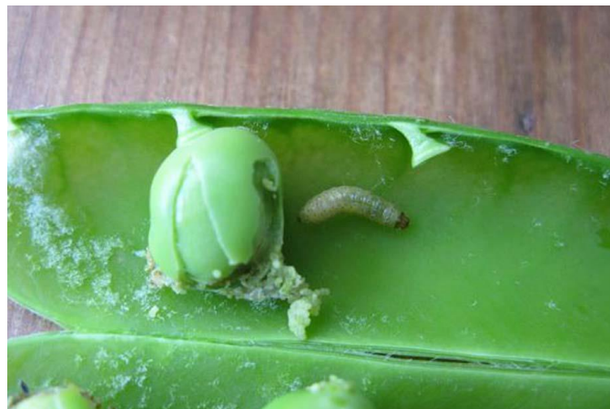
Slika 2.2.11.1. Gusjenica graškovog savijača

Potrebno je provoditi mjere koje smanjuju zarazu, a to su: rana i brza berba jer smanjuje broj gusjenica za prezimljenje, sjetva ranozrelih kultivara jer su manje podložni napadu, uklanjanje biljnih ostataka i pravilna obrada tla. Primjena insekticida preporučuje se samo u slučaju rizika od jačeg napada ili uzgajanja graška za konzerviranje i to u vrijeme cvatnje, te ponovno 14 dana kasnije. U FIS bazi u 2023. godini za suzbijanje graškovih savijača na području RH dozvoljene su djelatne tvari esfenvalerat, lambda-cihalotrin, deltametrin, tau-fluvalinat (FIS, 2023).