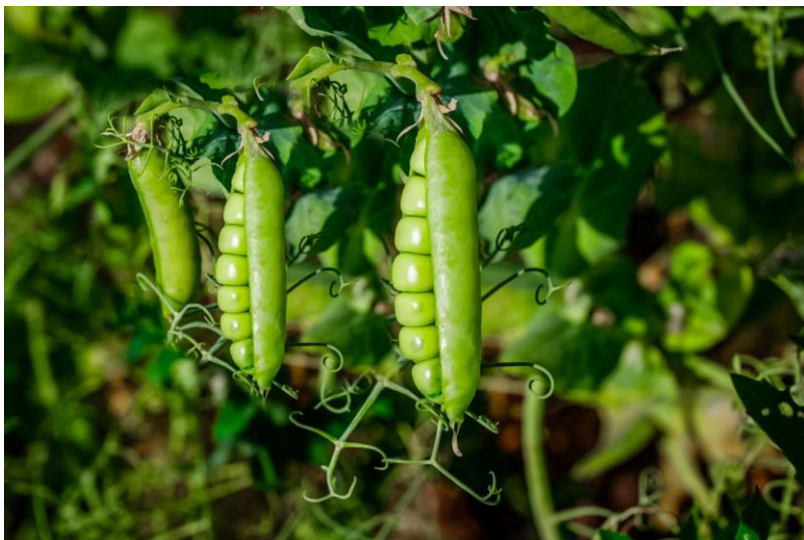
Slika 2.1.3.1. Plod graška (mahuna)

Grašak je zahvaljujući Gregoru Mendelu (1865.) postao jedan od najistraživanijih i najpoznatijih biljnih vrsta (Stjepanović i sur., 2012). Uzgaja se kao povrtna kultura radi zrna koje se koristi u tehnološkoj zrelosti u svježem stanju ili industrijski prerađeno. Ima visoku nutritivnu vrijednost s uravnoteženim odnosom bjelančevina i ugljikohidrata, ima mnogo vitamina i minerala i odličan je izvor vlakana (Lešić i sur., 2012).