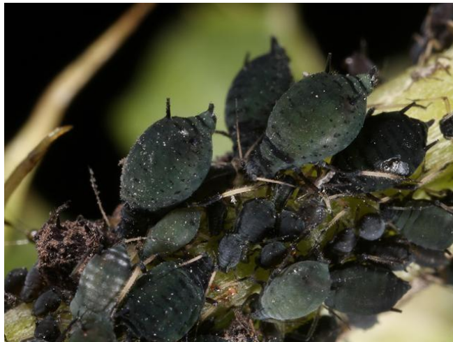
Slika 2.2.3.1. Crna bobova uš

Za potrebu suzbijanja radi se pregled repišta ili ocjena po Banksu. Prag odluke iznosi 20-30 % zaraženih biljaka. Kod velikih parcela može se provoditi tretiranje samo rubova parcela i po potrebi još jedno tretiranje cijele površine. Trenutno registrirani insekticidi za primjenu na mahunarkama su deltametrin, esfenvalerat, flupiradifuron, tau-fluvalinat i pirimikarb (FIS, 2023). Također, potrebno je provoditi integriranu zaštitu bilja što uključuje i primjenu preventivnih mjera: obrada tla, primjena plodoreda, pravilna gnojidba; mehaničke mjere: zaštitne mreže, prekrivanje usjeva agrotekstilom, mehaničko uništavanje korova domaćina, uklanjanje biljnih ostataka, te ispiranje lisnih uši mlazom vode; fizikalne mjere: postavljanje većeg broja žutih ljepljivih ploča u nasadu za krilate oblike; kemijske: navedeni insekticidi, mineralna ulja za zimska jaja na prezimljenju, biljka neem i biološke mjere: korištenje prirodnih neprijatelja poput božjih ovčica, ličinke zlatooka, parazitske osice i gljiva Verticillium lecanii (Maceljski, 1999).