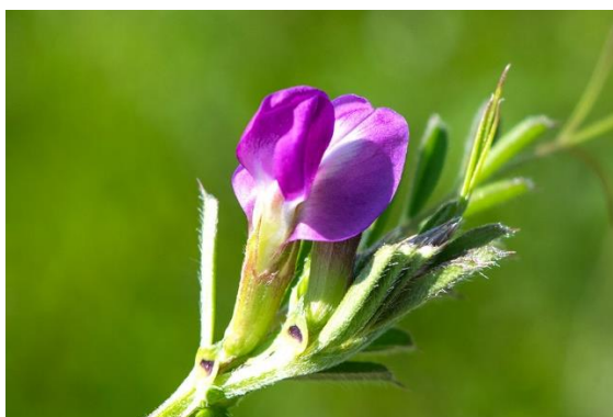
Slika 2.1.7.1. Grahorica

Što se tiče upotrebe, jestivi su mladi listovi, mahune i sjemenke. Koristi se osušen kao čaj za cirkulaciju i kao antidijabetik (Grlić, 1990).