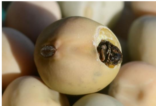
Slika 2.2.9.1. Zrno oštećeno razvojem graškovog žiška

Graškov žižak se razmnožava u polju, ali ne i u skladištu stoga se ciljano suzbijanje provodi u polju. Prag odluke je 60 jaja ili tragova ovipozicije na četvornom metru (Maceljski, 1999). Dakle, provode se vizualni pregledi i koristi se kečer. Kod ulova kečerom prag odluke je 2-3 žiška na 25 zamaha kečerom. Obzirom da je dugo razdoblje odlaganja jaja, tretiranje je potrebno ponavljati nakon 10-14 dana (Maceljski, 1999). Za rok tretiranja potrebno je pratiti pojavu štetnika i cvatnju graška osobito na rubnim dijelovima parcela. Također, zaraza se može smanjiti uništavanjem biljnih ostataka na polju, te izbjegavati sjetvu na površinama koje su potencijalna mjesta prezimljenja žiška na temelju prethodnih zaraza (Maceljski, 1999). U FIS bazi za suzbijanje graškovog žiška dozvoljen je insekticid esfenvalerat (FIS, 2023).