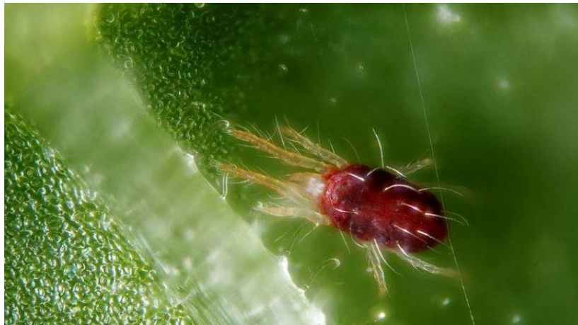
Slika 2.2.13.1. Koprivina grinja

Suzbijanje se provodi preventivnim mjerama poput uklanjanja korova, uništavanja biljnih ostataka, podizanju vlage zraka čestim zalijevanjem biljaka, mehaničkim ispiranjem pauka s biljaka, a kemijsko suzbijanje je potrebno primijeniti u početku zaraze. Potrebno je koristiti visoki utrošak škropiva od 3000-5000 litara/ha. Biološke mjere obuhvaćaju unošenje grabežljivih grinja vrsta Phytoseiulus persimilis i Amblyseius cucumeris (Maceljski, 1999).