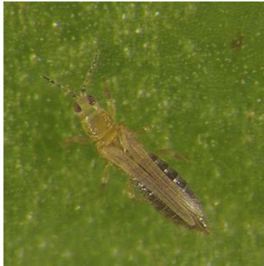
Slika 2.2.2.1. Resičar Thrips tabaci