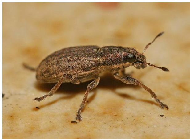
Slika 2.2.6.1. Sitona humeralis

Za procjenu štetnosti provode se vizualni pregledi a prag odluke prema njemačkim autorima iznosi 10 % lisne mase ili 2-3 imaga/ m^2 graška ili 10 imaga/ m^2 lucerne i djeteline (Maceljki, 1999). Za suzbijanje pipa mahunarki u FIS bazi za područje RH registriran je samo deltametrin (FIS, 2023).