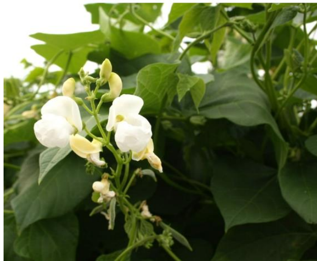
Slika 2.1.1.2. Cvijet graha

Cvjetovi su leptirastog oblika, na kratkim stapkama, po 1 ili 2 na koljencu, rjeđe 3 do 4 na dužim stapkama (Slika 2.1.1.2.). Cvijet se sastoji od 5 zupčastih lapova, 5 latica, 10 prašnika i jednogradne plodice s tučkom. Dominira samooplodnja, no moguća je i stranooplodnja zbog čestog dolaska kukaca na cvjetove (Lešić i sur., 2004).