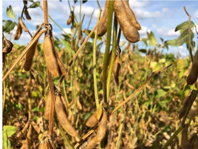
Slika 2.1.2.1. Soja spremna za žetvu

gnojidbe, soja na našim tlima pozitivno reagira na jaču gnojidbu s NPK gnojivima te prihranu dušikom prilikom kultivacije usjeva (Vratarić i Krizmanić, 1997). Ako se do cvatnje ne razvijaju kvržice na korijenu potrebno je prihranom dodati 60 do 80 kg/ha dušika (Gagro, 1997). Žetva soje provodi se žitnim kombajnima u vrijeme kada je soja bez listova, a stabljika odrvenjele građe (Slika 2.1.2.1.).