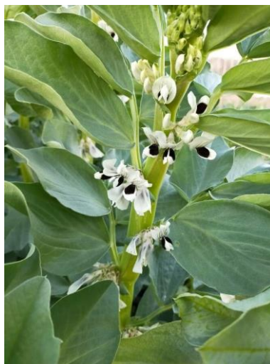
Slika 2.1.4.1. Bob u cvatnji

Bob se koristi u ljudskoj prehrani pri tehnološkoj zrelosti kao svježe ili zamrznuto mlado zrno i mahune i također u ishrani stoke kao zrelo zrno (Metayer, 2004). U Mediteranu se često uzgaja radi sprječavanja erozije. Uz gospodarsku važnost ima i društvenu ulogu. Stari Grci i Rimljani koristili su ga prilikom glasanja gdje je bijelo bob značio da, a crni ne. U prošlosti je bio vrlo važna namirnica jer je to biljka koja daje jedan od prvih uroda krajem proljeća (Metayer, 2004).