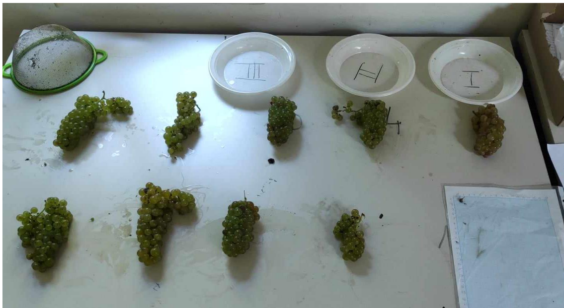
Slika 10: Ampelometrijska mjerenja sorte 'Rizling rajnski'

** Razlika je signifikantna za (Pr > F) < 0,05 uz 95% vjerojatnosti