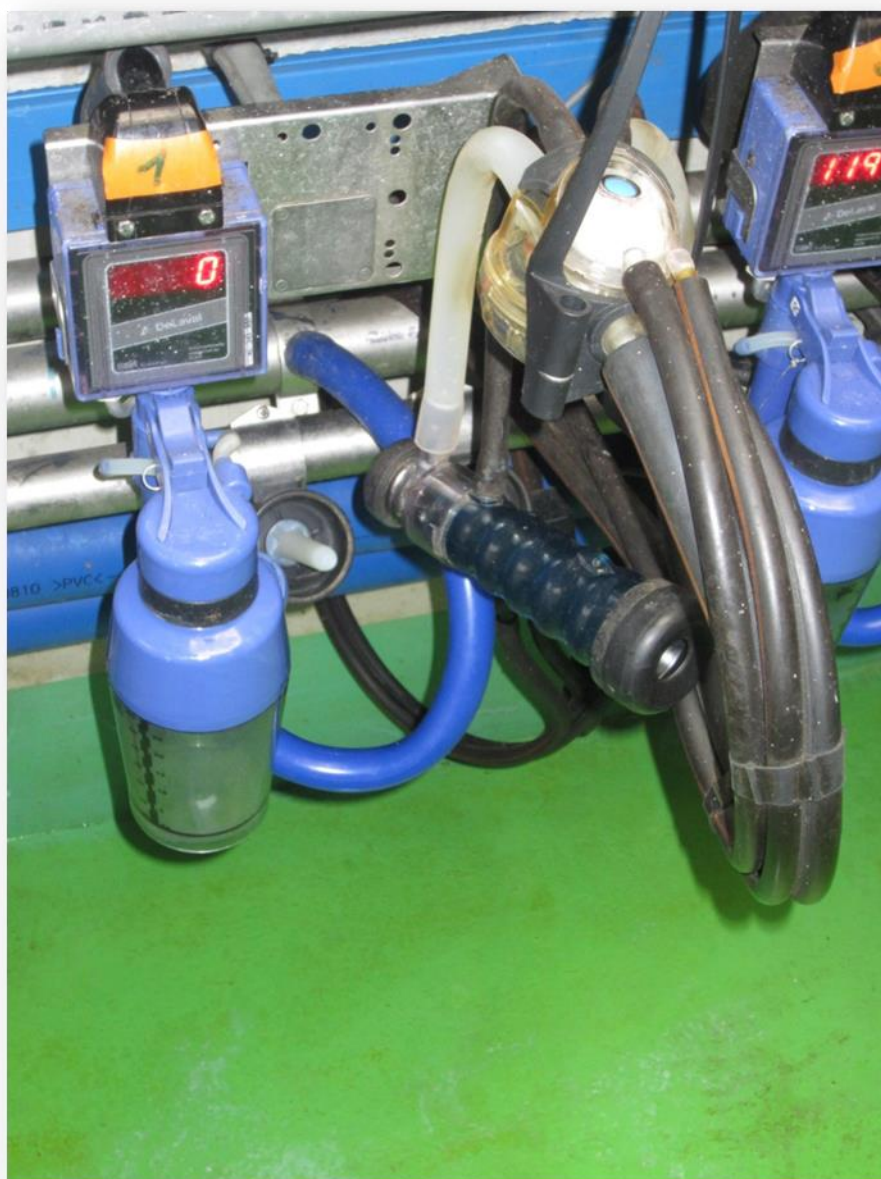
Slika 3. Mjerač protoka mlijeka.