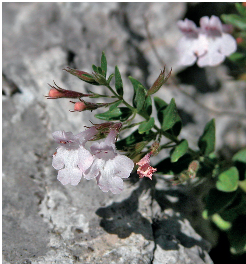
Slika 4. Micromeria croatica – jedinka bijele boje cvjetova; Kremer, 2015.

dužina lista a prosječno najveću varijabilnost za svojstvo dužina cvjetne stapke. U provedenom istraživanju, svojstva cvijeta varirala su više od svojstava lista. Za ukrasne svrhe, naročito se istaknula jedna jedinka unutar populacije kod koje je izmjeren najveći prosječni broj cvjetova na izbojku i to čak 40. Izdvojena jedinka imala je ujedno i prosječno najkraću čašku, najkraće zupce čaške i najkraće brakteje u odnosu na ostale biljke. Kremer i Krušić Tomaić (2015.) te Kremer i sur.(2019.) navode i biljke s bijelim cvjetovima koji se u hrvatske bresine vrlo rijetko razvijaju (Slika 4). Ovakve, fenotipski interesantne jedinke, dobra su podloga za daljnju selekciju i razmnožavanje.