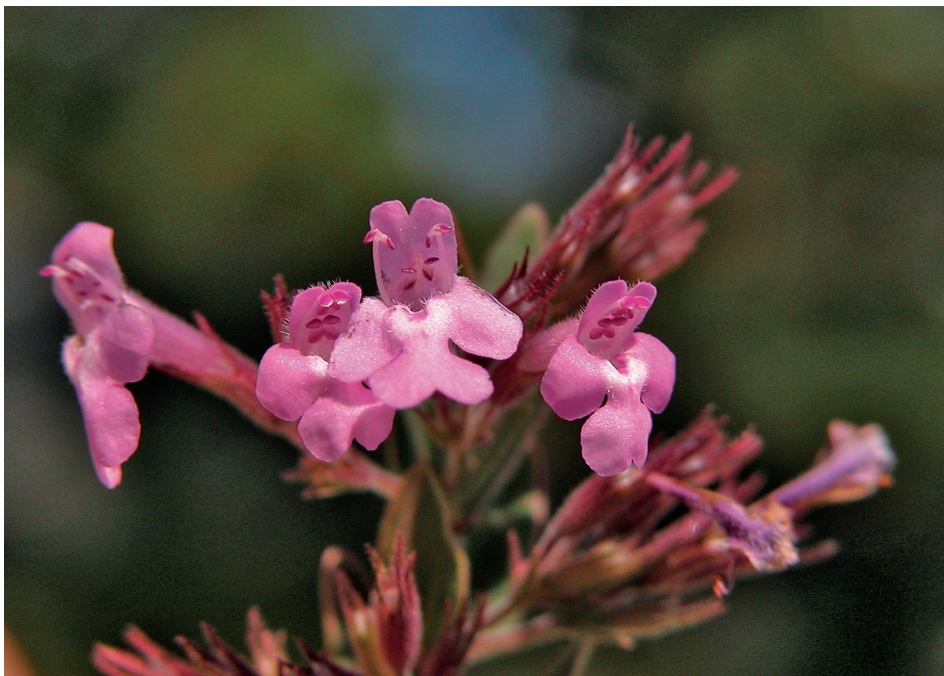
Slika 2. Micromeria croatica – cvijet; Kremer, 2015.