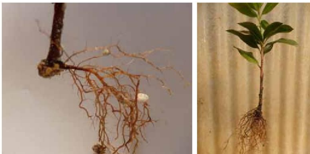
Slika 5. Razvoj korijena i izgled ožiljene reznice planike

Koliko je poznato, postoji malo sličnih istraživanja na ovoj voćnoj vrsti s kojima bi se mogli usporediti navedeni rezultati. Kod većine biljnih vrsta istražuje se mikropropagacija (Mereti i sur., 2002; Saranga i Cameron (2007)), a ako se radi o ožiljavanju reznica, uglavnom se istražuje utjecaj različitih koncentracija auksina, ali i ostalih biljnih hormona Metaxas i sur. (2008) na ožiljavanje reznica.