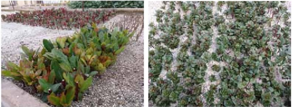
Slika 3. Reznice planike u postupku ožiljavanja Image 3. The strawberry tree cuttings in the process of rooting