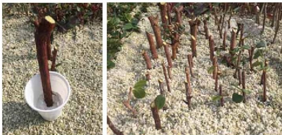
Slika 2. Tretiranje bazitonog dijela reznice planike indol maslačnom kiselinom (IBA, puder 3000 ppm) i stavljanje u supstrat na ožiljavanje

Duljina pripremljenih reznica iznosila je oko 15 cm. Bazitoni dio reznica tretiran je indol maslačnom kiselinom (IBA, puder 3000 ppm) i potom su reznice stavljene u supstrat za ožiljavanje (perlit) na tople stolove (Slika 2). Reznice su postavljene na razmak od oko 5x5 cm i na dubinu oko 5 cm. Ožiljavanje je trajalo 52 dana (Slika 3), uz konstantno praćenje temperature zraka (22-25 °C) i relativne vlažnosti zraka (od 80-95 %) koje se postizalo sustavom za orošavanje. Potom su reznice izvađene iz supstrata i utvrđen je razvoj kalusa (Slika 4), kao i postotak ožiljenih reznica, a jačina razvoja korijena koji je bio baziran na broju i duljini razvijenog korijena (Slika 5).