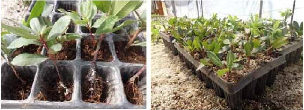
Slika 6. Presađivanje reznica planike s dobro razvijenim korijenom u kontejnere

Image 6. The planting of rooted cuttings of strawberry tree with well-developed root in the container