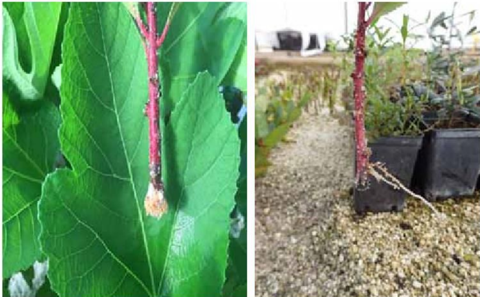
Slika 4. Stvaranje kalusa i ožiljavanje reznice planike Image 4. Callus development and rooting of the strawberry tree cuttings

Reznice uzete krajem siječnja (VU1) dobro su kalusirale, ali su slabo razvile korijen (Slika 4), a postotak ožiljavanja je iznosio 30% (Graf 1). Kod reznica koje su uzete krajem ožujka (VU2) korijen se dobro razvio (Slika 5) na 58% reznica (Graf 1) koje su uspješno nastavile s rastom nakon presađivanja u kontejnere (Slika 6).