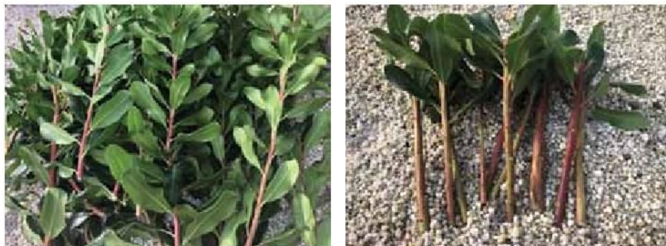
Slika 1. Uzimanje reznica planike i priprema za ožiljavanje

Reznice su uzete sa stabla lokalnog genotipa (područje Istre) u dva perioda: krajem siječnja (VU1) i krajem ožujka (VU2). Na vršnom dijelu reznice ostavljeno je od tri do pet listova (Slika 1) zbog izraženog juvenilnog stadija i smanjenja šoka, a na bazitonom dijelu listovi su uklonjeni ili su ostavljena jedan do dva lista.