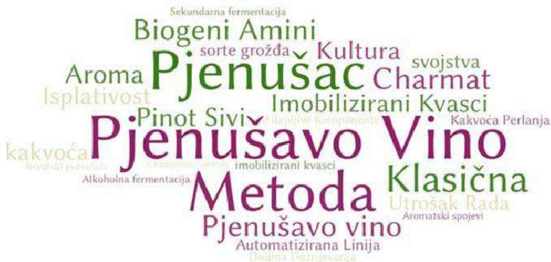
Slika 1. Ključne riječi u znanstvenim radovima (n=8) o pjenušavim vinima u RH 2009-2018., prema CRO-SBI (2019)

Tijekom provođenja istraživanja i proučavanja publikacija koje se bave analizom pjenušavih vina u RH, uočeno je kako su hrvatski istraživači, prema Hrvatskoj znanstvenoj bibliografiji, objavili svega 8 znanstvenih radova, od čega samo 2 u stranim časopisima, u razdoblju 2009.-2018. Pri tome su izdvojene ključne riječi (n=29) iz svih 8 radova i prikazane kao 'oblak riječi' na Slici 1. kako bi dobili uvid u konkretnije teme kod proučavanja pjenušavih vina. Uzimajući u obzir navedene podatke, ovaj rad je prvi koji se bavi definiranjem postojećih svojstava i kakvoće velikog broja pjenušavih vina s tržišta, proizvedenih na području Zagrebačke županije. U tu svrhu određivani su pojedinačni aromatski spojevi u vinu kojima su pridružene aktivne mirisne vrijednosti (OAV), kao temelj za stvaranje mirisnih serija za svaki pojedinačni uzorak. Krajnji rezultat istraživanja je dobivanje specifičnih aromatskih profila pjenušavih vina te njihovo grupiranje obzirom na područje (vinogorje) i metodu proizvodnje te korišteni sortiment.