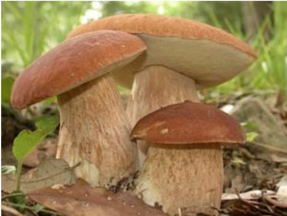
Slika 6. Ljetni vrganj

Vrstu Boletus aestivalis sinonim Boletus reticulatus pripada skupini ektomikoriznih gljiva. Klobuk je širok od 8-30 cm, vrlo promjenjive boje, uglavnom smeđast ili boje lješnjaka (slika 6). Klobuk je jako mesnat te po suhom vremenu ispucan. Cjevčice su u mladosti bijele, dok sa starenjem postaju žute do maslinastozelene. Prirasle su uz stručak, a s razvojem plodnog tijela lako se odvajaju od mesa klobuka. Stručak je visok 5-20 cm, u mladosti je trbušast, a s razvojem plodnog tijela postaje valjkast. Površina mu je mrežasta, svijetlosmeđe boje, a osnova stručka je bjelkasta. Meso je bijelo, mekano, ugodna mirisa i okusa. Spore su eliptično vretenaste, veličine 13-17 x 4-5 \mu\text{m} , a otusina je maslinastosmeđa. Raste u listopadnim šumama u ektomikoriznoj zajednici s hrastom ( Quercus sp. ), bukvom ( Fagus sp. ), grabom ( Carpinus sp. ) i kestenom ( Castanea sp. ). Ubraja se među najkvalitetnije vrste gljiva iz roda Boletus (Božac, 2008).