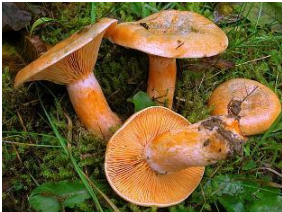
Slika 8. Smrekina rujnica

Smrekina rujnica ( Lactarius deterimus ) je vrsta koja pripada gljivama iz porodice Russulaceae . Klobuk je u najranijoj mladosti konveksno udubljen, a starenjem rub klobuka postaje uzdignut. Narančaste je boje sa zelenkastim pjegama, a po vlažnom vremenu je jako mazav (slika 8). Naraste od 3 do 10 cm široko. Listići su gusti i lagano se spuštaju niz stručak, boje klobuka. Stručak valjkast i šupalj, a naraste od 3 do 7 cm visoko i 0,5 – 2,5 cm debelo. Meso je blijedo žućkasto, a ispod kože klobuka narančasto-crvenkasto. Spore su okruglasto eliptične, veličine 7,5-10 x 6-7,5 \mu\text{m} . Smrekina rujnica raste u jesen, isključivo u simbiozi (ektomikoriza) sa smrekom ( Picea excelsa ) (Božac, 2008). Izvrsne je kakvoće, a prilikom determinacije potrebno je obratiti pažnju na narančasto mlijeko koje ispušta na presjeku te je isključena svaka mogućnost zamjene s nejestivim gljivama (Božac, 2008).