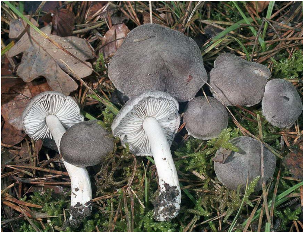
Slika 10. mišja vitezovka

Tricholoma terreum , u Hrvatskoj je poznatija pod nazivom mišek. Plodno tijelo mišje vitezovke građeno je od klobuka i stručka. Klobuk je širok od 4 do 6 cm, u mladosti je konveksan, a s razvojem plodnog tijela klobuk postane otvoren (slika 10). Prekriven je sa svilenkastim vlakancima sivocrne boje te je često radijalno ispucan. Listići su široki i lomljivi, prirasli su uz stručak, sive boje. Stručak je mekan i šupalj, u prosjeku je visok 3-6 cm, a boje mu je sivkasto bijela. Spore su eliptične, veličine 5-8 x 4-6 \mu\text{m} . Mišja vitezovka raste u kasnu jesen u simbiozi sa četinjačama, osobito ispod bora ( Pinus sp. ) i smreke ( Picea sp. ). Uglavnom raste u skupinama te se može pronaći u parkovima ispod navedenih simbiotskih vrsta, a u Republici Hrvatskoj raste na svim područjima gdje ima borove i smrekove šume (Božac, 2005).