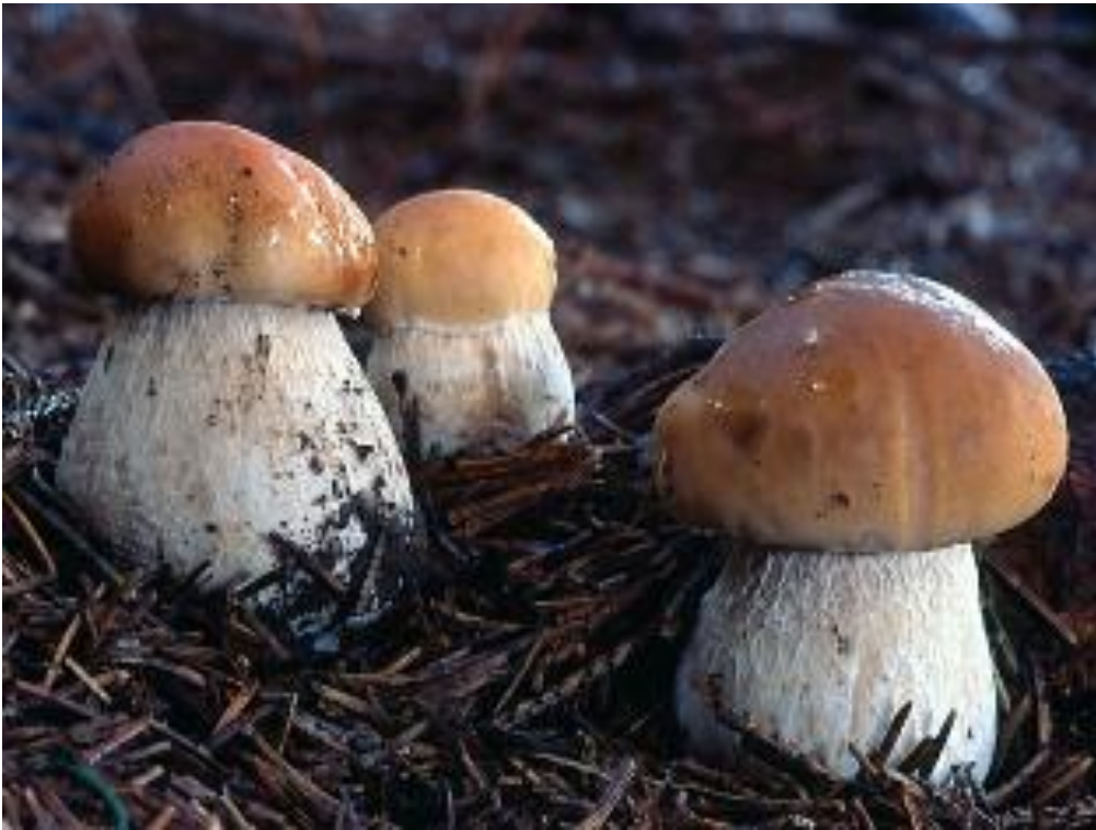
Slika 7. Crnogorični vrganj; izvor: www.fungi.fvlmedia.dk

Crnogorični vrganj ( Boletus edulis ) je vrsta koja taksonomski pripada razredu Basidiomycetes , porodici Boletaceae te rodu Boletus . Široko je rasprostranjen u zemljama Europe. Klobuk je mesnat, smeđe boje, što najviše ovisi o staništu (slika 7). Naraste 5-30 cm široko, a u mladosti je polukuglast, zatim sa starenjem postaje potpuno raširen. Cjevčice su žuto-zelene i lako se odvajaju od plodnice klobuka. Stručak je 5-15 cm visok i 2-7 cm deo, a prema dnu je često zadebljan. Smeđaste je boje, a ponekad ima vidljivu blijedu mrežicu. Spore su maslinasto smeđe, veličine; 12-16 x 4-5 \mu\text{m} (Božac, 2008). B. edulis je ektomikorizna gljiva koja raste u ljeti i u jesen po crnogoričnim šumama u simbiozi sa smrekom ( Picea sp. ) i jelom ( Abies sp. ), na nadmorskoj visini do 3500 m. Vrganji se pojavljuju u mnogo varijeteta te dolazi do zabuna prilikom sakupljanja gljiva, međutim, sve su varijacije izvršne kakvoće pa nema bojazni od trovanja (Božac, 2008).