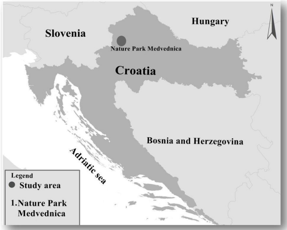
Slika 11. Područje prikupljanja uzoraka Park prirode Medvednica

Predmetno istraživanje je provedeno na području Parka Prirode Medvednica u sjeverno-zapadnom dijelu zagrebačke županije (slika 11). Područje istraživanja je prekriveno sa dobro očuvanom prirodno opadajućom i mješovitom šumom hrasta, bukve, običnog graba, pitomog kestena, smreke, javora i poljskog jasena. Makrofungalni uzorci su prikupljeni tijekom jeseni 2012. (od rujna do prosinca). Razine teških metala (željeza, cinka i bakra) su analizirane u 10 vrsta jestivih gljiva (20 uzoraka po vrsti). Prikupljene vrste gljiva činila su četiri kopnena saprofita ( Agaricus campestris (L) Fries, Clitocybe inversa (Scop. Ex Fr.), Clitocybe nebularis Batsch. Ex Fr. i Marcolepiota procera (Scop. Ex.Fr) Sing), jedna lignocelulozna gljiva – Armillaria mellea (Vahl. Ex Fries) Karst), i pet ektomikorizalnih vrsta ( Boletus aestivalis Paulet ex Fries, Boletus edulis Bull. ex Fries, Lactarius deterrimus Groger, Tricholoma portentosum (Fr.) Quelet, Tricholoma terreum (Schff. ex Fr.) Kummer). Potpuno razvijena i zrela plodna tijela gljiva prikupljena su slučajnim odabirom. U isto vrijeme, uzorci gornjeg sloja šumskog tla (0-10 cm) su prikupljeni na mjestima uzorkovanja gljiva. Determinacija gljiva obavljena je prema uobičajenim ključevima i ikonografijama prema Bošcu (2005), i Bošcu (2008). Svi uzorci su analizirani u tri ponavljanja.