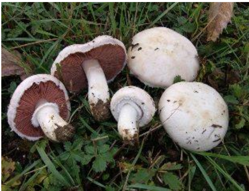
Slika 1. Poljska pečurka

Naziv campestris izvod je iz latinske riječi campus , što znači teren. Vrsta Agaricus campestris pripada rodu Agaricus kojih ima u mnogo varijeteta, a uglavnom su izvanredno ukusne gljive. Klobuk joj je bijel, pahuljasto svilenkast, a ponekad i čehav. Polukuglast je u mladosti, a sa starenjem postane konveksan. Naraste u širinu od 5 do 12 cm. Listići su slobodni i gusti, crvenkaste boje, a starenjem postaju tamniji do gotovo crni. Stručak je visok 3-10 cm, uglavnom bijele boje, gladak, pun te prema dnu lagano zadebljan (slika 1). Poljska pečurka posjeduje vjenčić koji se starenjem gubi. Meso je bijelo, a na prerezu dobiva crvenkastu boju. Spore su eliptične, potpuno zrele su smeđe boje, a veličine su 5-9 x 6 \mu\text{m} . A. campestris raste od svibanja pa sve do kraja jeseni, skupno ili pojedinačno, uglavnom po livadama, pašnjacima, kukuružištima te se ponekad može naći i uz same rubove šume (Božac, 2003).