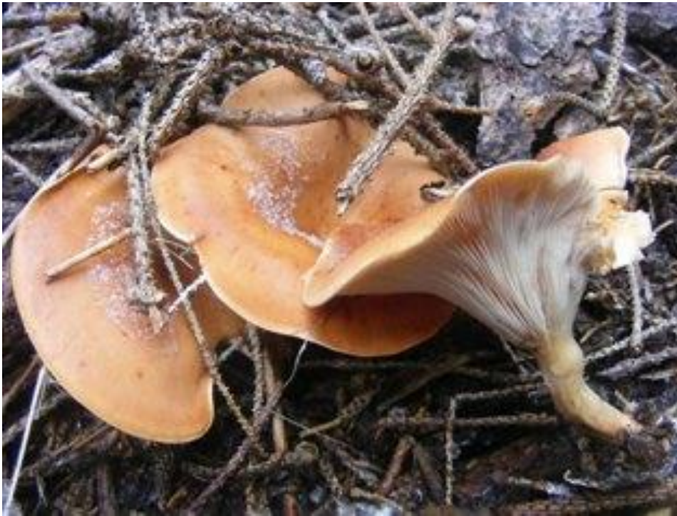
Slika 3. Žuta uleknjača; izvor: www.fungi.fvlmedia.dk

Žuta uleknjača sistematski pripada u skupinu gljiva iz porodice Triholomataceae . Klobuk je slabo mesnat, žuto-crvene boje, jako je ulegnut poput lijevka, a širine je od 5 do 10 cm. Vremenske prilike mogu značajno utjecati na boju klobuka. Površina klobuka može biti prekrivena sitnim čehicama. Listići su gusti i spuštaju se dugo niz stručak. Smeđe-crvene su boje te se lako odvajaju od klobuka. Stručak je visine od 3–7 cm, crvenkasto-bijele boje i prema dnu je zadebljan (slika 3). Meso je bijelo, ali dosta tvrdo i žilavo, slatkastog okusa. Spore su bijele, okruglasto eliptičnog oblika, veličine 3-5 x 2,5-4 \mu\text{m} . Raste u jesen, formirajući krugove ili polukrugove u listopadnim i crnogoričnim šumama (Božac, 2005).