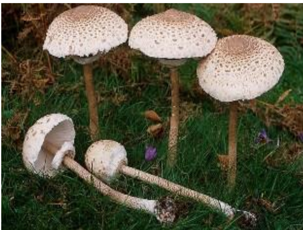
Slika 5. Sunčanica; izvor: www.fungi.fvlmedia.dk

Sunčanica ( Macrolepiota procera ) pripada skupini gljiva iz razreda Basidiomycetes . Specifičnog je plodnog tijela nalik suncobranu. Klobuk je širok 10-30cm, u mladosti okrugao, dok s razvojem gljive postaje otvoren. Sivosmeđe je boje s vidljivim ispupčenjem na sredini te je prekriven s ljuskama (slika 5). Listići su gusti, bijeli i mekani, a drže se za ovratnik ( collarium ) tako da su od stručka odmaknuti oko 1,5 mm. Stručak je visok od 20 do 40 cm, cilindričan, vlaknast i šupalj, a na dnu je gomoljasto zadebljan. Smeđe je boje s pomičnim vjenčićem. Meso klobuka je bijelo i mekano, dok je stručak tvrd i žilav. Miris je ugodan, a okus dobar i podsjeća na lješnjak. Spore su bijele i eliptične, veličine 10-20 x 9-14 \mu\text{m} . Raste pojedinačno ili u skupinama u ljetnim i jesenskim mjesecima u svim šumama. Izvrsne je kakvoće, međutim upotrebljavati treba samo klobuk jer je stručak žilav i tvrd (Božac, 2005).