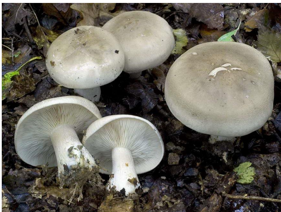
Slika 4. Maglenka

Maglenka pripada skupini saprofitskih vrsta gljiva koja je široko rasprostranjena po šumama Hrvatske. Klobuk je širok 6-20 cm (2-8 cm) u promjeru, mesnat i konveksan, uvijena ruba. Boja klobuka je sivkasta do svijetlo-smeđe siva (slika 4), a često je posut svijetlim prahom, dok se kožica klobuka lako guli. Listići su vrlo gusti i spuštaju se niz stručak. Žućkaste su boje te se lako odvajaju od mesa klobuka. Stručak je debeo, prema dnu je zadebljan, a sa starenjem postaje šupalj te se lako lomi. Boja stručka je svjetlija od boje klobuka. Meso je bijelo i vlaknasto, jakog mirisa koji podsjeća na upaljeno brašno (Božac, 2003), dok je okus trpak. Spore su žute i ovalne, veličine 6-8 x 3-4 \mu\text{m} . Raste u kasnu jesen u crnogoričnim i bjelogoričnim šumama u velikim skupinama, krugovima ili redovima, kao i modrikača ( Lepista nuda Pers.) (Božac, 2005).