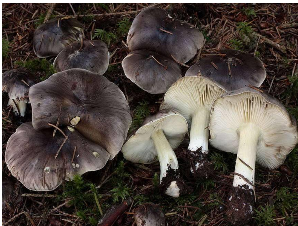
Slika 9. najbolja vitezovka; izvor: www.fungi.fvlmedia.dk

Gljiva Tricholoma portentosum jedna je od najkvalitetnijih gljiva iz roda Tricholoma . Velika je i impozantna gljiva s klobukom širine 5 – 15 cm. Klobuk je u mladosti polukružan ili zvonolik, zatim s razvojem postane ispupčen. Često je radijalno ispucan s tamno sivim radijalno postavljenim vlakancima (slika 9). Kožica klobuka se lako guli, a rub je izvnut, tanak i valovit. Listići su srednje gusti, odmaknuti od stručka, žućkaste boje. Stručak je cilindričan i zadebljan na dnu. S razvojem plodnog tijela stručak postane šupalj i bjelkastožute boje. Spore su eliptične i bijele, veličine 7-8 x 2-4 \mu\text{m} (Božac, 2008). Ektomikorizna je vrsta koja raste u simbiozi s borom ( Pinus sylvestris ), ali također se može naći i u simbiozi s hrastom ( Quercus sp. ) ili bukvom ( Fagus sp. ). Pri determinaciji vrste treba obratiti pozornost da se ne zamijeni s vrstom Tricholoma virgatum (Fr. ex Fr), koja nije jestiva (Božac, 2005).