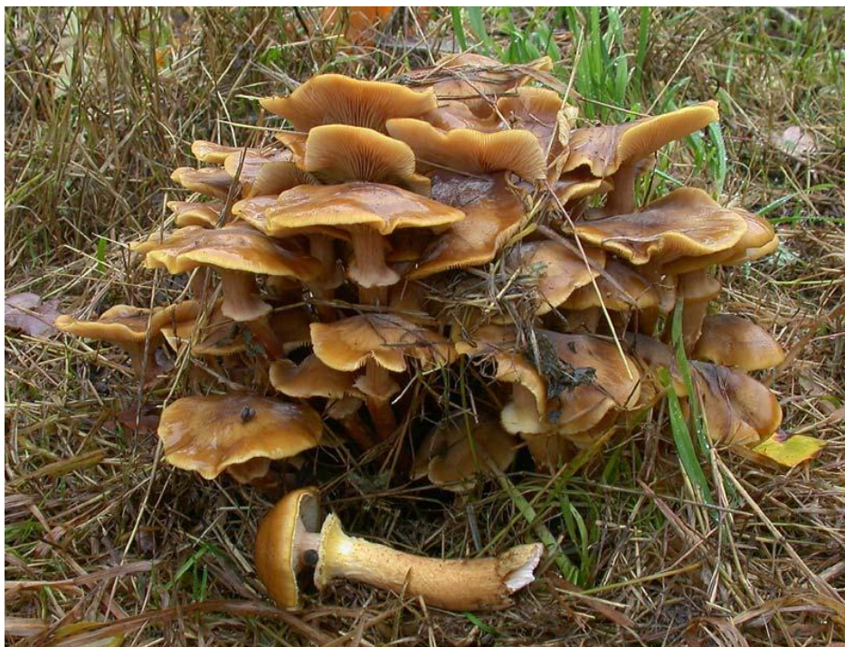
Slika 2. Medena puza; izvor: www.fungi.fvlmedia.dk

Vrsta Armillaria mellea sistematski pripada u razred Basidiomycetes , red Agaricales , porodicu Tricholomataceae i rod Armillariella (Božac, 2003). Plodno tijelo gljive sastoji se od klobuka i stručka. Klobuk je mesnat i žućkast poput meda te je prekriven tamnijim čehama. U mladosti je okruglast, dok sa starenjem postaje potpuno otvoren. Naraste u širinu od 5 do 10 cm. Listići su bijeli, a starenjem postaju crvenkasti, gusti su i prirasli uz stručak. Stručak je visok 5-15 cm i može varirati u širini. Žutosmeđe je boje, a prema dnu postaje crnkast i zadebljan (slika 2). Stručak ima trajan vjenčić bjelkaste boje. Meso je bijelo, neizražena okusa. Spore su eliptične i bijele, veličine 5-10 x 5-6 \mu\text{m} . Medena puza raste busenasto u jesenskim mjesecima u hrastovim, grabovim i crnogoričnim šumama, uglavnom na panjevima, ali može rasti i na živom drvu. Jestiva je vrsta, ali se upotrebljava samo klobuk jer je stručak tvrd i vlaknast (Božac, 2005).