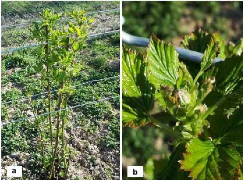
Slika 1. Kupina sorte 'Reuben' posađena iz mikropropagairane sadnice: (a) uspravan rast i (b) cvjetni pup krajem ožujka

Figure 1. Micropropagated blackberry 'Reuben' planted under field conditions: (a) erect growth and (b) floral bud at the end of March