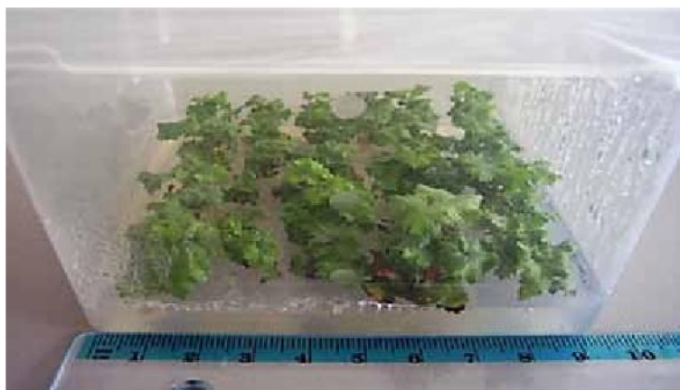
Slika 3. Izdanci dobiveni aksilarnim grananjem na PM mT 0,3 Figure 3. Shoots produced by axillary branching on PM mT 0.3