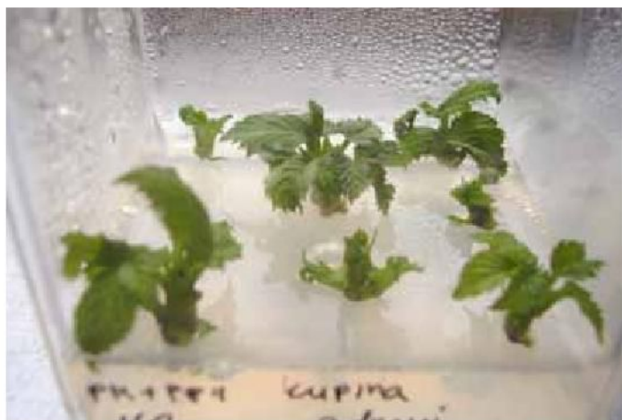
Slika 2. Mikroizdanci na EM 1 mediju Figure 2. Microshoots on EM 1 medium