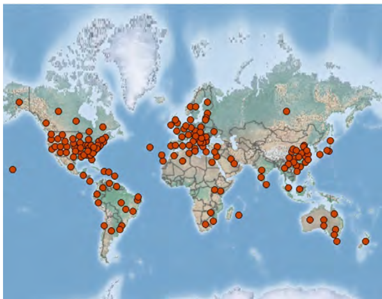
Slika 1. Rasprostranjenost kalifornijskog tripsa u svijetu Figure 1. Distribution of western flower thrips worldwide