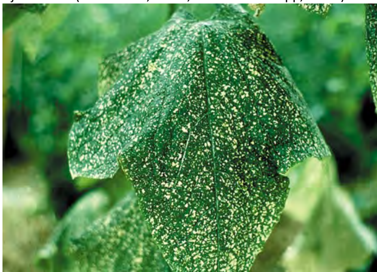
Slika 3. Štete od ishrane kalifornijskog tripsa na listu krastavca Figure 3. Feeding damages of western flower thrips on cucumber leaf

temperaturi, pa cijeli razvojni ciklus može završiti za 15 dana pri temperaturi od 30 °C, odnosno za 44 dana pri temperaturi od 15 °C. Ženka prosječno odloži između 20 i 40 jaja, a najveći utvrđeni reproduktivni uspjeh iznosi 95,5 % pri temperaturi od 20 °C. Štetni su stadiji kalifornijskog tripsa odrasli oblici i ličinke, koji štete čine bodenjem biljnog tkiva radi ishrane ili odlaganja jaja. Simptomi ovise o biljci domaćinu, a najčešće oštećuju list i plod biljke. Na krastavcima štete čini na listu, i to već u rasadu. Poslije se u vegetaciji oštećenja manifestiraju u obliku srebrnastih pjega nepravilna oblika (Slika 3). Osim izravnih šteta zbog sisanja biljnih sokova, ovaj je štetnik i vektor nekih vrlo važnih biljnih virusa (Ishida i sur., 2003.; Buitenhuis i Shipp, 2008.).