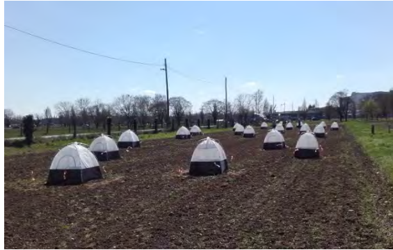
Slika 1. Postavljeni entomološki kavezi

uspješno prezimile, na svaku je parcelu postavljen entomološki kavez (slika 1) u koji su prikupljane krumpirove zlatice.