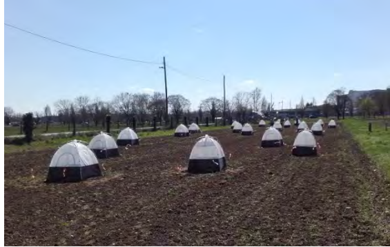
Slika 1. Postavljeni entomološki kavezi

uspješno prezimile, na svaku je parcelu postavljen entomološki kavez (slika 1) u koji su prikupljane krumpirove zlatice.