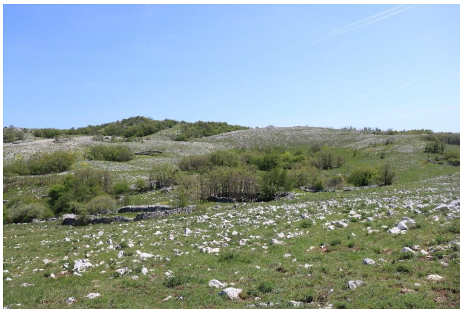
Slika 2. Kamenjarski pašnjaci na vrhu Plominske gore