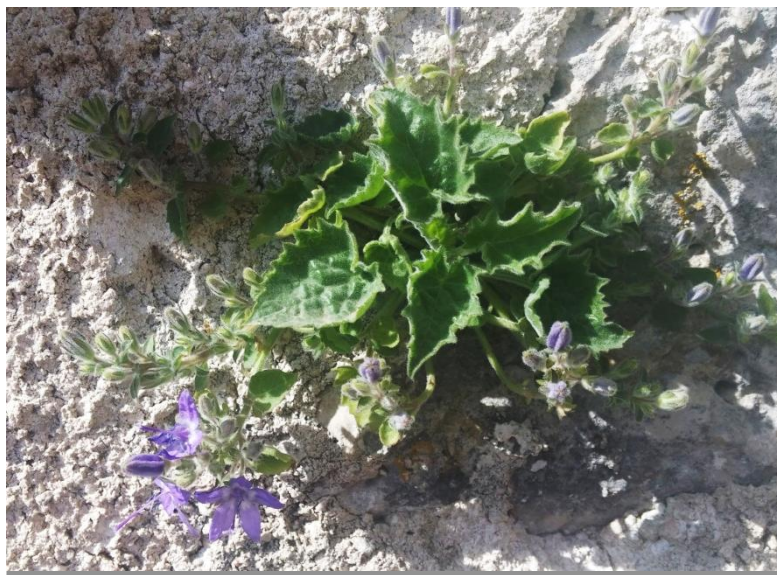
Slika 6. Subendemična Campanula fenestrellata Feer ssp. istriaca (Feer) Damboldt - istarski zvončić, obrašta zidine starog grada Plomina te obilno cvate kraje travnja

Osim ove vrste, na širem području Plominske gore i PP Učka rastu još dvije endemične biljne vrste, obje su gotovo ugrožene (NT) svojte: Campanula tommasiniana C. Koch (Tomasinijev zvončić) i Campanula justiniana Witasek (Justinijanov zvončić). Na Učki raste Leontopodium alpinum Cass. ssp. krasense Derganc (krški runolist), varijetet s Dinarskoga gorja (Šugar, 1971) koji spada u kategoriju osjetljiva (VU) svojta te endemična vrsta Dinarskoga gorja Berberis croatica Horvat (hrvatska žutika) spada u gotovo ugrožene (NT) svojte Hrvatske flore. Do nedavno se smatralo da hrvatska žutika pripada vrsti s obronaka Etne, i stoga je bila opisana pod imenom etnanske žutike ( Berberis aetnensis C.Presl) (Bertoša i Matijašić, 2005; Turnšek i sur., 2006).