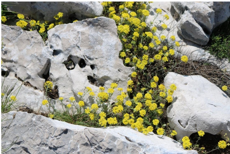
Slika 4. Alyssum austrodalmaticum Trinajstić (austrodalmatinska gromotulja ili turica) na Plominskoj gori