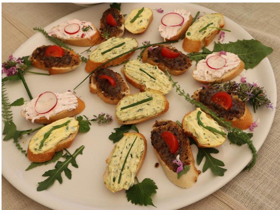
Slika 7. Maštovita jela i namazi s dodatkom samoniklog bilja u lokalnom restoranu "Dorina" u Plominu

Današnji stanovnici Plomina također su vrlo čvrsto povezani s prirodom koja ih okružuje. Pokušavaju se prilagoditi okruženju koje puno daje, ali istodobno ne dopušta puno, što ostaje izazov i u moderno doba. Intenzivno upravljanje poljoprivredom na skromnim zemljištima i u sušnim uvjetima naravno nije moguće, pa su prihodi od turizma itekako dobrodošli. Međutim, mještani su svjesni da je i to održivo samo do određene mjere. Oni se jako zalažu za ekološku i održivu upotrebu krajobraza i namjenu njegovih dobara. Nastoje živjeti što više u suživotu s prirodom i oživjeti uporabu samoniklog bilja u ljekovite svrhe te povezati upotrebu samoniklog bilja s gastronomijom.