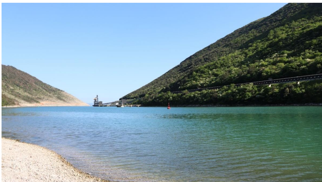
Slika 9. Plominski zaljev, luka se nalazi na samom kraju 4 km dugog i 250 do 400 m uskog zaljeva

Ljubav prema prirodi i svom okruženju vjerojatno su posebno snažni zbog nepromišljenih zahvata u prirodnom okruženju za potrebe nekog drugog dobra, bez kojeg danas ne znamo živjeti - struje. Davne 1969. godine na samom rubu Plominskog zaljeva izgrađena je termoelektrana na ugljen, zbog koje je livadana dnu zaljeva djelomično poplavljena. Iako je termoelektrana vratila ljudima radna mjesta, također je unakazila krajobrazne vizure i idiličnu sliku tradicionalnog istarskog mjesta (Mišetić i sur., 2008). Unatoč protivljenju mještana i lokalnih vlasti zbog onečišćenja, 2000. godine izgrađen je još jedan terminal koji je inače udovoljavao višim ekološkim standardima (Oštrić, 2014). No, ogroman crveno-bijeli dimnjak vizualno šteti okolini, a promijenjena je i obala uskog zaljeva, gdje prolazi željeznička pruga za transportni prijevoz ugljena od iskrcaja u luci do termoelektrane.