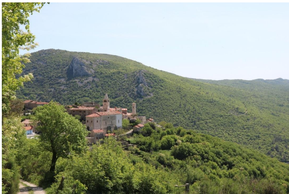
Slika 1. Pogled na mjesto Plomin

Cilj ovog stručnog rada je prikazati određene tematske nastavne jedinice koje su obrađene praktično u vidu terenske nastave koja obuhvaća predmete: "Fitocenologija" i "Ekologija staništa i biljnih zajednica", a koji se izvode na Agronomskom fakultetu Sveučilišta u Zagrebu.