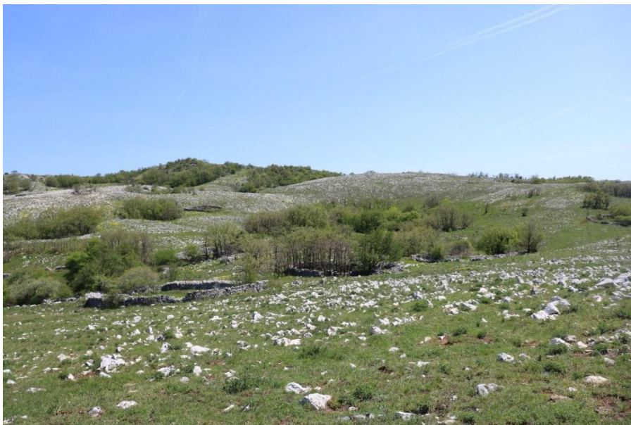
Slika 2. Kamenjarski pašnjaci na vrhu Plominske gore