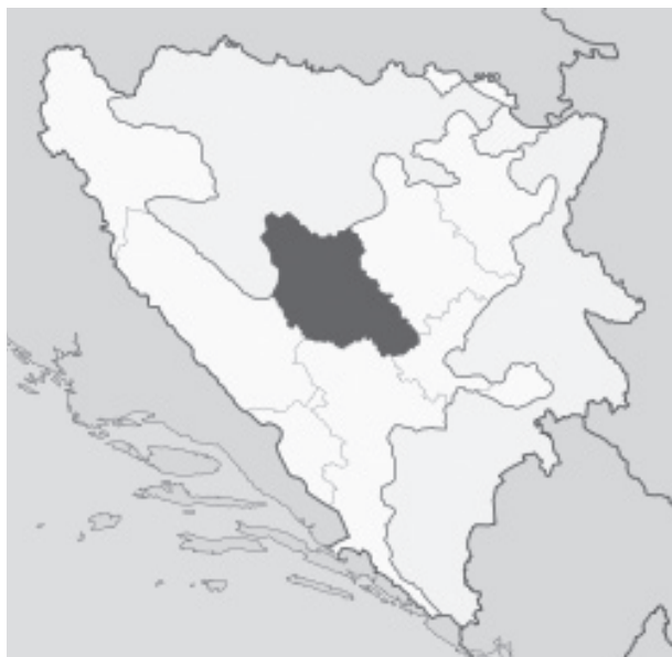
Slika 1. Prikaz Županije Središnja Bosna

Administrativnom podjelom Federacija Bosna i Hercegovina je sastavljena od deset županija među kojima se nalazi i županija Središnja Bosna koja čini prostorni okvir ovog rada. Sam naziv županije sugerira na njen geografski smještaj u središnjem dijelu Bosne i Hercegovine, gdje se prostire na ukupnoj površini od 3.189 km 2 (Strategija razvoja SBK 2016-2020, 2016.). (slika 1). Županija Središnja Bosna na sjeverozapadu i sjeveru graniči s Republikom Srpskom, na sjeveroistoku sa Zeničko-dobojskom županijom, na jugoistoku sa Sarajevskom, dok na južnom i jugozapadnom dijelu graniči s Hercegovačko-neretvanskom odnosno Hercegbosanskom županijom (Strategija razvoja SBK 2016-2020, 2016.).