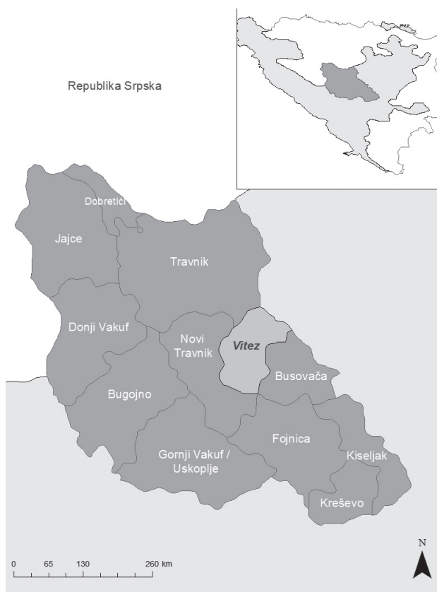
Slika 2. Prikaz općine Vitez (izradila Gugić K. – Arc Map)

Biljke su raspoređene u 39 porodica, među kojima su najzastupljenije: Rosaceae (8 vrsta, 66 spominjanja), Asteraceae (7 vrsta, 50 spominjanja) i Lamiaceae (6 vrsta, 38 spominjanja).