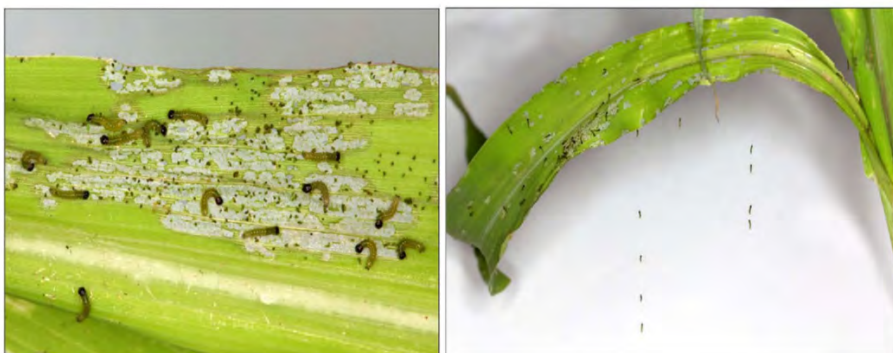
Slika 4. Štete na kukuruзу i male gusjenice na svilenim nitima

svilenih niti (slika 4). To im omogućuje brzo i jednostavno širenje na velike površine, ali i na druge biljke kojima se hrane (Visser, 2017.).