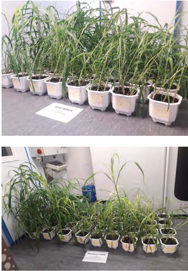
Slika 4. Rezistentna populacija divljeg sirka s lokaliteta Dubrovčak Lijevi tretirana linearno rastućim (od ½ do 64 x veća doza od registrirane) dozacijama herbicida foramsulfurona (gore), imazamoksa (sredina) i nikosulfurona (dolje)

Otkriće rezistentnih populacija u Republici Hrvatskoj velik je problem za cjelokupnu biljnu proizvodnju. Rezistentne populacije divljeg sirka potvrđene u usjevu kukuruza opasnost su i za ostale usjeve zakorovljene tom korovnom vrstom, a u kojima se koriste ALS herbicidi. Još su veći problem utvrđene rezistentne populacije ambrozije, i to iz nekoliko razloga. Prvo, ambrozija je najzastupljenija širokolisna korovna vrsta okopavinskih usjeva Hrvatske (Šarić i sur., 2011.). Drugo, za suzbijanje ambrozije u usjevu soje u post-emergence roku primjene nema alternativnih herbicida jer se suzbijanje donedavno obavljalo isključivo ALS herbicidima (okasulfuron, tifensulfuron i imazamoks). I treće, rezistentne populacije ambrozije svakako su potencijalni problem i u drugim okopavinskim usjevima gdje se redovito koriste ALS herbicidi (kukuruz, tolerantni suncokret, strne žitarice). Stoga je u daljnjim istraživanjima potrebno testirati te populacije na sve ALS herbicide koje se koristi u ratarskim i povrtnim kulturama.