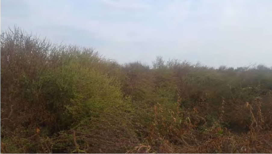
Slika 3. Usjev soje zakorovljen populacijom ambrozije rezistentne na herbicid okasuslfuoron na lokaciji Johovec

Za razliku od divljeg sirka kojemu je u Europi već dokazana rezistentnost na ALS herbicide, podataka o rezistentnim populacijama ambrozije u Europi nema. Stoga su ovi nalazi o rezistentnim populacijama ambrozije na ALS herbicide u Hrvatskoj i prvi službeni nalazi za tu vrstu u Europi (slika 2).