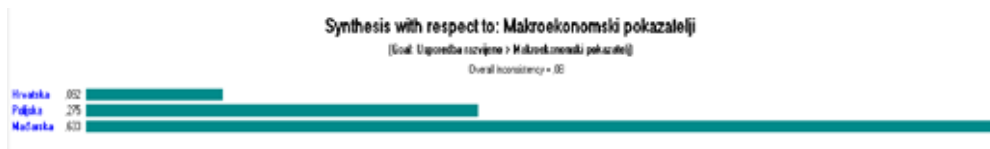
Slika 2. Rezultati vrednovanja makroekonomskih pokazatelja

žom produktivnosti od 7.184,29 €/gospodarstvu. Sukladno izračunima, najmanja pokrivenost uvoza izvozom poljoprivrednih proizvoda je u Hrvatskoj (68,79%), dok su Mađarska (148,41%) i Poljska (151,68%) značajni neto izvoznici. Od usporednih zemalja Poljska je jedina promatrana zemlja koja bilježi rast investicija u poljoprivredi, te isti iznosi 2%, dok Mađarska i Hrvatska bilježe negativne stope rasta investicije od, -0,5% i -8,7%.