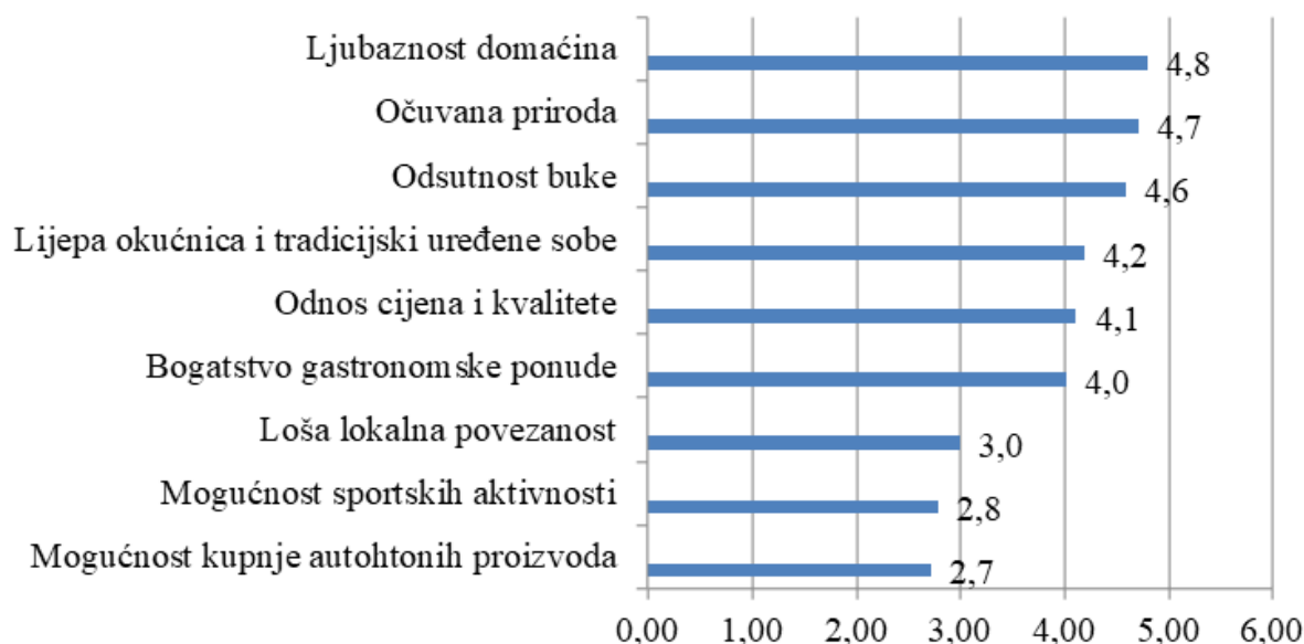
Grafikon 3. Čimbenici zadovoljstva boravkom na agroturističkom gospodarstvu

ponude. Loše ocjenjeni su lokalna povezanost, mogućnost sportskih aktivnosti i mogućnost kupnje autohtonih proizvoda (Grafikon 3). Prosječna ocjena ukupnog dojma boravka na gospodarstvu je 4,2.